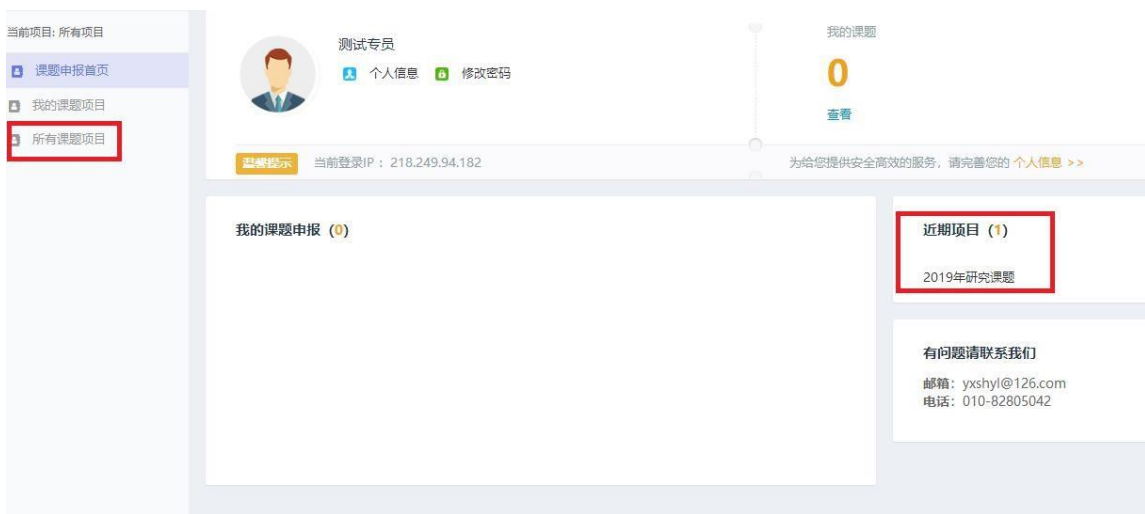
图 6 个人中心首页

方式二：点击左侧菜单【所有课题项目】，可看到所有课题项目，包括未开放的课题项目。