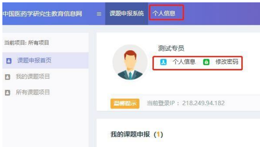
图 4 个人中心首页