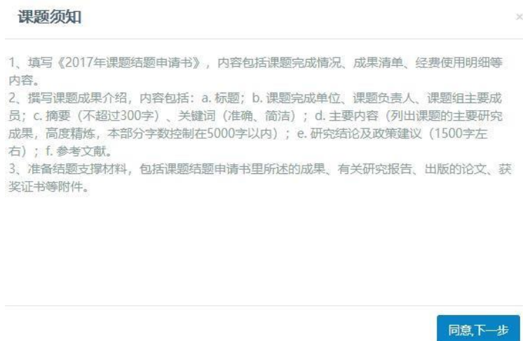
图 17 课题结题申请须知界面