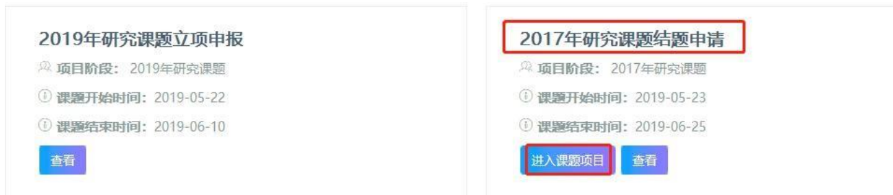
图 16 进入“2017年研究课题结题申请”界面

进入课题项目界面（参见“三、课题立项申报”中的“1.提交课题立项申请书”），选择“2017年研究课题结题申请”，点击“进入课题项目”。