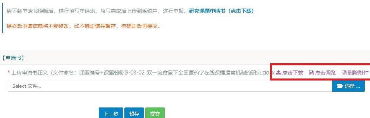
图 9 修改提交申请书界面