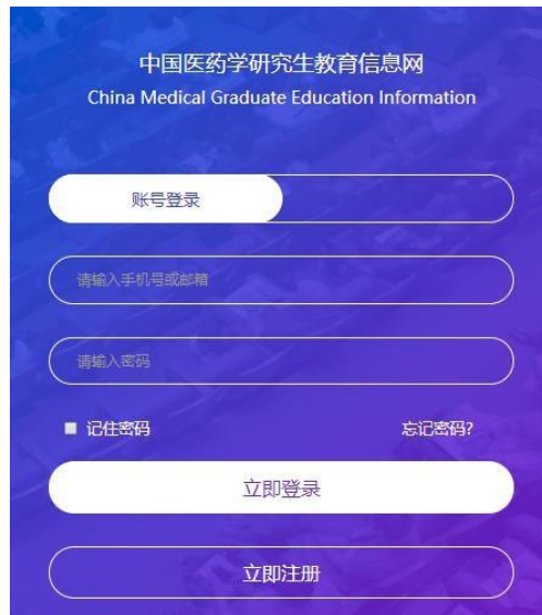
图 2 个人登录界面

登录可采用手机号或邮箱两种方式，平台支持通过手机号或邮箱找回密码，点击【忘记密码】，输入要找回密码的手机号或邮箱（注册时填写的信息），获取平台发送的验证码，设置新密码。