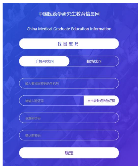
图 3 找回密码界面

登录可采用手机号或邮箱两种方式，平台支持通过手机号或邮箱找回密码，点击【忘记密码】，输入要找回密码的手机号或邮箱（注册时填写的信息），获取平台发送的验证码，设置新密码。