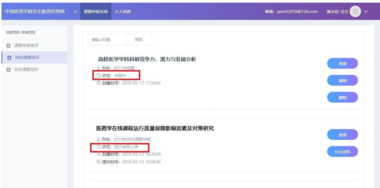
图 11 课题信息汇总界面

状态为“申报中”，表示课题还未提交，可以进行修改、删除操作。 已提交的项目不得修改、删除。