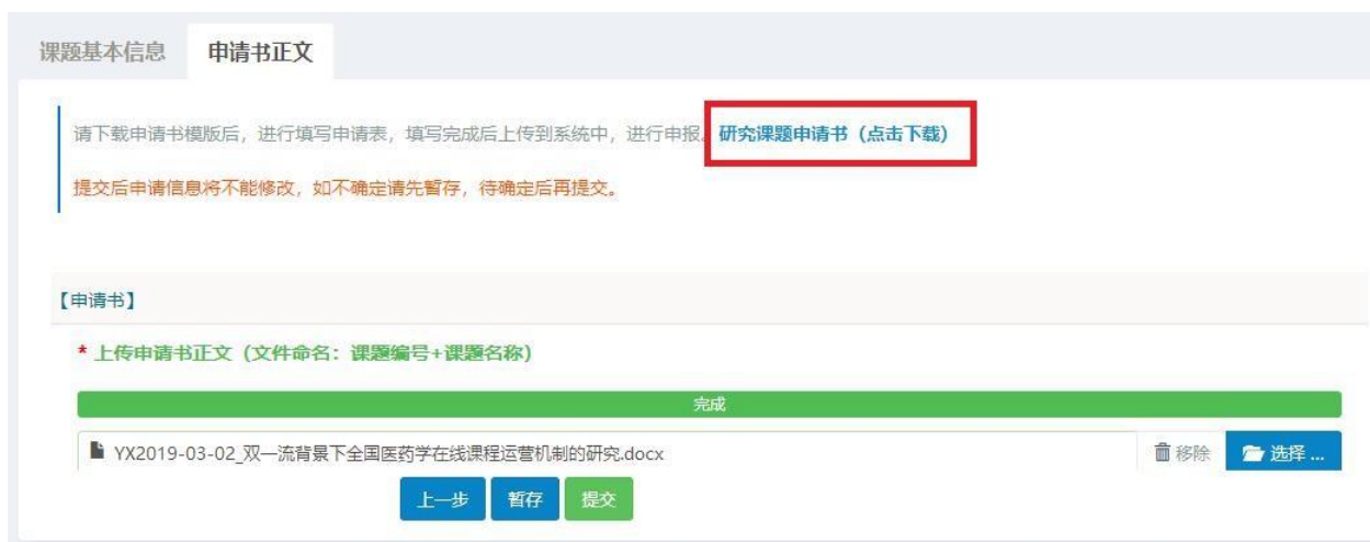
图 8 提交课题申请书界面

注：课题立项评审一般为匿名评审，申报人所上传的申报书中请勿包含课题负责人及课题组成员信息（包括姓名、联系电话、邮箱、所在单位等），如有发现未匿名者，将撤回申请。