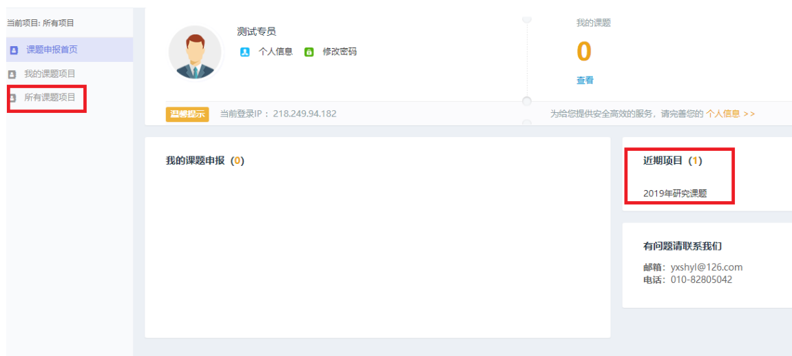
图 7 个人中心首页

方式二：点击左侧菜单【所有课题项目】，可看到所有课题项目，包括未开放的课题项目。