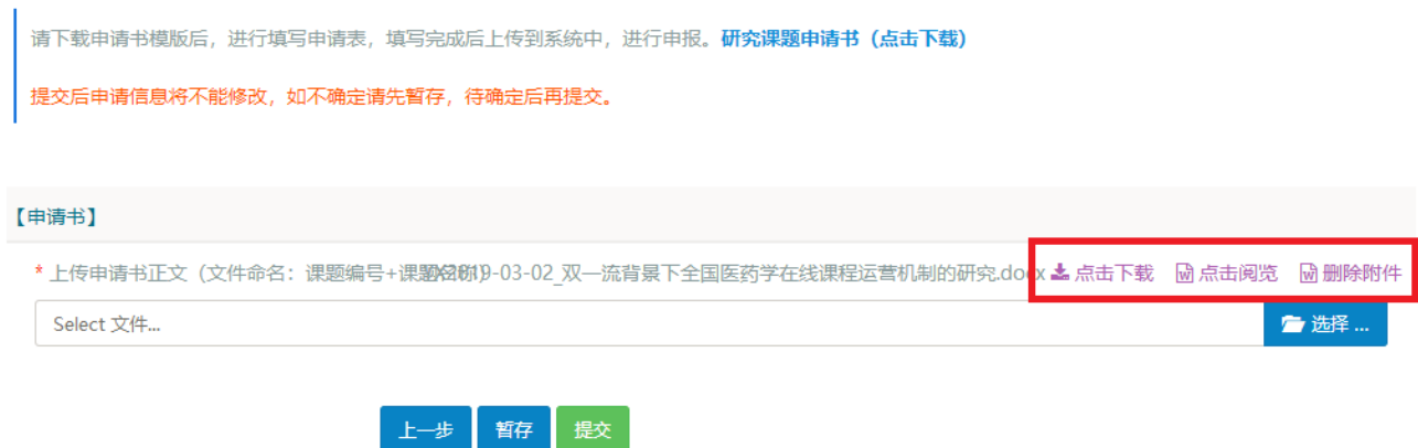
图 12 修改提交申请书界面

点击“提交”，课题进入“学校审核”环节。每位用户每个课题项目只能申请 1 个课题， 申请书提交后，不能修改，在该课题项目中也无法再次提交课题，