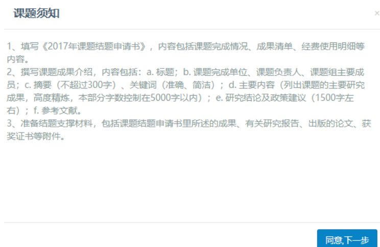
图 17 课题结题申请须知界面