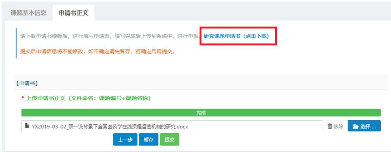
图 11 提交课题申请书界面

上撰写课题申请内容，文件命名格式“课题编号+课题名称”，上传课题申请书，文件格式为 docx。