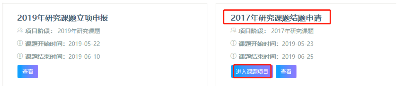
图 16 进入“2017年研究课题结题申请”界面

进入课题项目界面，参见“错误!未找到引用源。错误!未找到引用源。”，选择“2017年研究课题结题申请”，点击“进入课题项目”。