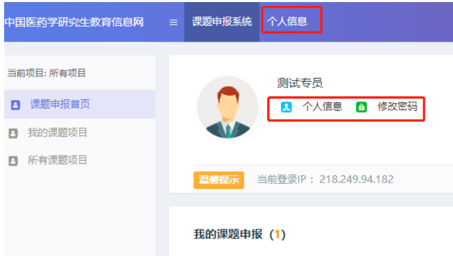
图 5 个人中心首页