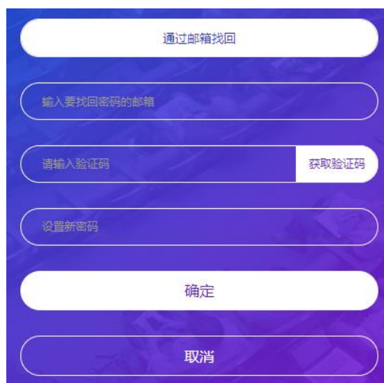
图 4 找回密码界面

登录可采用手机号或邮箱两种方式，平台支持通过邮箱方式找回密码，点击【忘记密码】，输入要找回密码的邮箱（注册时填写的邮箱信息），进入邮箱获取平台发送的验证码，设置新密码。