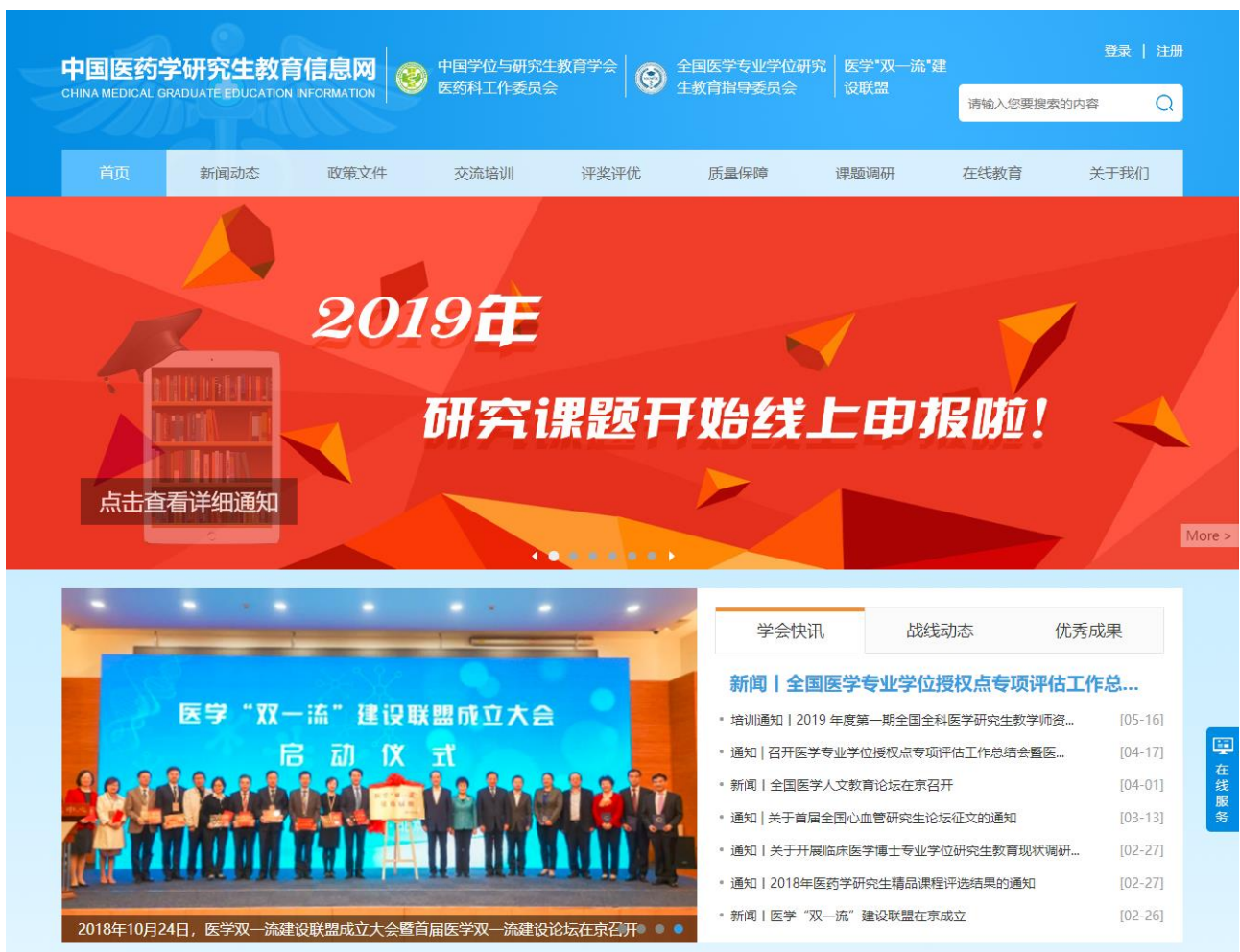
图 1 平台首页

中国医药学研究生教育信息网(简称“平台”)地址为: http://www.medgrad.cn (建议使用 Google Chrome 浏览器或 IE9 及以上版本浏览器、分辨率 1024*768 以上, 如果使用 360 浏览器, 请调整为极速模式, 浏览器缩放比例为 100%)。平台分为首页、新闻动态、政策文件、交流培训、评奖评优、质量保障、课题调研、在线教育、课题申报等模块, 平台首页如图所示: