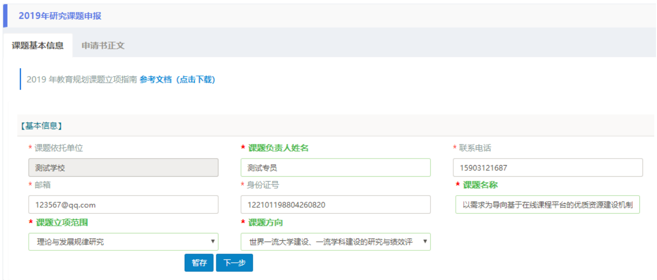
图 10 课题立项申请基本信息填写界面

课题立项范围、课题方向：详细信息可以点击【 参考文档（点击下载） 】，查看《2019 年教育规划课题立项指南》文件。