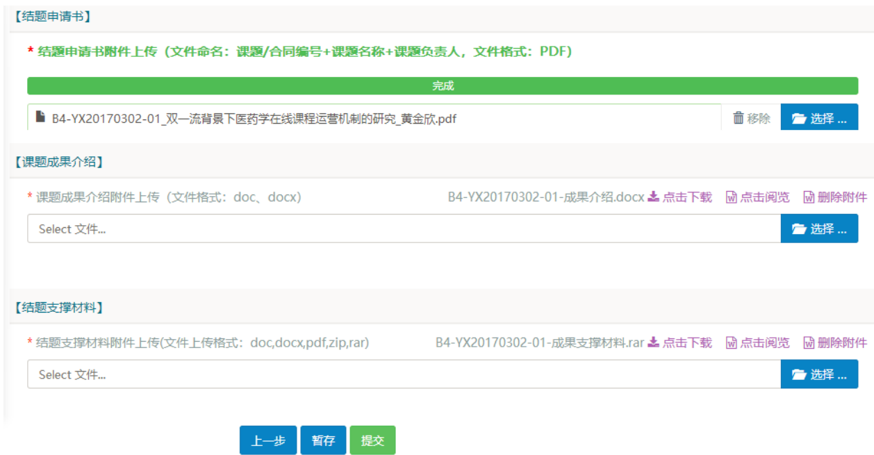
图 20 课题结题附件暂存后界面