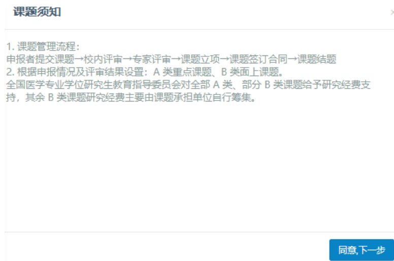
图 9 课题立项申请须知界面