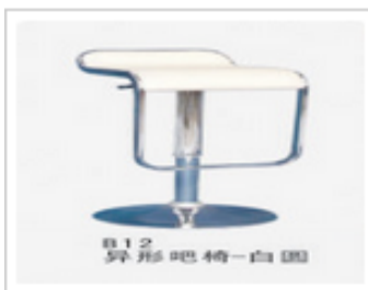
异形吧椅--白圆 型号：B12