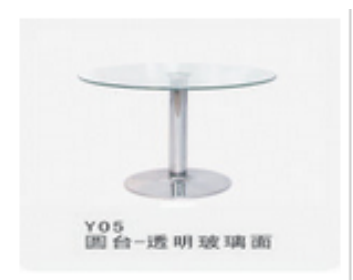
圆台--透明玻璃面 型号： Y05