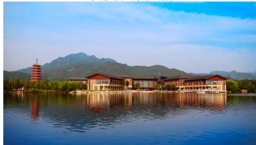
北京雁栖岛国宾别墅