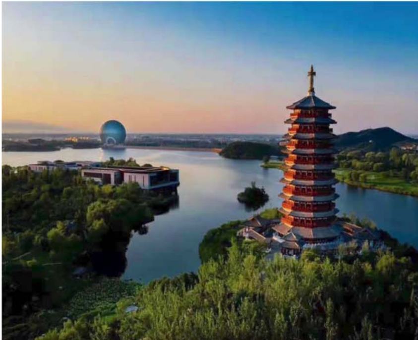
北京日出东方凯宾斯基酒店及雁栖岛