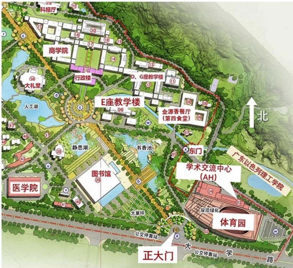
图2 汕头大学学术交流服务中心示意