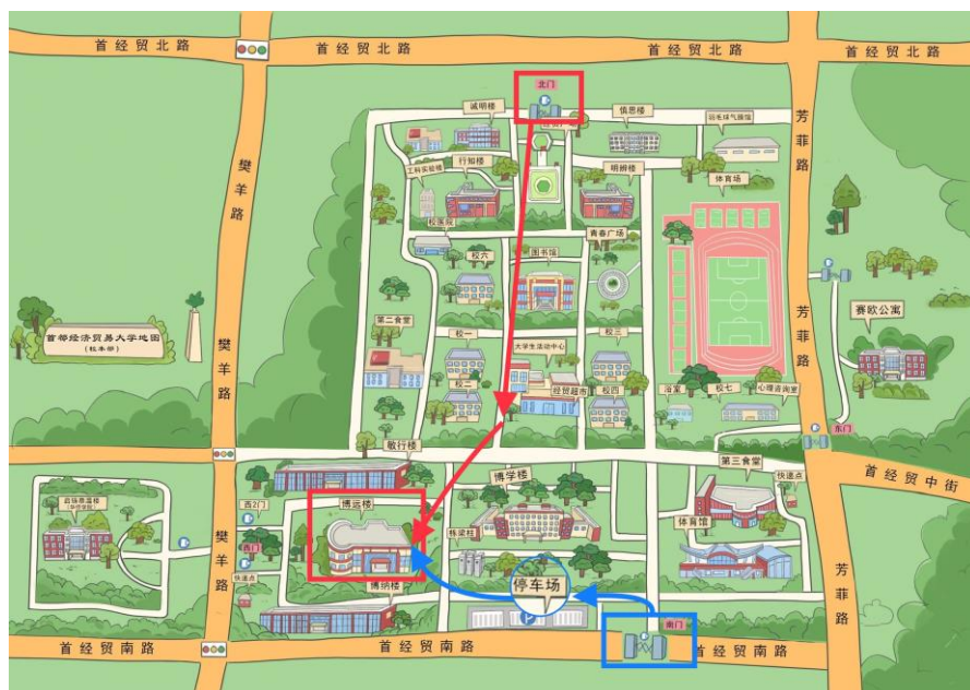
博远楼会场引导图