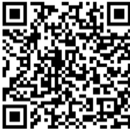
师资培训班（12月11日）线上会议入口二维码