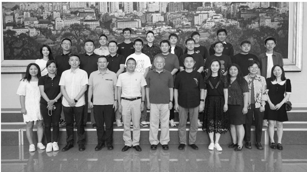
青年学者论坛参会代表合影