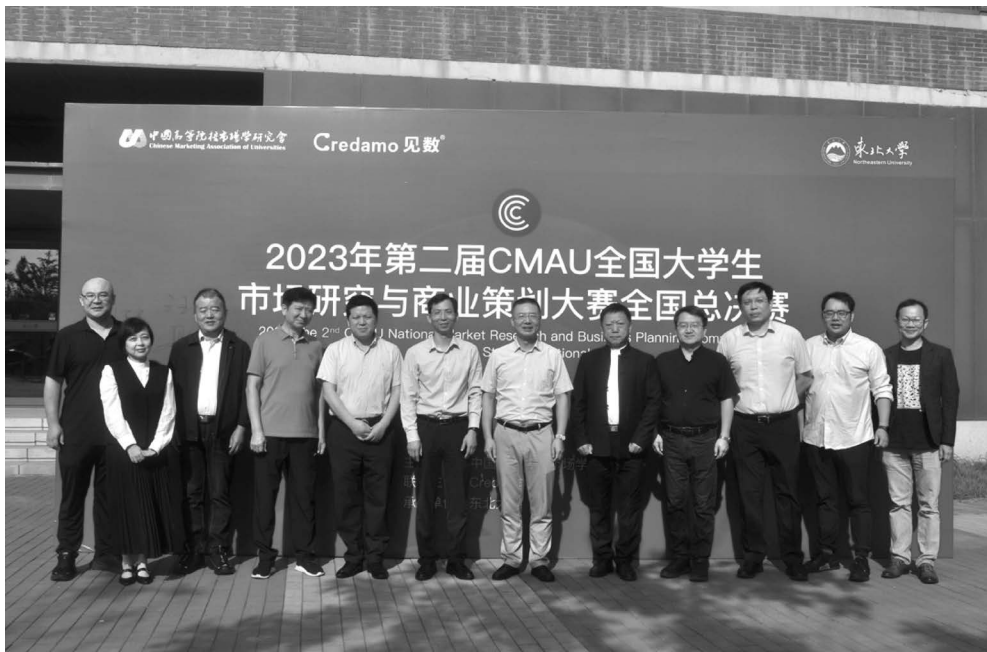
学会领导参加总决赛开幕式

作也在按部就班地完成。在这个过程中，我们团队付出了巨大的努力，得到了大赛联合主办方见数科技的各位老师的大力支持。他们对于各个环节的细心指导保障了比赛顺利进行。