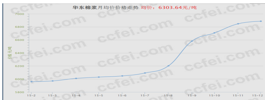
图 6 2015 年棉浆（新疆）价格曲线图