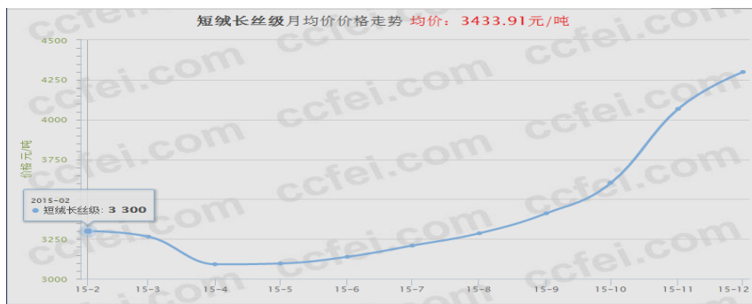
图 1 2015 年短丝级棉短绒价格曲线图