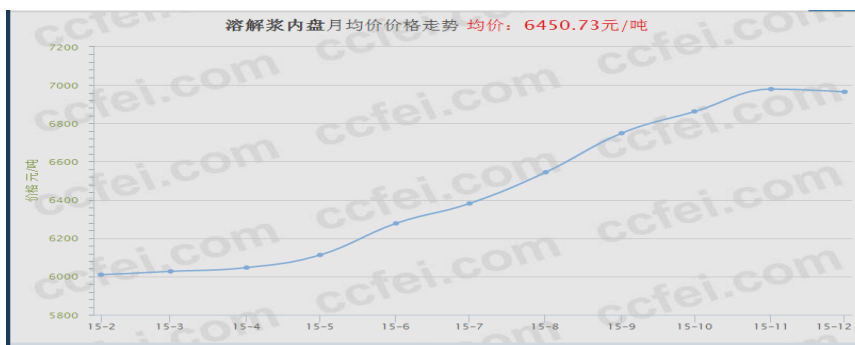
图 4 2015 年溶解木浆（进口针叶）价格曲线图