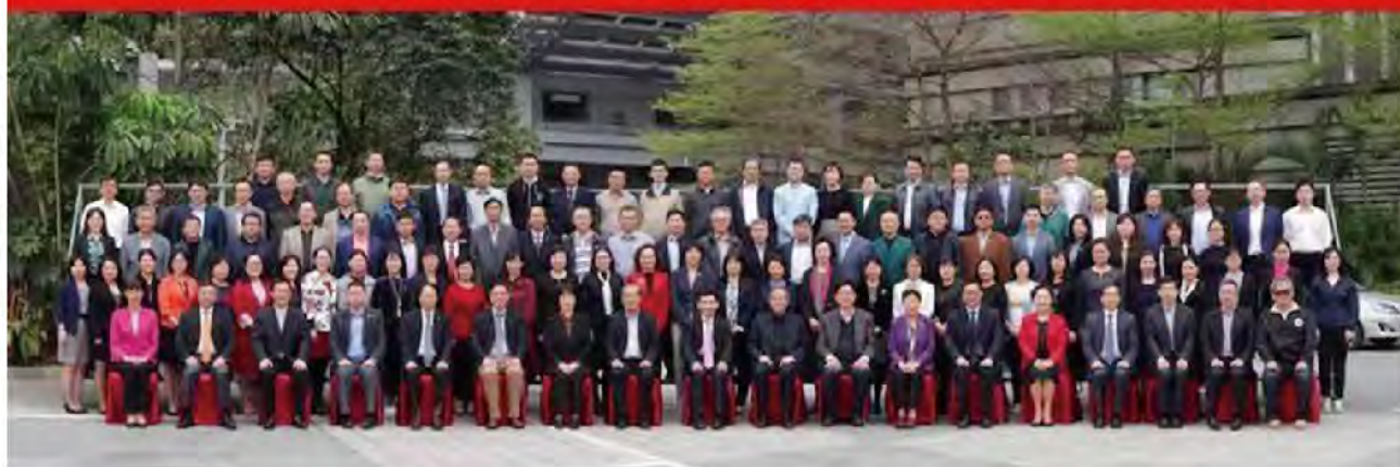
中华口腔医学会第十一次专业委员会（分会）工作会议 广州2019.3

2019年3月2日,第十一次专委会(分会)工作会议在广州召开。会长俞光岩教授,名誉会长王兴教授、张志愿院士等学会领导,以及34个专委会(分会)前、现、候任主委等100余人参加。会议“以会代培”,对国家卫健委的重要文件进行宣贯,对专委会(分会)2018-2019年工作总结部署,针对专委会(分会)在协议签署、经费使用等问题解读研讨。口腔美学专委会、口腔颌面外科专委会、民营口腔医疗分会分别就特色学术活动开展、专科医师培养以及会员发展等工作分享经验。最后,会议向获得2018年工作考评优秀的13个专委会(分会)颁发了证书。