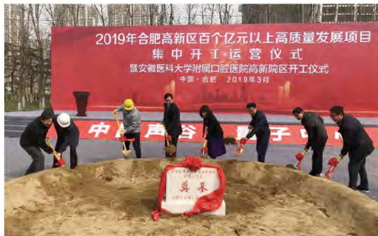
（安徽医科大学附属口腔医院 供稿 责任校对 王靓）

2019年3月30日，2019年安徽省合肥高新区百个亿元以上高质量发展项目集中开工运营仪式在安徽医科大学附属口腔医院高新院区现场举行。安徽省委常委、合肥市委书记宋国权，合肥市委副书记、市长凌云出席仪式并致辞，安徽医科大学党委书记李俊、校长曹云霞出席。安徽医科大学附属口腔医院（安徽省口腔医院）新院区占地面积24.2亩，总建筑面积68654.05平方米，预计2022年投入使用。新院区的建成，对安徽省医疗卫生事业具有积极意义，也将进一步提升安徽省口腔医学教育、科学研究和预防诊疗能力和水平。