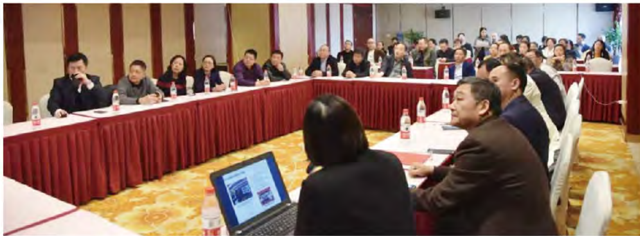
(重庆市口腔医学会 供稿 责任校对 王靓)

2019年3月29日，重庆市口腔医学会2019年第一次常务理事会(扩大)会议在垫江召开，共计24人出席本次会议。会议对2018年学会工作做了总结，戴红卫秘书长为2018年工作考评中获得优秀的专委会颁发了荣誉证书。随后，对2019年重点工作做了安排，提交讨论了2019年学会专委会换届工作及学会工作计划。会议强调，各参会人员要以严明的纪律、扎实的作风，不断加大推进工作制度化建设的力度，要继续深化学会改革，切实加强自身规范建设，将学会建设成为坚强有力、充满活力的社会组织。