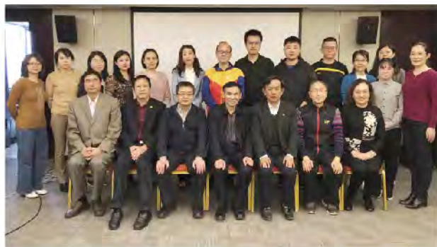
（中华口腔医学会 科学普及部 供稿 责任校对 王晓华）

随后各位专家针对书稿中四个不同阶段（孕育阶段、婴幼儿阶段、学龄前阶段和学龄阶段）的内容进行了深入、细致的沟通和交流。