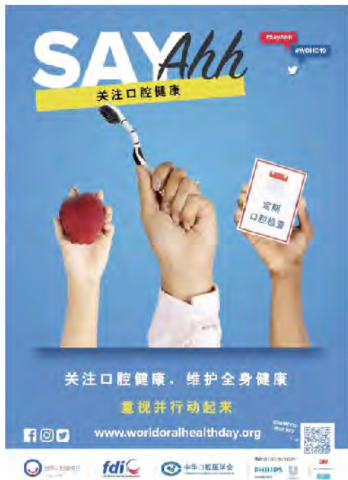
(中华口腔医学会 科学普及部 供稿 责任校对 王晓华)

为响应 FDI 世界牙科联盟的号召，传播口腔健康知识，中华口腔医学会于近日发布《关于开展 FDI 世界牙科联盟发起的“世界口腔健康日”活动》的倡议通知，号召所有会员单位和会员积极开展 2019 年 3·20“世界口腔健康日”科普宣传活动，同时学习贯彻并实施国家卫生健康委于 2019 年 1 月 31 日印发的《健康口腔行动方案（2019-2025 年）》，以此为契机营造关注口腔健康的社会氛围。