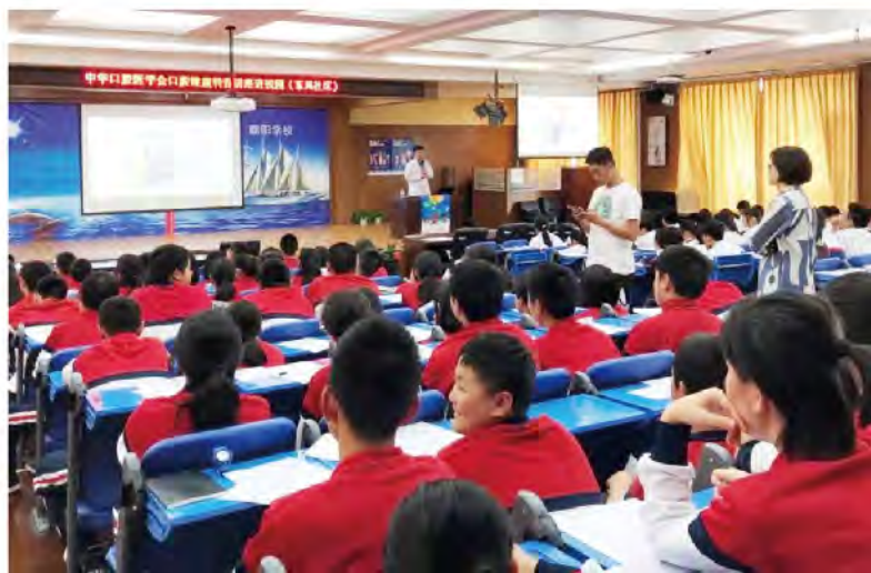
(中华口腔医学会 科学普及部 供稿 责任校对 王晓华)

2019年4月23日，中华口腔医学会“卫生经济学研究项目”北京地区启动活动在北京市华中师范大学第一附属中学朝阳学校顺利开展。活动由中华口腔医学会科普部司燕部长带领11位项目组成员指导学生们完成口腔健康调查问卷的填写，并向学生们详细讲解了青少年的口腔健康状况及口腔疾病的综合防治策略。宣教课后，医务人员分为四组对在场约100名初中生进行免费口腔检查，详细记录每人的口腔健康状况并及时反馈。同时参与检查的学生们均获得一份口腔健康科普资料，以鼓励他们时刻关注口腔健康。本次活动共收集问卷约150份，完成约100名同学的口腔健康检查。