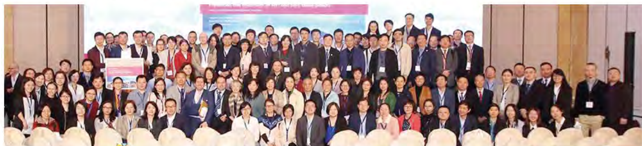
(中华口腔医学会 牙周病学专业委员会 供稿 责任校对 张媛)

2019年3月1-2日，由欧洲牙周病学联盟（EFP）组织的牙周病学临床大师交流会，在香港隆重召开。此次会议的主题为“植周炎—预防及治疗软硬组织缺陷”，由来自全球的顶级牙周病学大师从植周炎病因、流行状况、危险因素、诊断、硬组织、软组织缺陷处理、预防等方面进行了专题讲演和讨论。中华口腔医学会牙周病学专业委员会主委王勤涛，前任主委束蓉，副主委潘亚萍、欧阳翔英、陈莉丽、徐艳等169人参会，占参会总人数的三分之一。专家们通过深入交流产生共识，对植周炎必须引起高度重视，虽然目前有各种对此的治疗技术，但真正的疗效保证还在于预防！