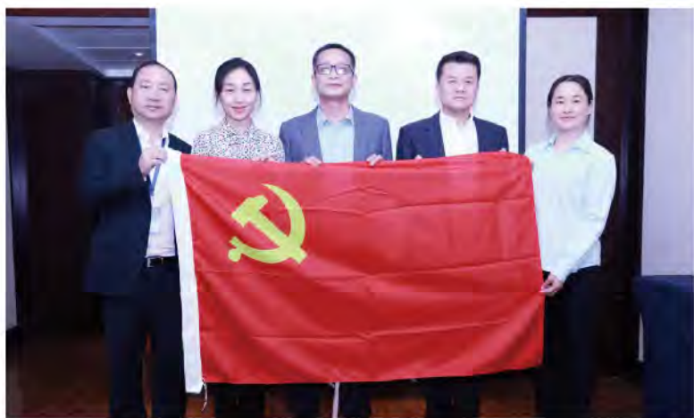
(中华口腔医学会 全科口腔医学专业委员会 供稿 责任校对 葛凤庆)

2019年4月20日，中华口腔医学会全科口腔医学专委会在安徽合肥第四届常委会第一次会议期间召开了专委会党的工作小组第一次会议，参会人员包括工作小组组长王霄主委，组员陈莉莉候任主委，徐宝华副主委，潘宣副主委及党建联系人马宁学术秘书。小组成员深刻学习了工作小组的工作职责及活动规范，制定了2019年工作小组的工作计划，今后将在专委会群里发布及学习党政知识，开展爱国主义教育和支援帮扶活动，进行义诊等相关公益，切实将党的工作和业务工作相结合。