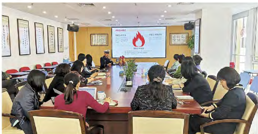
(中华口腔医学会 办公室 供稿 责任校对 刘辉)

为进一步提高消防安全意识，2019年4月17日下午，中华口腔医学会邀请双榆树中队齐教官对学会工作人员进行消防安全知识培训。教官为大家讲解了办公室及家庭消防安全常识，发生事故时如何处置等安全知识。通过此次培训，大家对消防安全的重要性有了更深层次的理解，进一步增强了学会工作人员的消防安全知识和消防安全防范技能，提高了火灾防范和火场逃生的自我保护能力。