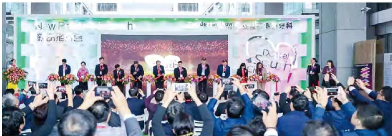
(中华口腔医学会 学术部 供稿 责任校对 刘辉)

2019年3月3-6日，2019华南国际口腔展在广州隆重举行。2019年展会汇聚了世界高端的牙科品牌和知名的中国牙科制造企业，规模达57200 m 2 。本届展会邀请了200多位行业专家无私分享全新的医学研究成果、实用的临床治疗技术、先进的设备应用经验，以及高效的诊所管理方法，展会取得了圆满成功。