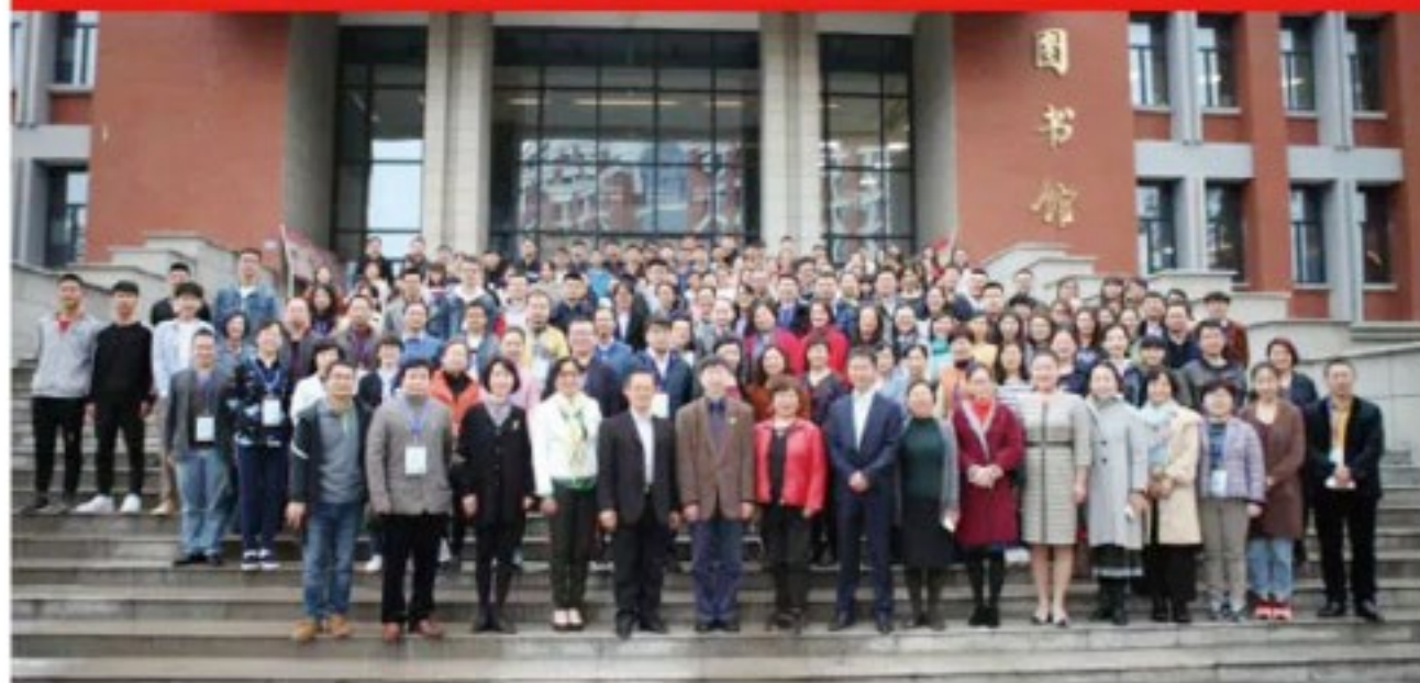
口腔住院医师规范化培训师资培训班(厦门站)2018.3

听了具有丰富住培教学经验的专家的悉心指导,并参加了以病例为基础的住培教案展评和教学经验交流。会议特别为住院医师设置了名师讲堂、口腔全科病案展评及技能比赛。广大学员称此次培训班是一次高强度高质量的培训,受益匪浅。大家都认识到住培之路任重道远,愿为提高住院医师规范化培训师资水平,加强住培基地建设作出努力。