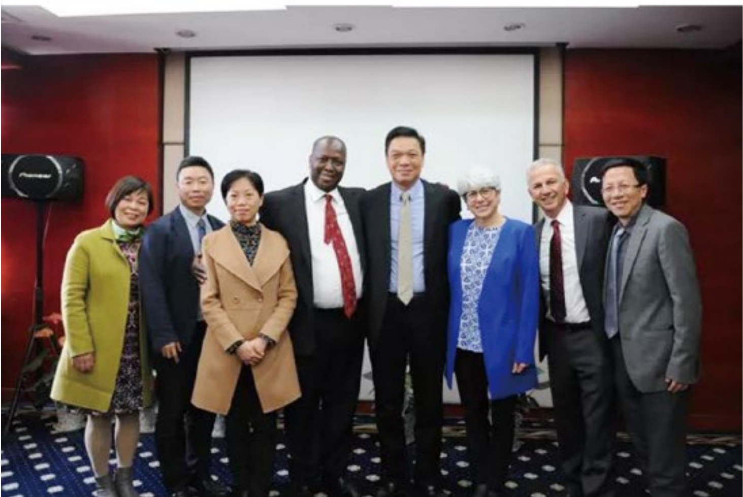
(广西医科大学口腔医学院附属口腔医院 供稿 责任校对 卢燕)

访问期间，代表团与院领导进行了座谈。经过双方友好协商，双方就培训项目规划和学历互认等问题达成了初步共识，对下一步双方在人才培养、师资交流培训、科研合作等多领域的全面合作奠定了坚实基础。