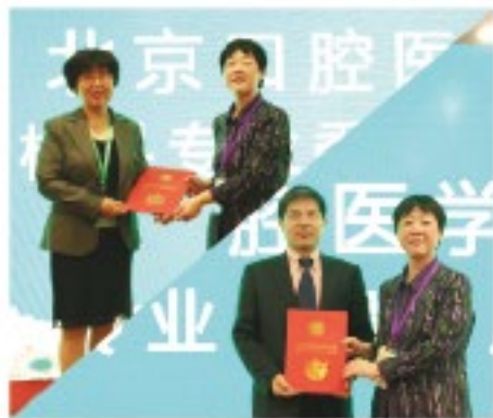
(北京口腔医学会 供稿 责任校对 王帆)