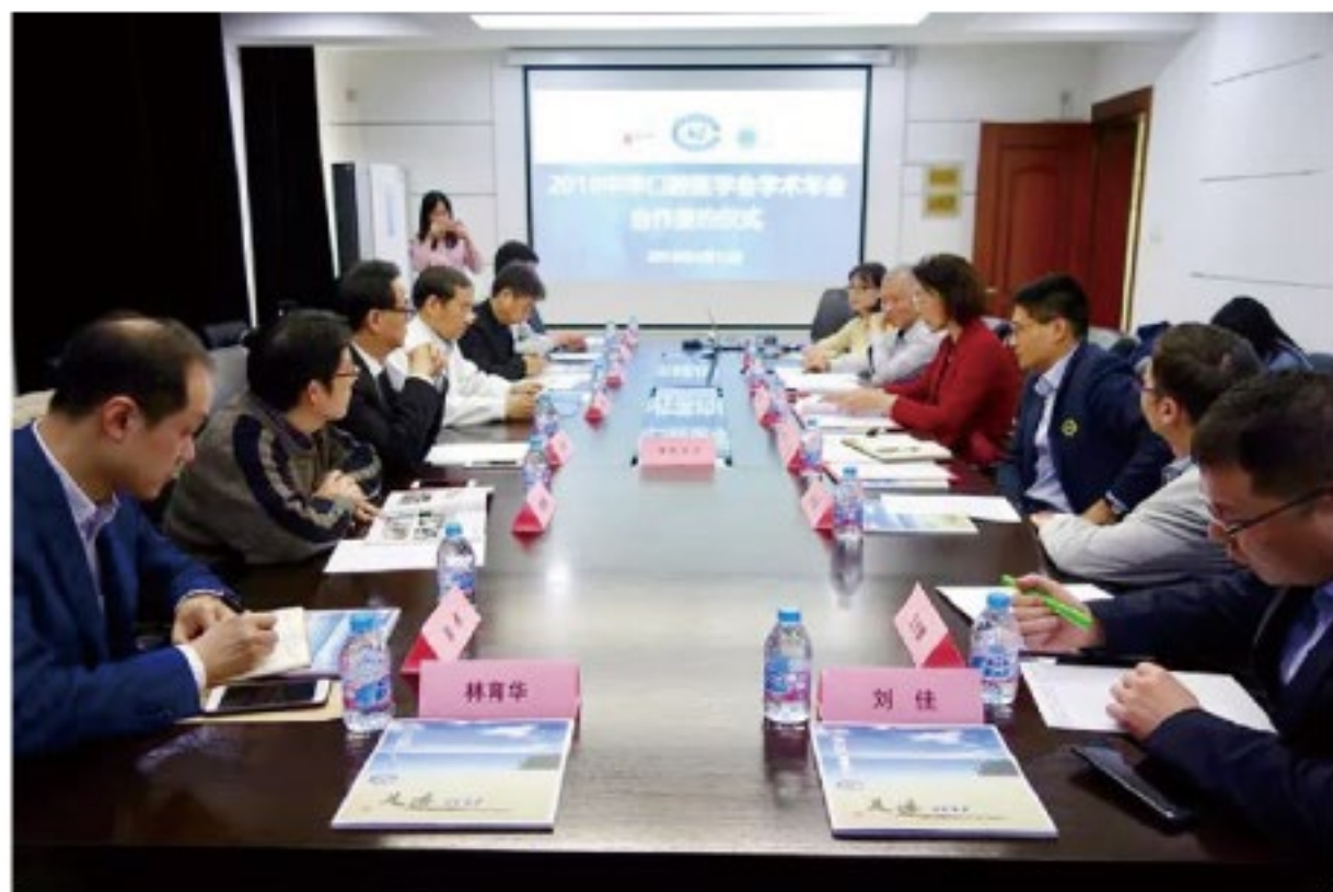
(中华口腔医学会 学术部 供稿 责任校对 章佳)

2018年4月12日，中华口腔医学会2018年学术年会组委筹备会在上海交通大学医学院附属第九人民医院召开，中华口腔医学会沈国芳副会长、岳林秘书长、陈铭常务副秘书长、许天民副秘书长，上海市口腔医学会张富强理事长、王佐林院长、刘泓虎副理事长、邹德荣副理事长、陈栋副院长、黄正蔚秘书长、朱亚琴教授、刘佳院长，国药励展李超副总经理出席会议，就年会学术活动设计，场馆安排，会务接待等工作进行商讨和周密部署。会上，中华口腔医学会、上海市口腔医学会、国药励展共同签署合作协议书，并就共同承接2020年FDI世界牙科联盟年会在上海举办进行展望，精诚合作，再创辉煌！