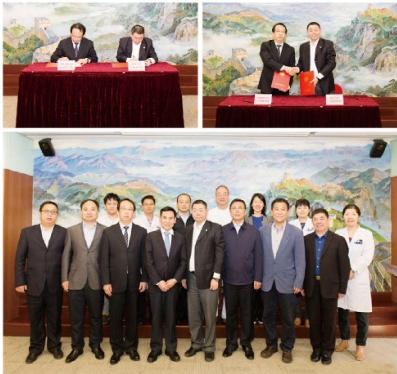
(北京大学口腔医院 供稿)

此次签约仪式的成功举行，拉开了北京大学口腔医学院与内蒙古医科大学口腔医学院进一步合作的新篇章，将北大口腔医院的公益责任进一步发扬。