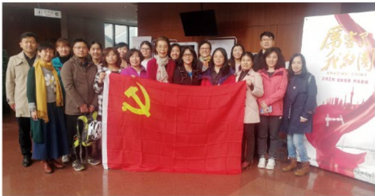
(中华口腔医学会 秘书处党支部 蒋依兰 供稿 责任校对 张欣)

通过观看纪录片，大家深刻感受到伟大祖国在党的十八大以来所取得的历史性成就，人们在各行各业艰苦奋斗，创造出一个个中国奇迹，更加坚定了对祖国的认同感、归属感和自豪感。大家纷纷表示作为一名共产党党员，要立足岗位、开拓进取，为学会的发展和全国人民口腔健康水平的提升贡献出自己的力量。