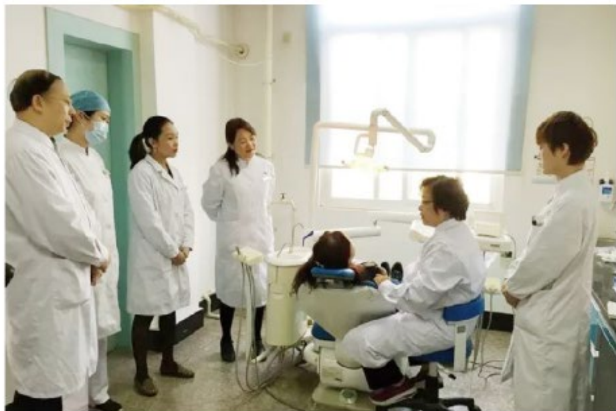
(中华口腔医学会 公益活动办公室 葛凤庆 供稿 责任校对 章佳)

2018年，中华口腔医学会“西部行”公益活动在各大口腔医学院校支持下，将派出89名志愿者医生赴西部十一个省份基层口腔医疗机构开展帮扶活动，为促进西部口腔医学发展做出贡献。