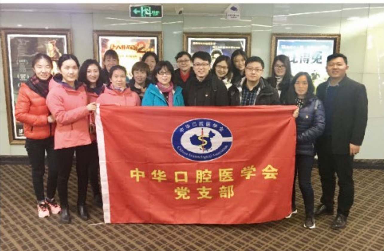
(中华口腔医学会 秘书处党支部 葛凤庆 供稿 责任校对 张欣)

本次观影活动是学会党支部开展“两学一做”学习教育活动内容之一，通过观影活动，激发了学会党员的爱国主义热情和国家“强起来”的高度认同感和自豪感。大家纷纷表示，要坚定理想信念，用实际行动践行党的宗旨，在本职工作中发挥党员先锋模范作用，不忘初心，砥砺前行，为学会建设和发展做出应有的贡献。