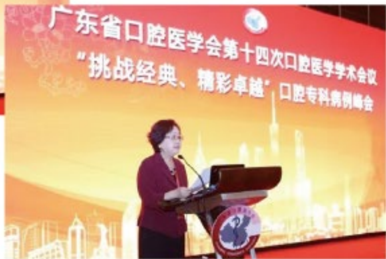
(广东省口腔医学会 供稿 责任校对 王帆)