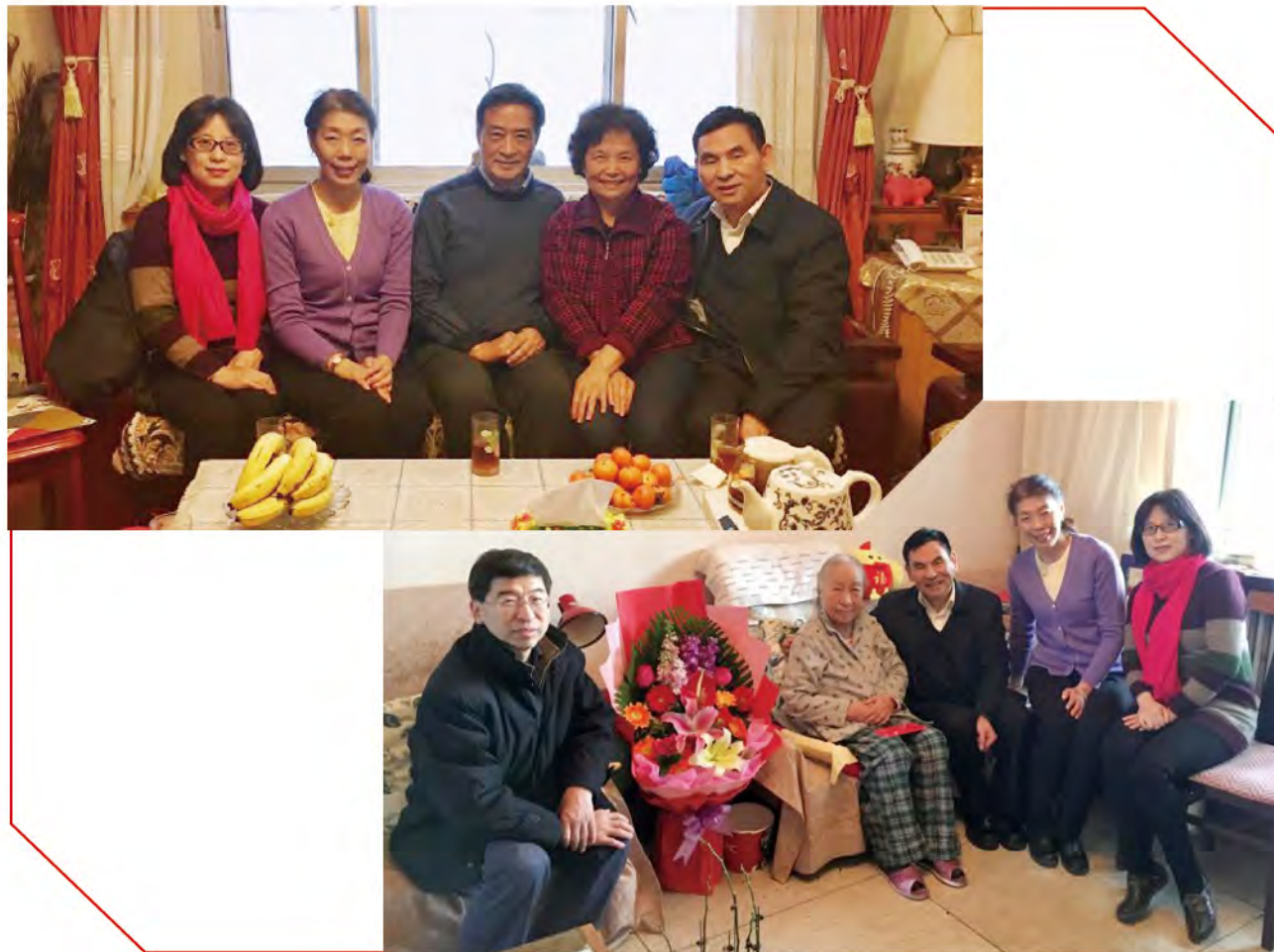
(中华口腔医学会 办公室 供稿 责任校对 王靓)

凤衔竹叶去，犬携梅香来，值此新年之际，衷心祝愿我国所有口腔科技工作者身体健康、工作顺利、阖家幸福！