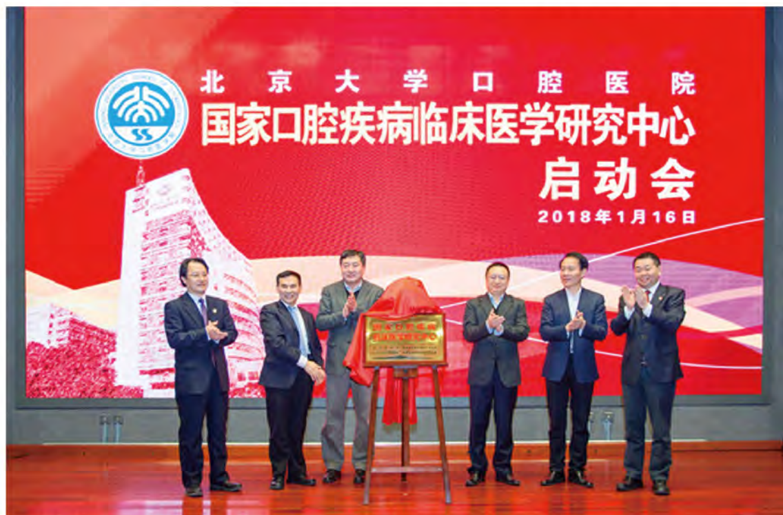
(北京大学口腔医院 供稿 责任校对 卢燕)

2018年1月16日，国家口腔疾病临床医学研究中心北京大学口腔医院中心启动会在北京大学口腔医院举行。科技部社发司田保国副司长、国家卫计委科教司吴沛新副司长、北京大学詹启敏副校长、中华口腔医学会俞光岩会长和北京大学口腔医院郭传瑛院长一起为国家口腔疾病临床医学研究中心北京大学口腔医院中心揭牌，中心主任郭传瑛对37家分中心单位分别授牌。