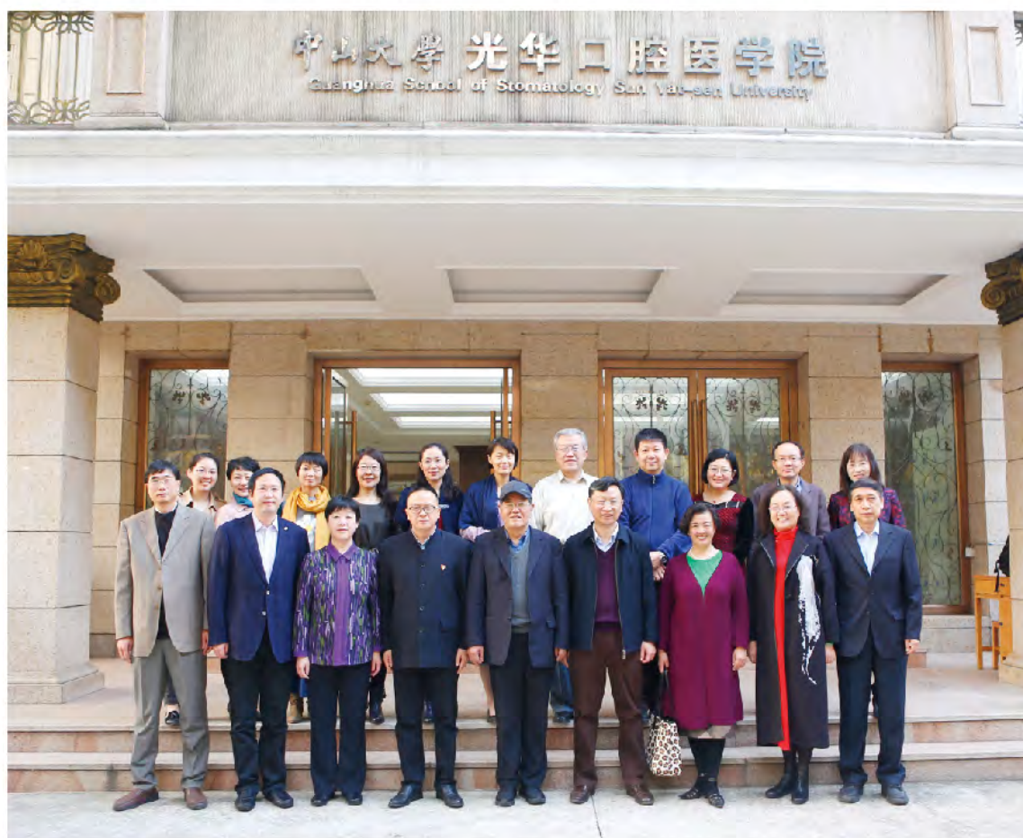
（中华口腔医学会 四次流调办公室 司燕 供稿 责任校对 杨桂珍）

19日，会议继续讨论了总结表彰会的各项筹备工作和预算，以及流调画册的内容框架。同期对南方医科大学口腔医院（广东省口腔医院）进行了财务督导，执行情况良好。