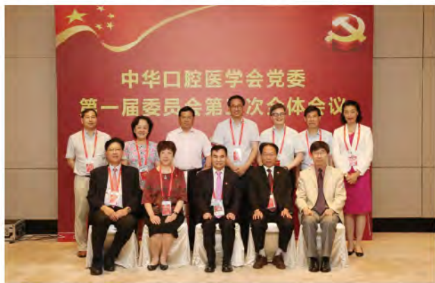
(中华口腔医学会 秘书处党支部 葛凤庆 供稿 责任校对 牛春华)

会议审议通过“中华口腔医学会党委2018年度工作报告”和“中华口腔医学会《章程》修改建议”，下一步将提交中华口腔医学会第五届理事会第三次理事会议审议。会议还就中国科协开展创建星级学会党组织试点工作进行了对照自查。俞光岩书记强调，学会党委要加强自身党风廉政建设，在中国科协科技社团党委的领导下，党建引领，争创全国学会优秀党组织。