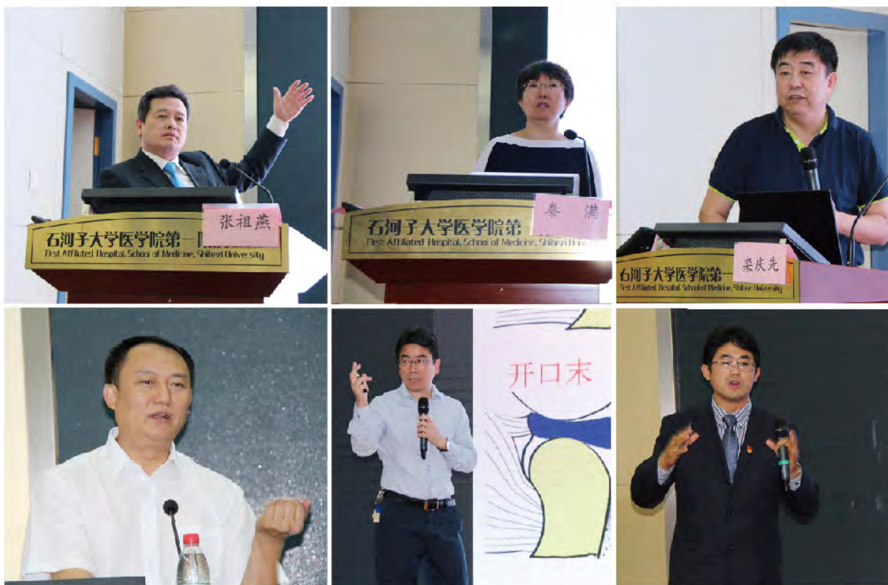
(北京大学口腔医院 供稿 责任校对 卢燕)

在兵团卫计委领导、八师石河子市领导、石河子大学及医学院领导的共同见证下，两院先后签署了远程医疗合作协议、教学帮扶协议，并为国家口腔临床医学研究中心分中心揭牌。今后，两院将进一步深化在医疗、教学、科研、人才培养、学科建设等多方面的合作，开展更为深入的对口帮扶工作。