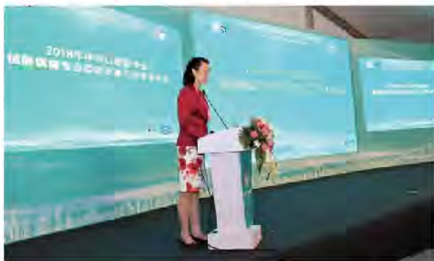
(中华口腔医学会 学术部 供稿 责任校对 牛春华)

分会场。本次学术交流吸引了来自全国各地三百多名代表的参加和研讨，会议取得了圆满成功。