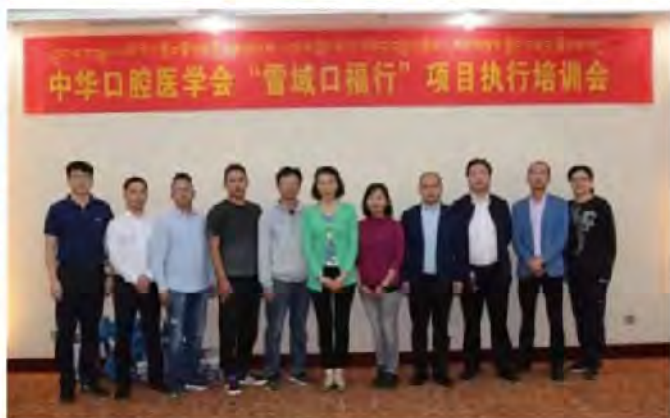
(中华口腔医学会 公益活动办公室 章俊 供稿 责任校对 葛凤庆)