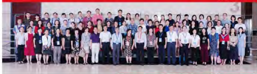
中华口腔医学会第四届中西医结合专委会合影