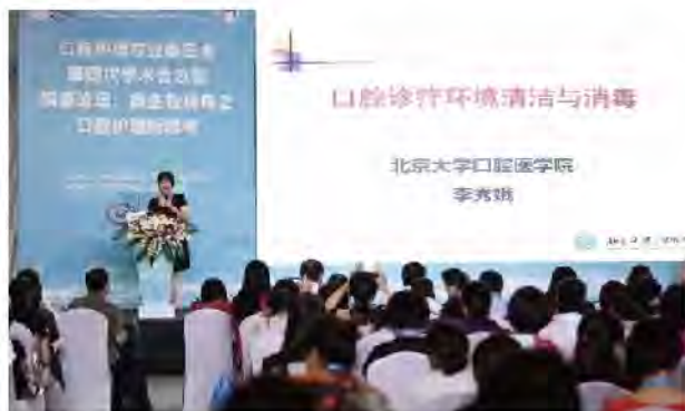
(中华口腔医学会 学术部 供稿 责任校对 牛春华)

议得到了与会同仁的高度赞扬与认可，是口腔护理人一年一度的学术大餐，对进一步提升我国口腔护理人员的素质和学术水平、提高专科护理质量起到了重要作用。