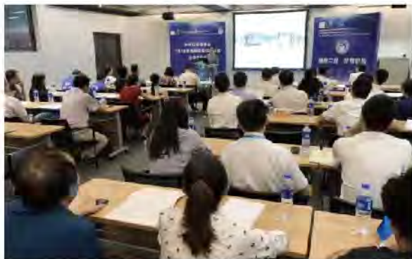
(中华口腔医学会 科技研究部 供稿 责任校对 朱若曦)

2018年8月31日，中华口腔医学会2018年西部临床科研基金立项答辩评审会在上海召开。中华口腔医学会西部行临床科研基金2012年设立，学会每年出资五十余万元支持西部地区口腔医生开展具有实用推广价值的临床新技术、新疗法的应用研究，培育当地口腔医学骨干及其科研能力。2018年共收到西部地区11个省（自治区）申报的20项科研项目。经专家组评审，最终10个项目获得立项。