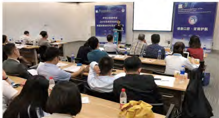
(中华口腔医学会 科技研究部 供稿 责任校对 朱若曦)

2018年8月30日，中华口腔医学会2018年青年科研基金树脂材料研究专项立项答辩会在上海召开。该项目通过为35岁以下年轻口腔医学科技工作者提供研究平台，以推动和促进树脂材料的研究和应用。2018年共收到来自口腔医学博士点院校申报项目15项，包括牙体牙髓病学方向10项，口腔修复学方向5项，经申报人现场答辩，专家组评审立项10项，项目周期2年。卡瓦集团Kerr事业部对项目给予有力支持。