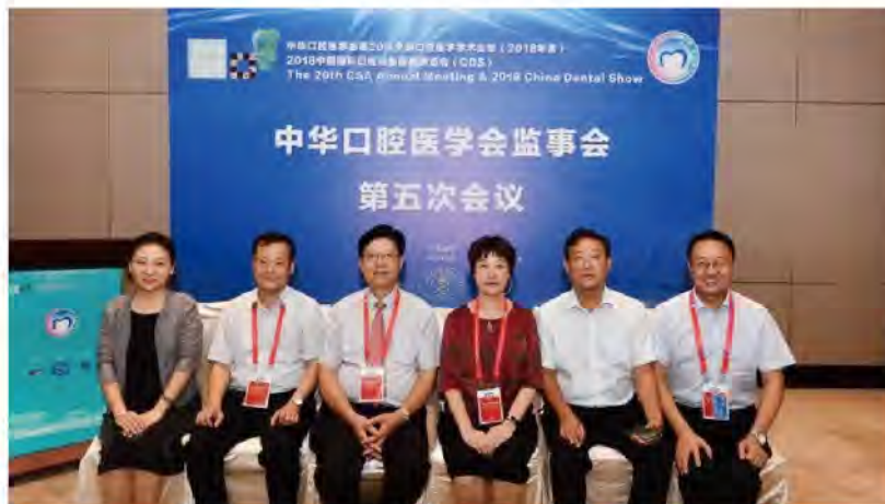
(中华口腔医学会 供稿 责任校对 于硕)

中华口腔医学会监事会第五次会议于2018年8月28日下午在上海召开，孙正监事长主持会议并做《监事会2018年度工作报告》，同时强调监事在履职过程中一定要尽职尽责，加强监督监管，保证出席率。会议还对第五届理事会第三次理事会议程序的合规性进行了讨论，最终形成了监事报告。本次会议圆满结束。