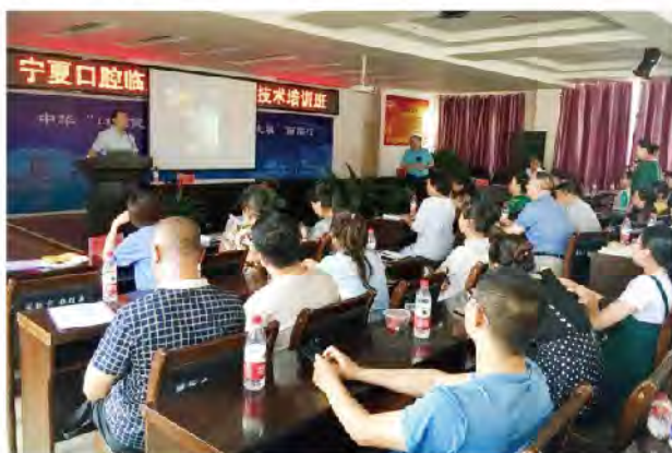
(中华口腔医学会 继续教育部 章佺 供稿 责任校对 葛凤庆)