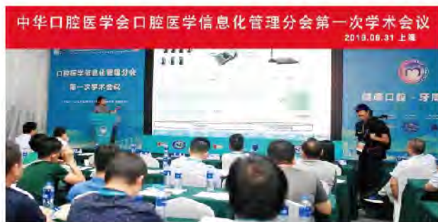
(中华口腔医学会 学术部 供稿 责任校对 牛春华)

评项目、互联网医疗项目的建设经验进行了分享；另有来自三家高新信息科技公司的产品经理，带来最前沿的智慧医院解决方案。本次会议内容精彩纷呈，吸引了来自全国40余家口腔医院及医疗机构从业人员的踊跃参加。