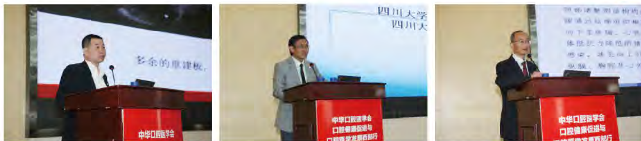
(中华口腔医学会 公益活动办公室 刘辉 供稿 责任校对 葛凤庆)