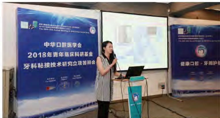
(中华口腔医学会 科技研究部 供稿 责任校对 朱若曦)

2018年8月30日，中华口腔医学会2018年青年临床科研基金牙科粘接技术研究专项立项答辩会在上海召开。该项目通过为35岁以下年轻口腔医学科技工作者提供项目支持，以推动和促进现代粘接技术的研究和发展。2018年共收到来自口腔医学博士点院校申报项目14项，包括牙体牙髓病学方向6项，口腔修复学方向8项，经申报人现场答辩，专家组评审立项10项，项目周期2年。3M中国有限公司对项目给予有力支持。