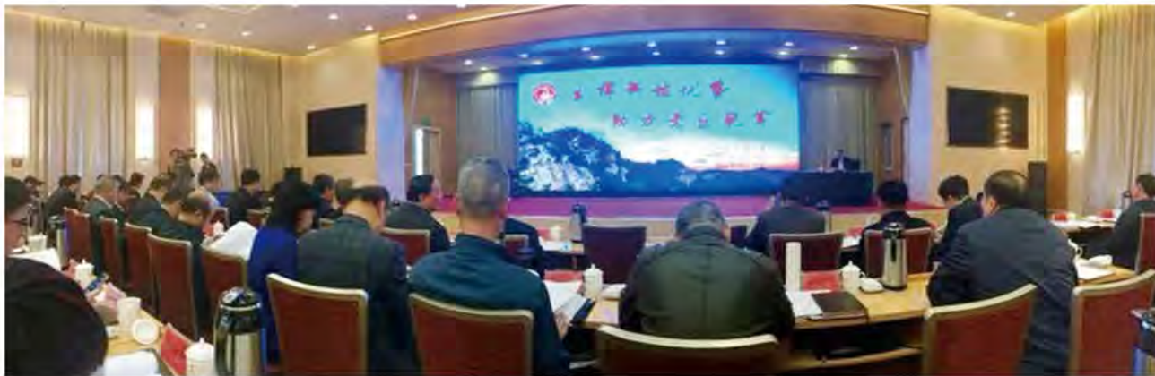
(中华口腔医学会 秘书处党支部 章隼 供稿 责任校对 牛春华)

2018年10月16日，2018年全国科技助力精准扶贫现场会在山西省吕梁市成功召开，会议正值我国第5个扶贫日和第26个世界消除贫困日中国科协党组书记、常务副主席、书记处第一书记怀进鹏同志出席会议并做重要讲话，带领大家深入学习中共中央相关文件，并强调万众一心，聚焦深贫地区，提高脱贫质量，坚决打好精准扶贫攻坚战的重要性。