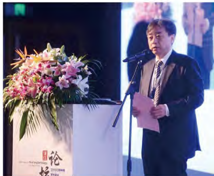
(中华口腔医学会 口腔种植专业委员会 供稿 责任校对 张媛)

来自全国各地750余名口腔种植同仁参加本次学术论坛。会议邀请了十五位国内外口腔种植领域知名专家，就口腔种植骨增量方法及数字化技术两大热点问题进行了主题演讲及讨论。会议讲座精彩纷呈，演讲嘉宾结合临床经验、文献回顾和实验研究，采用视频、图片、动画等动静结合的方式，与大家分享口腔种植的前沿理念和先进技术。论坛会场座无虚席，参会人员表示，通过此次学习交流，对口腔种植有了更深刻的认识及更广泛的了解，对今后开展口腔种植治疗与研究大有裨益。