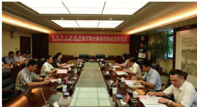
(福建医科大学附属口腔医院 杜振强 供稿 责任校对 王靓)

据了解，签约单位间通过技术帮扶、分级诊疗、人才培养、资源共享等措施，着力提高基层医疗机构的服务能力，优化资源配置，共同为群众提供安全、有效、方便的医疗卫生服务。本次签约，将为构建区域专科疾病防治网络，普及和推广先进成熟的诊疗技术和诊疗规范，促进诊疗技术规范化、服务同质化，提升区域专科疾病防治水平起到极大的推动作用。