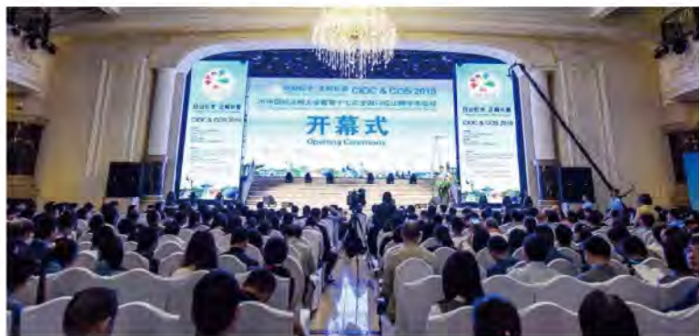
（中华口腔医学会 口腔正畸专业委员会 供稿 责任校对 张媛）

全国口腔正畸学术会议已成功举办过16次，在展示我国口腔正畸学在新技术应用、新材料研发以及与多学科交叉等方面取得的突出成果，见证了我国口腔正畸学的学术创新与学科发展。