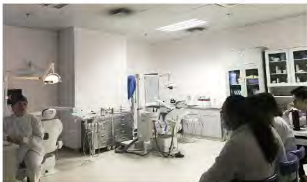
（井冈山大学临床医学院口腔系 供稿 责任校对 卓静）

井冈山大学临床医学院口腔系的给予了无私帮助，双方院系今后在教学质量提高和师资培养上还将建立更长远和深入的合作。