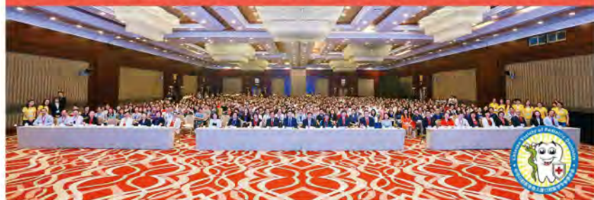
2018年中华口腔医学会第九次全国儿童口腔医学学术会议

2018年9月13日上午，由中华口腔医学会儿童口腔医学专业委员会和中国国际科技交流中心共同主办，北京大学口腔医院承办的“中华口腔医学会第九次儿童口腔医学学术会议”在北京国际会议中心隆重开幕。