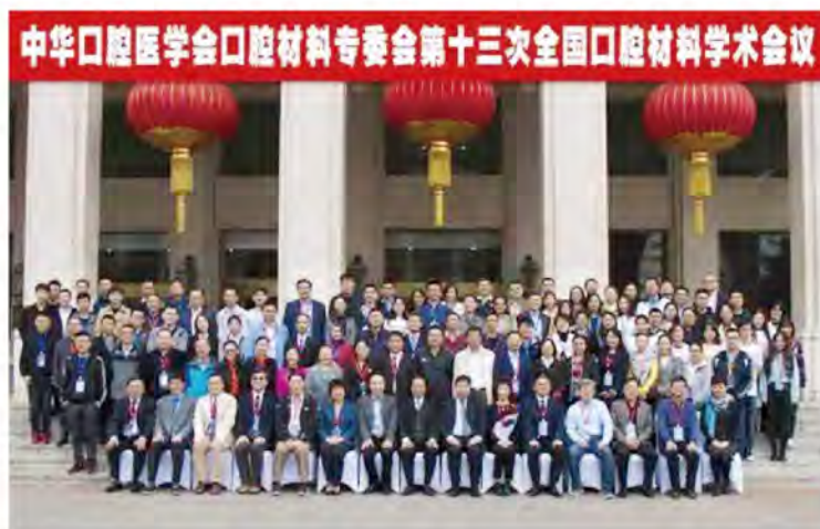
(中华口腔医学会口腔材料专业委员会 供稿 责任校对 张媛)

2018年10月8-10日，中华口腔医学会口腔材料专委会第十三次全国口腔材料学术会议在沈阳召开。本次会议由中华口腔医学会口腔材料专委会主办、中国医科大学附属口腔医院承办。中华口腔医学会副会长路振富教授、中国医科大学附属口腔医院院长孙宏晨教授、口腔材料专委会主委李志安教授出席会议开幕式并致辞。本次会议的主题为口腔陶瓷材料的研究前沿、进展与临床应用，会议讲演内容紧密围绕口腔陶瓷材料的新技术、新视野与新材料展开，参会人数达140余人。材料专委会专家还与企业的研发人员进行面对面的交流，探讨双方合作的相关课题。