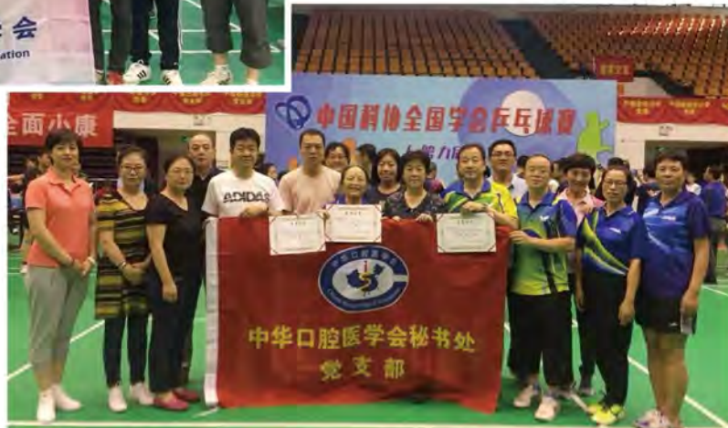
(中华口腔医学会 秘书处党支部 王靓 供稿 责任校对 牛春华)