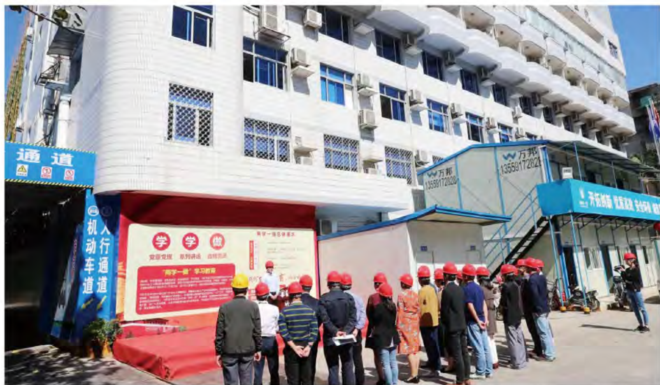
(福建医科大学附属口腔医院 杜振强 供稿 责任校对 卓静)

据了解，福建医科大学附属口腔医院新门诊大楼自2017年8月开工以来，历经了工程桩、围护桩，土方开挖、地下室施工、上部主体结构施工，顺利封顶等程序，经历了数次台风的考验，克服了重重困难，在各级领导的关心和施工单位的共同努力下，工程保质保量进行，通过了福州市优质工程“榕城杯”和福建省文明安全示范工地的初评。