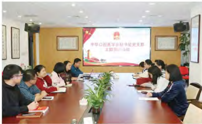
(中华口腔医学会 秘书处党支部 蒋依兰 供稿 责任校对 葛凤庆)

2018年10月17日，中华口腔医学会秘书处党支部召开“两学一做”主题党日活动，牛春华书记主持活动。支部制作了“全国教育大会解读”幻灯片，组织党员和积极分子们对大会内容进行了学习。通过学习，大家表示要认真学习领会和贯彻习近平总书记重要讲话精神，以习近平新时代中国特色社会主义思想为指导，落实到实际工作中去。会后，大家就学会秘书处对党建及团青建设活动进行了讨论，下一步将要加强党建引领，做好团青建设工作，打造更加充满活力的党组织。