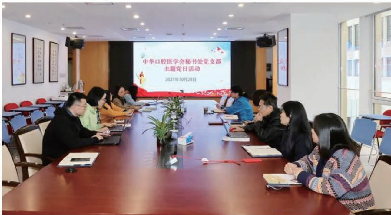
(中华口腔医学会 秘书处党支部 王晓华 供稿 责任校对 葛凤庆)

2021年10月28日，中华口腔医学会秘书处党支部召开专题会议，传达学习中央人才工作会议精神。秘书处全体党员和积极分子共13人参会。习近平总书记的重要讲话从党和国家事业发展全局的角度，全面回顾了党的十八大以来人才工作取得的历史性成就、发生的历史性变革，深入分析了人才工作面临的新形势新任务新挑战，科学回答了新时代人才工作的一系列重大理论和实践问题，具有很强的政治性、思想性、理论性，是指导新时代人才工作的纲领性文献。通过学习，全体党员纷纷表示要进一步提高站位，加强业务学习、优化工作流程，更大程度发挥自身优势，着眼学会事业长远发展，在本职岗位上做出贡献。