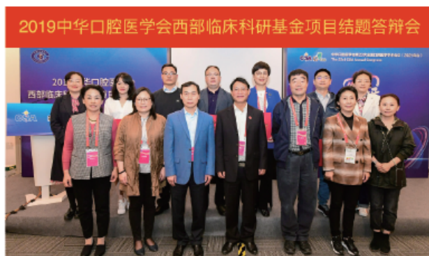
(中华口腔医学会 科技研究部 供稿 责任校对 朱若曦)

2021年10月20日，2019中华口腔医学会西部临床科研基金项目结题答辩会在上海国家会展中心与中华口腔医学会第23次全国口腔医学学术会议同期召开。该项目面向西部12个省、自治区、直辖市公开招募项目，旨在推广临床新技术新疗法的应用研究及地区特色性口腔疾病防治研究。2019年立项的8个项目进行现场结题答辩，评审专家就项目研究结果，发表成果等进行点评，经专家评审打分，8个项目均完成结题，其中西南医科大学附属口腔医院郭玲，呼和浩特市口腔医院张蕾，新疆医科大学附属口腔医院凌彬负责的项目获得优秀结题项目。