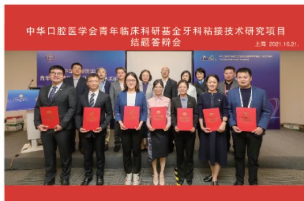
(中华口腔医学会 科技研究部 供稿 责任校对 朱若曦)

2021年10月21日，中华口腔医学会青年临床科研基金牙科粘接技术研究项目进展报告会在上海国家会展中心与中华口腔医学会第23次全国口腔医学学术会议同期召开。该项目于2018年立项10项，项目周期2年，受疫情影响延期至2021年结题。牙体牙髓病学方向4位项目负责人和口腔修复学方向6位项目负责人进行现场报告，点评专家就项目研究结果，后续研究方向，文章发表等方面给予指导，经专家评审，项目均顺利结题。