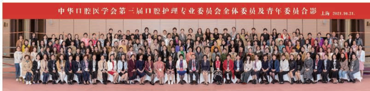
中华口腔医学会第三届口腔护理专业委员会全体委员及青年委员合影 上海 2021.10.21.