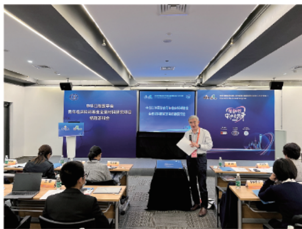
(中华口腔医学会 科技研究部 供稿 责任校对 朱若曦)

2021年10月19日，中华口腔医学会青年临床科研基金全瓷材料研究项目结题评审会在上海国家会展中心与中华口腔医学会第23次全国口腔医学学术会议同期召开。该项目于2019年立项10项，项目周期2年，旨在规范口腔全瓷材料的临床应用，推动和促进全瓷材料技术发展。牙体牙髓病学方向4位项目负责人和口腔修复学方向6位项目负责人进行现场报告，点评专家就项目研究结果，后续研究方向，成果发表等方面给予指导，经专家评审，项目均顺利结题。