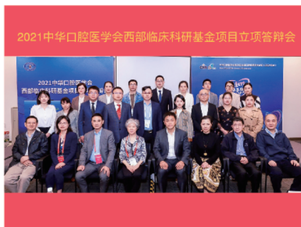
(中华口腔医学会 科技研究部 供稿 责任校对 朱若曦)

2021年10月19日，2021中华口腔医学会西部临床科研基金项目立项答辩会在上海国家会展中心与中华口腔医学会第23次全国口腔医学学术会议同期召开。该项目面向西部12个省、自治区、直辖市公开招募项目，旨在推广临床新技术新疗法的应用研究及地区特色性口腔疾病防治研究。来自西部11个地区的20位项目申请人进行现场汇报，评审专家就项目研究方案，技术路线，预期成果等方面提问指导，经专家以公平、公正、公开为原则独立评审打分，11个项目获得立项。