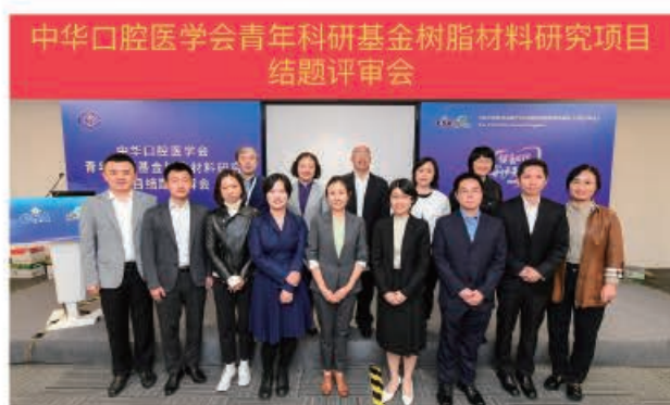
(中华口腔医学会 科技研究部 供稿 责任校对 朱若曦)

2021年10月21日，中华口腔医学会青年科研基金树脂材料研究项目进展报告会在上海国家会展中心与中华口腔医学会第23次全国口腔医学学术会议同期召开。该项目于2019年立项10项，项目周期2年。牙体牙髓病学方向5位项目负责人和口腔修复学方向5位项目负责人进行现场报告，点评专家就项目研究结果，后续研究方向，文章发表等方面给予指导，经专家评审，9项顺利结题。