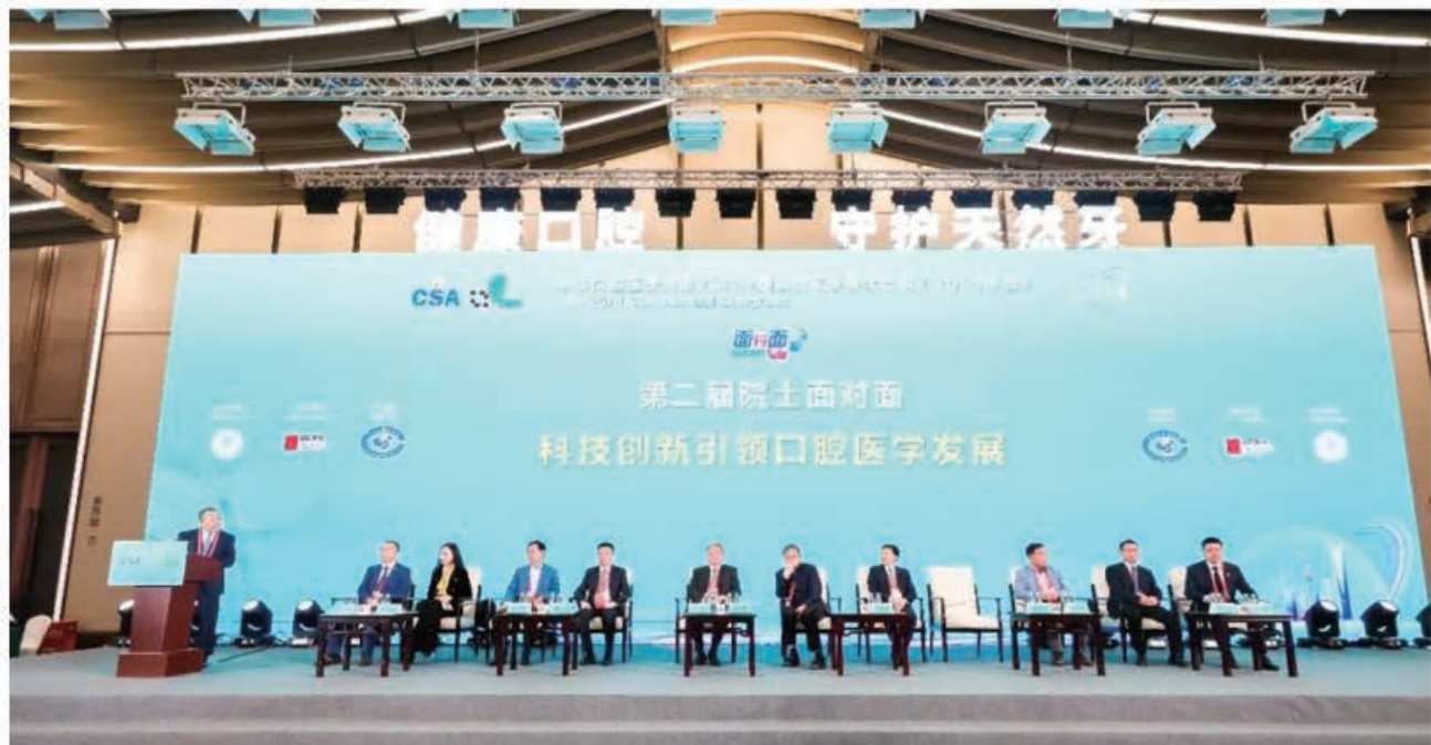
（中华口腔医学会 学术部、继续教育部 供稿 责任校对 刘辉）

2021 年 10 月 19-21 日，中华口腔医学会第 23 次全国口腔医学学术会议（2021 年会）在上海国家会展中心成功举办，为广大口腔同行带来一系列内容丰富而精彩的口腔盛会。学术年会召开了第二届院士面对面、干人口腔种植模型操作、第二次显微根管治疗操作演示会——中青年专场等重磅学术活动；【一堂好课】板块，牙槽外科的责任——规范安全地守护天然牙的最后防线、口腔疾病“软硬兼治”临床病例研讨会、多学科视角看松动牙拔与留的抉择与处理、“承魁星志”口腔正畸专题研讨会——前突畸形的诊治、中国唇腭裂病因学研究研讨会先后开讲；【面对面】板块，年轻恒牙的临床问题及对策、口腔修复疑难病例综合诊治研讨会、口腔修复工艺职业技能教育发展研讨会、变革与应变——民营口腔发展研讨会等在相互交流中让观众受益匪浅；【交叉学科】内容中，什么样的 TMD 能 / 不能开始做正畸治疗、口腔颌面功能重建的正畸和美学视角之主委共识讨论会、口腔激光多学科融合及发展研讨会等在学科之间的碰撞中给人以新的启发；【名师讲堂】作为学会传统品牌项目，依旧由名师专家围绕“议根管清理和成形之道”、“直接和间接牙体粘接修复技术新进展”为大家传授知识技能；【一步一步】系列口腔临床实用技术规范培训操作班，已经连续举办 10 年，本次年会上推出前牙种植软组织美学修复、复合树脂粘接修复、恒牙外伤弹力纤维夹板固定术、口腔正畸计算机头影测量四个体验课程。