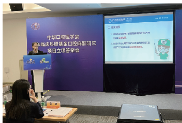
(中华口腔医学会 科技研究部 供稿 责任校对 朱若曦)

2021年10月20日，中华口腔医学会青年临床科研基金口腔麻醉研究项目立项答辩会在上海国家会展中心与中华口腔医学会第23次全国口腔医学学术会议同期召开。该项目面向口腔医学博士点院校公开招募口腔麻醉专业项目，旨在推动和促进口腔麻醉新技术、新理念的发展。申报项目负责人现场汇报答辩，评审专家就项目研究方案，预期成果等进行点评。经专家独立评审打分，最终10个项目获得立项。