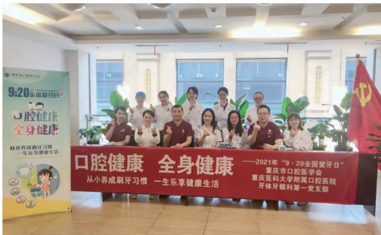
(重庆市口腔医学会 供稿 责任校对 王靓)

金秋九月，清风徐来，硕果飘香。恰逢中秋佳节，“9.20 全国爱牙日”大型联动公益活动在重庆市火热开启。重庆市口腔医学会集结全市 76 家口腔医疗机构共同发力，在线上线下开展近百场大型义诊公益活动。口腔宣教覆盖人数多达 40000 余人，取得了良好的社会反响。学会为参与本次活动的医疗机构免费提供口腔健康宣传折页 30000 多份、牙膏 6000 支。形式多样、内容丰富的爱牙日活动，为重庆的金秋增添了一抹绚烂的色彩。