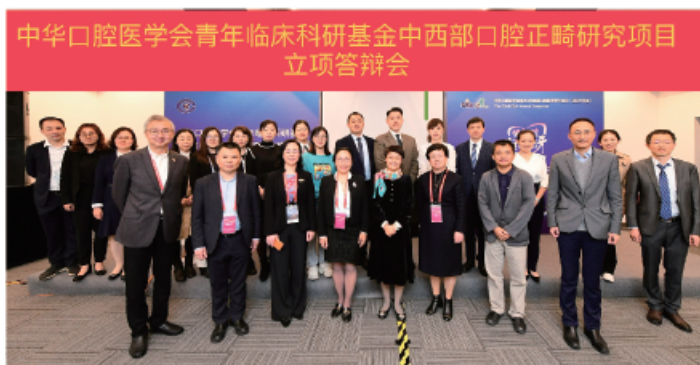
(中华口腔医学会 科技研究部 供稿 责任校对 朱若曦)

2021年10月20日，中华口腔医学会青年临床科研基金中西部口腔正畸研究项目立项答辩会在上海国家会展中心与中华口腔医学会第23次全国口腔医学学术会议同期召开。中华口腔医学会设立系列青年科研基金项目，希望鼓励口腔医学领域青年人才积极开展研究工作，搭建学科科研平台，助力口腔人才成长。本次申报项目负责人现场汇报答辩，评审专家就项目研究方案，预期成果等进行点评，不仅对项目研究进行指导，更传授了科研项目答辩经验。经现场7位专家独立评审打分，最终15个项目获得立项，其中中部地区立项7项，西部地区立项8项。