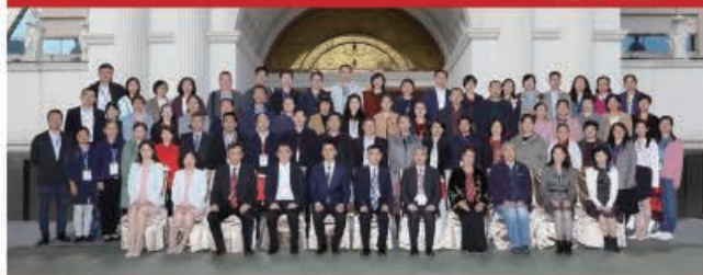
中华口腔医学会第五届中西医结合专委会合影