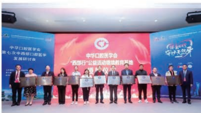
(中华口腔医学会 公益办公室 葛凤庆 供稿 责任校对 章佺)

2021年10月20日，中华口腔医学会第七次中西部口腔医学发展研讨会在上海召开，来自中西部16个省份的口腔医学会领导和基层口腔医生代表200余人参会。俞光岩名誉会长做主题报告“促进口腔健康，发展口腔医学——‘西部行’系列公益活动15年工作总结”，科技研究部单艳华副部长做专题报告“西部科研基金十年工作报告”。西部11个省份口腔医学会代表进行分享。会上进行了继续教育基地的授牌仪式，授予甘肃省人民医院等西部52家基层医疗机构“西部行”公益活动继教基地，山西医科大学口腔医院等中部3家医疗机构“中部崛起”公益活动继教基地。