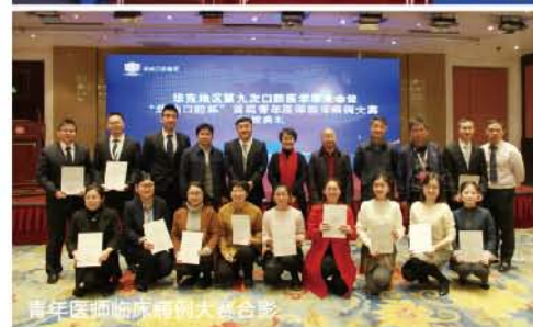
青年医师临床病例大赛合影