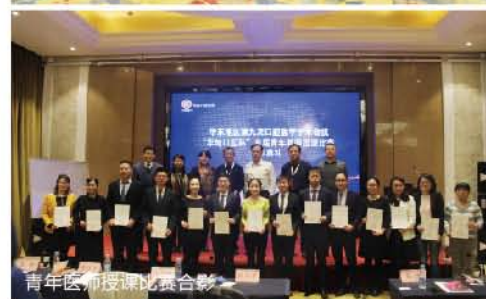
青年教师授课比赛合影