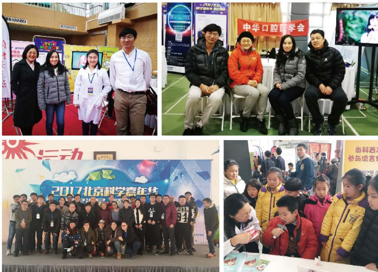
(中华口腔医学会 科学普及部 供稿 责任校对 王晓华)

活动通过播放口腔科普短片，组织刷牙比赛、菌斑染色、专家义诊咨询等方式吸引了大量儿童、青少年及家长的参与。参与菌斑染色的儿童和青少年从中更加深刻的体会到科学有效刷牙的重要性。本次活动对提高大众的口腔保健意识，引导群众践行口腔保健行为起到了积极的促进作用。