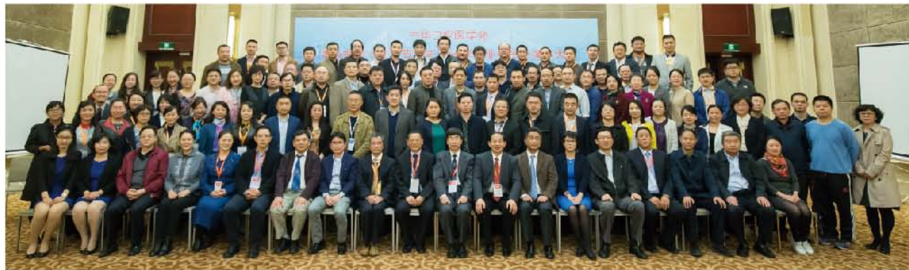
(中华口腔医学会 颞下颌关节病学及殆学专业委员会 供稿 责任校对 张媛)

会上来自国内的400多位专家学者相聚一堂,就颞下颌关节基础与临床研究的多个方面进展进行研讨。大会共收到国内外投稿167篇。