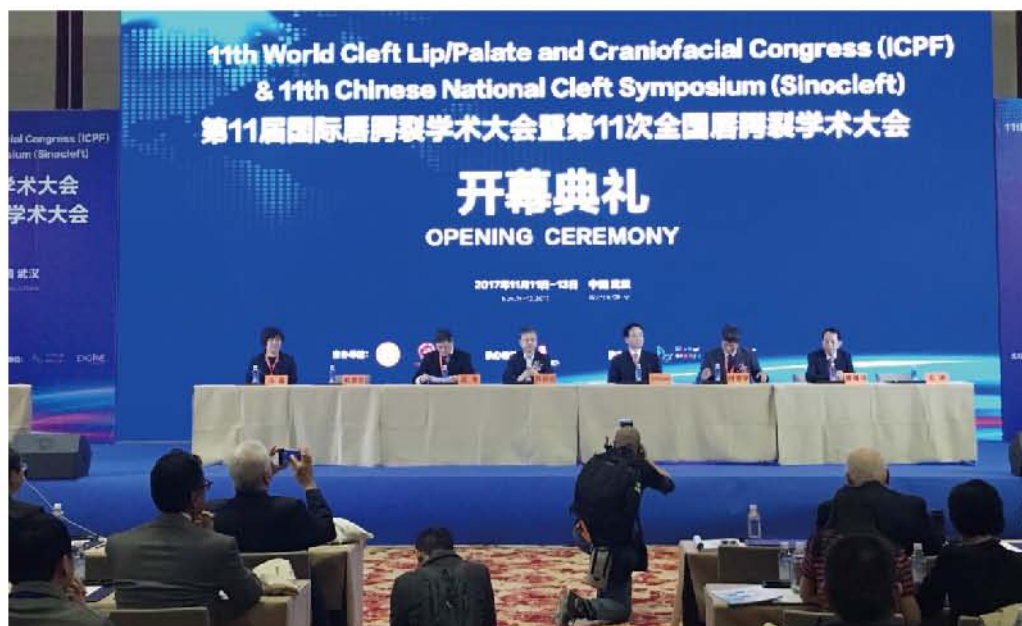
（中华口腔医学会 唇腭裂诊治联盟 供稿 责任校对 杨迪）

来自多个国家的400余名代表参加了会议，其中国外代表120名。参与会议交流论文174篇，以特邀专题报告、大会交流、壁报展示形式深入进行学术交流。本次会议涵盖了唇腭裂治疗及基础研究各领域，并就各领域治疗新进展、焦点问题、人文公益等进行了充分讨论。本次会议得到了嫣然天使基金会的支持，李亚鹏先生出席了会议，并分享了心路历程。