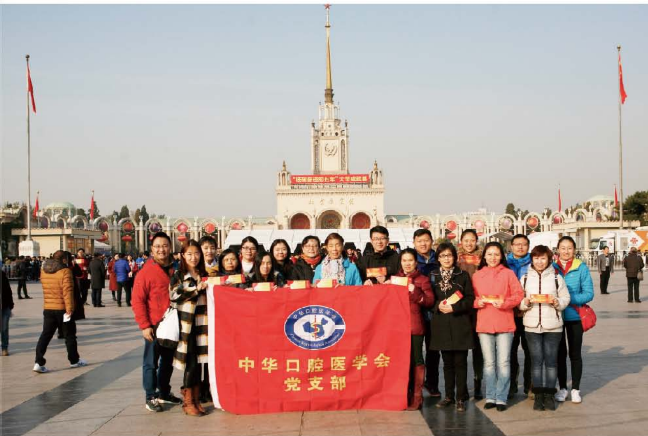
(中华口腔医学会 党支部 刘辉 供稿 责任校对 葛凤庆)

展览以习近平总书记系列重要讲话精神和党中央治国理政新理念、新思想、新战略为主线,划分10个主题展区和1个特色体验展区,全方位展示了党的十八大以来,以习近平同志为核心的党中央团结带领全党全国各族人民取得的举世瞩目的伟大成就。