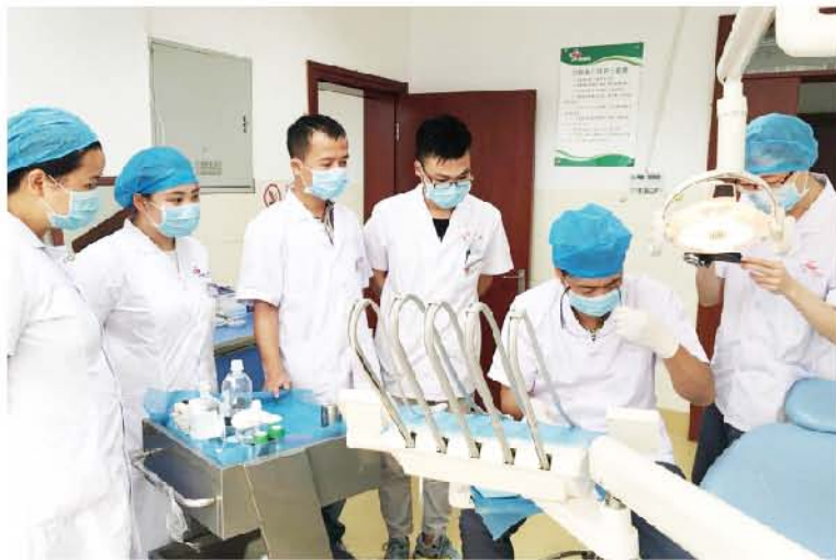
(南京医科大学附属口腔医院 顾卫平 供稿 责任校对 章佺)

小结：通过 2 周的帮扶，通过持续不断的培训和实操训练，对当地口腔卫生保健水平有了较为客观的认识和了解，在以当地现有的设备和条件基础上开展了针对性的训练，提高了医生的临床思维和临床实践能力，让他们在现有基础上提高了规范性、拓宽了思路，也增加了可以开展的新项目，如纤维桩、贴面、间接核桩，一体化冠等，让医生的临床诊疗水平真正得到提高，造福当地百姓，为提高西部的口腔卫生保健水平，为健康中国贡献了自己的绵薄之力。