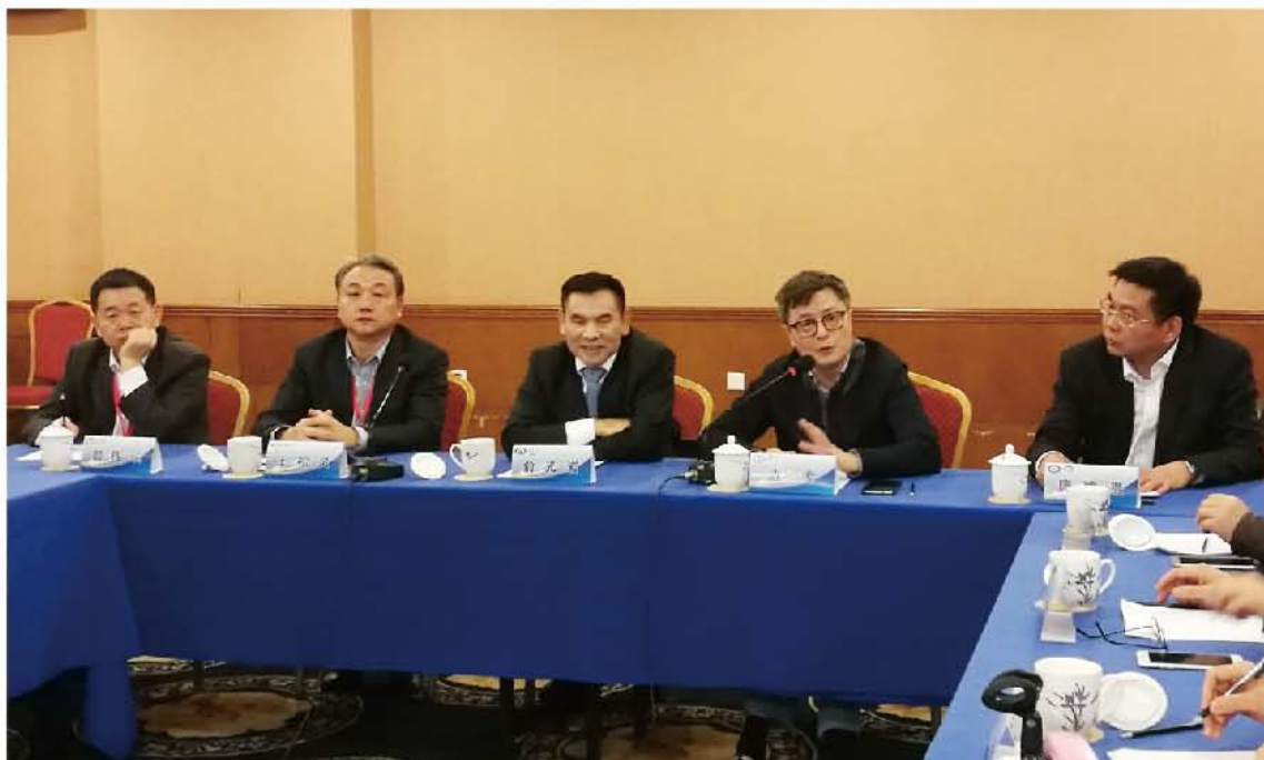
(中华口腔医学会 学术部 供稿 责任校对 刘辉)

2017年11月3-5日，中华口腔医学会特邀请管理类二级分支机构参加“2017年口腔医学教育专业委员会学术年会示范观摩活动”。在为期两天的会议观摩结束后，召开了“中华口腔医学会学术活动观摩座谈会”。座谈会上活动主办单位中华口腔医学会口腔医学教育专业委员会主任委员边专教授及承办单位中南大学湘雅口腔医学院院长唐贍贵教授分别介绍了此次活动的整体策划、筹备及承办经验。随后与会代表进行交流讨论，大家一致对活动创新的形式、有序的组织以及到位的服务给予了肯定。会议最后俞光岩会长指出，本次活动形式新颖、内容丰富，对带动我国口腔医学教育的发展起到了重要作用。希望各专业委员会(分会)都能积极开拓创新，只要有新的想法、新的思路，我们的工作必将大有可为。