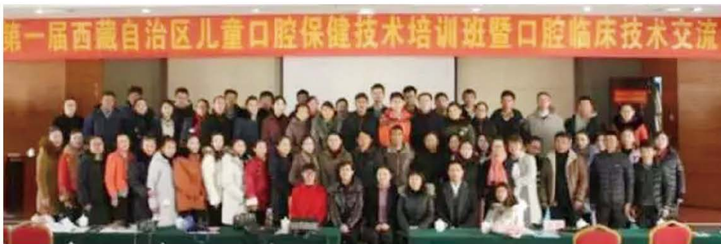
(西藏自治区第二人民医院 供稿 责任校对 卢燕)

会后,基层口腔医生提出了在藏工作的艰辛与难处,包括医院重视程度不够,基础诊疗设备不足,技术短缺,知识获得面较窄等。希望得到改善。