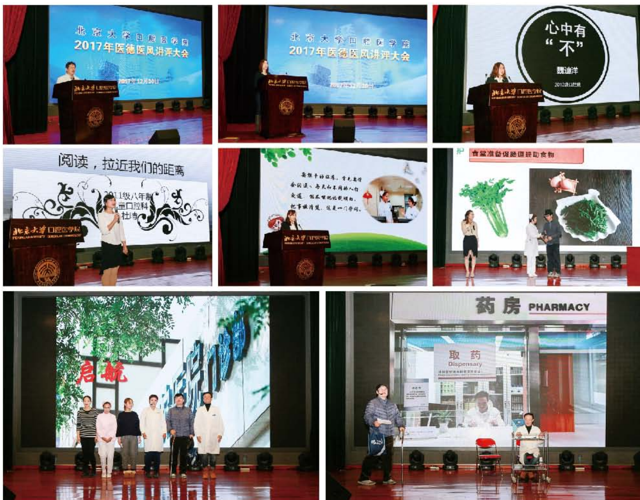
(北京大学口腔医院 供稿 责任校对 卢燕)

最后，医学部党委宣传部焦岩部长进行了总结，她用“有声有色、有模有样、有情有义”三个词对北大口腔医院的医德医风讲评大会表示了充分肯定。作为一个存在了二十多年的品牌活动，本次大会焕发出了新的生机，通过讲述者们声情并茂的讲述，深刻感受到了北大口腔医院在医德医风、师德师风、医学人文精神的建设中起到的作用和传递的正能量。她希望，北大口腔医院作为一个不断进步的集体，能够在以后的日子里继续营造出人人向上、人心向善的氛围，继续弘扬加强医德医风建设。