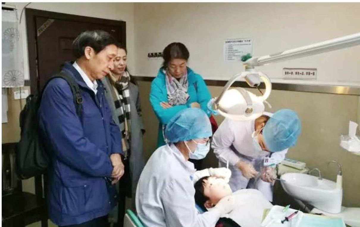
(全国儿童口腔疾病综合干预项目国家项目办 供稿 责任校对 卓静)

督导组听取了省级和江北区、渝北区项目进展情况的汇报，查阅了文件资料档案，与相关人员进行座谈。检查了江北区中医院窝沟封闭操作流程，考察了江北区新村小学校窝沟封闭操作现场、渝北区渝北幼儿园局部用氟操作现场，评估封闭效果和学生、老师、家长健康教育效果。最后，国家督导组现场将结果向重庆市进行了反馈。