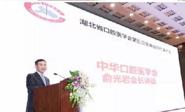
(湖北省口腔医学会 李四群 供稿 责任校对 王靓)