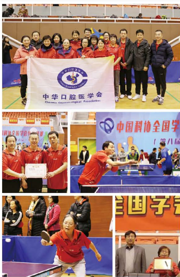
(中华口腔医学会 党支部/工会 葛凤庆 供稿 责任校对 张欣)

此次是中华口腔医学会学会连续第6年组队参赛，学会党建引领、团结凝聚会员，展示了口腔医学科技工作者敢为人先、拼搏奉献的精神风貌。