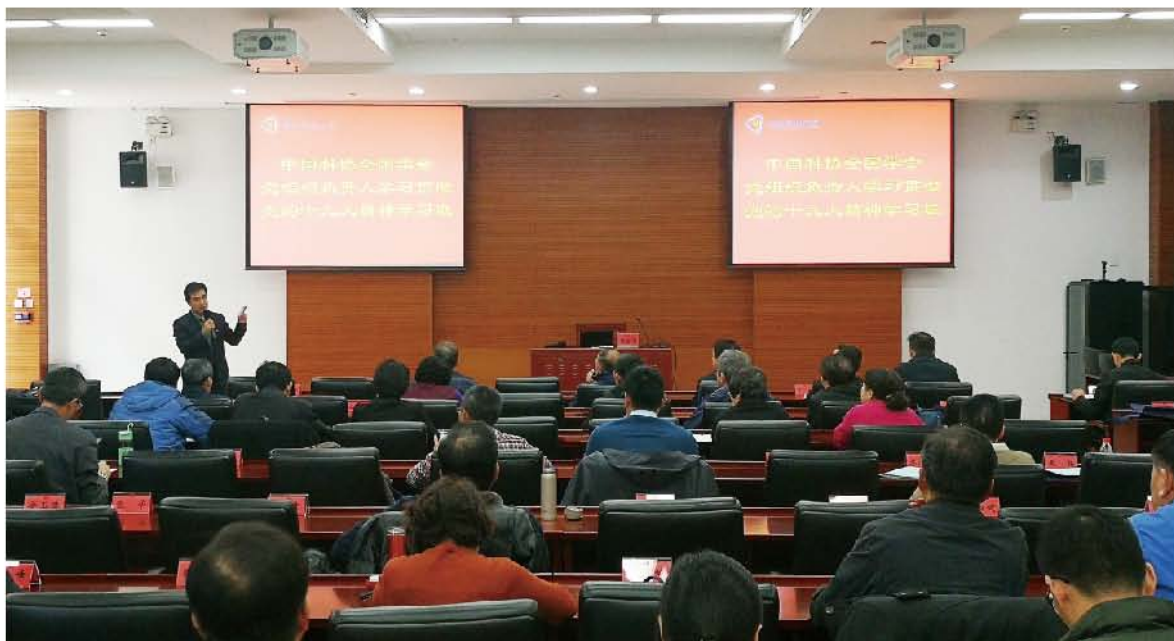
(中华口腔医学会 党支部 葛凤庆 供稿 责任校对 张欣)

此次培训班是中国科协科技社团党委根据科协党组领导指示要求和机关党委统一部署组织实施，三天的学习，通过民政部社会组织管理局、中国科学技术发展战略研究院、中央党校的专家教授对十九大报告精神、新党章进行系统解读，深入学习党的十九大精神核心要义，深刻领会和把握习近平新时代中国特色社会主义思想精髓。