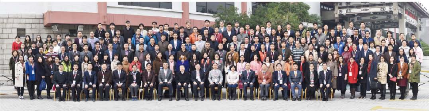
(中华口腔医学会 口腔修复工艺学专业委员会 供稿 责任校对 张媛)

本次大会的主题是“口腔修复工艺的多学科研究与发展”。来自国内外的口腔临床专家和资深技师分别作了口腔临床修复与技师修复工艺病例技术交流与演讲。会议还设立了大会发言、CAD/CAM技术展评、壁报展示等多种交流形式。