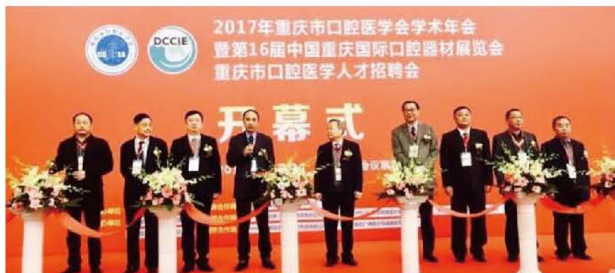
（重庆市口腔医学会 供稿 责任校对 王靓）

病例展评，现场展示了9台种植手术过程，还开设牙周手术操作培训班和口腔健康公益大讲堂，年会同期举行了重庆市口腔医学人才招聘会。学术年会的胜利召开，将有力地促进重庆乃至西部地区口腔医学领域的学术和技术交流。