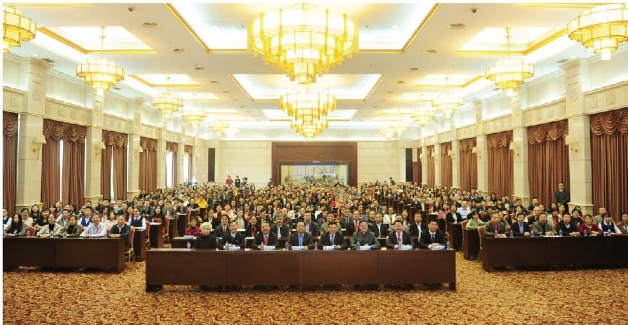
(中华口腔医学会 学术部 供稿 责任校对 张媛)

最后大会以微信投票、借助网络平台向社会同步视频直播技能展示现场实况等创新形式，吸引了超高的参与人气及收到了全国众多院校师生同时异地关注的良好效果。本次会议作为中华口腔医学会2017年甄选出的示范观摩会议，受到了观摩团领导的一致好评。