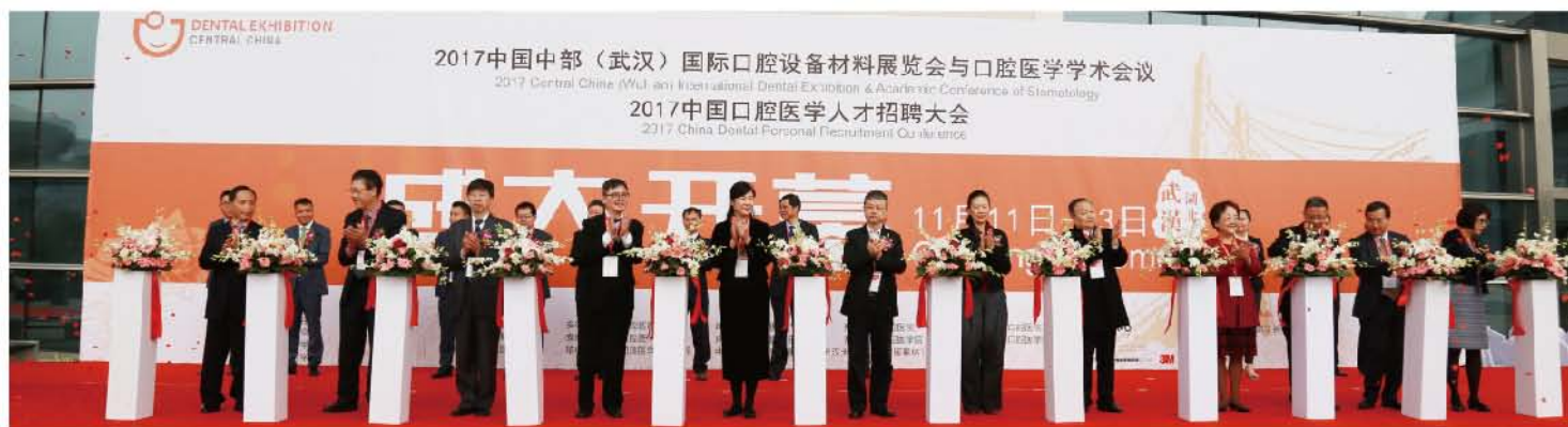
（武汉大学口腔医院 孙晓言 供稿 责任校对 王靓）

会议由湖北省口腔医学会、安徽省口腔学会、河南省口腔医学会、湖南省口腔医学会、江西省口腔医学会等单位主办，得到中华口腔医学会、各省市口腔医学会、口腔医学院校和口腔医院等单位的大力支持。会议吸引约12000名观众，同期还举办了口腔人才招聘会。