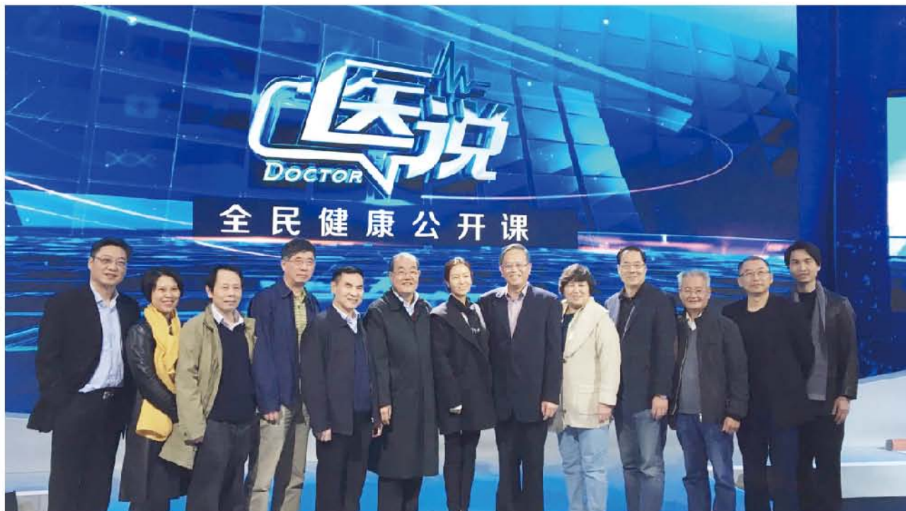
（中华口腔医学会 办公室 供稿 责任校对 王靓）

本次活动得到了北京大学口腔医学院和首都医科大学口腔医学院的大力支持，保证了节目顺利录制完成。