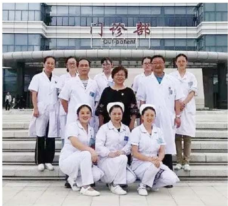
(中华口腔医学会 公益活动办公室 葛凤庆 供稿 责任校对 章伶)

“西部行”公益活动志愿者，口腔黏膜病学知名专家北京大学口腔医院刘宏伟教授情系西部，于2017年8月来到贵州省安顺市人民医院，举办了专题讲座、临床会诊、示范教学等一系列帮扶内容，行程满满。为帮扶医院带来的不仅是临床技术的提高，更有理念和观念的转变，多次的奔波往返倾情相授，刘教授和西部医院结下了深厚的友谊，精准的医疗帮扶在志愿者平台的推动下将长久的展开。