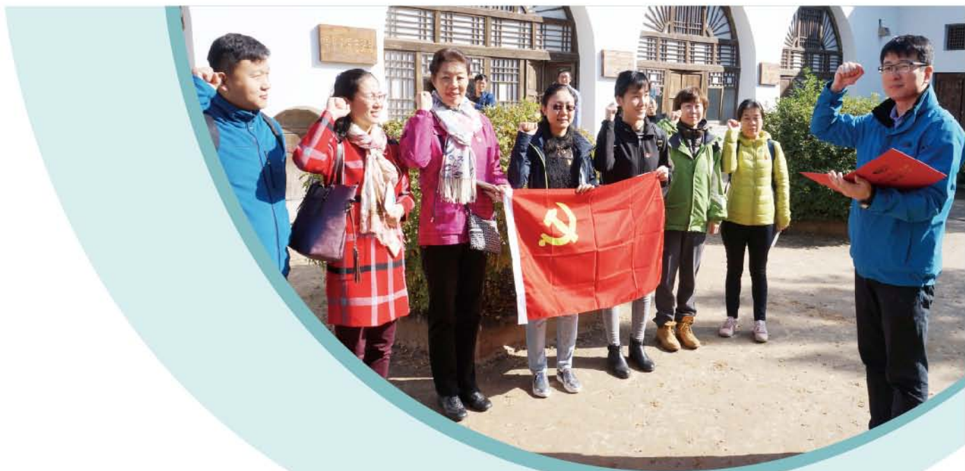
(中华口腔医学会 党支部 葛凤庆 章仨 供稿 责任校对 张欣)

三天的党建帮扶活动，行程满满。基层口腔医学发展，任重道远，既需外力精准医疗帮扶，更需内力自我精确定位发展。促进中部尤其是革命老区口腔医学的进步，中华口腔医学会帮扶进行中。