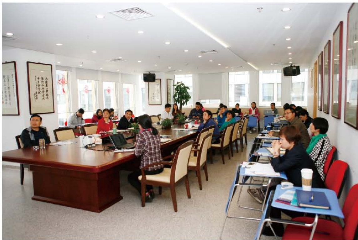
（中华口腔医学会 办公室 供稿 责任校对 王靓）

2017年10月11日，中华口腔医学会秘书处召开了第19次全国口腔医学学术会议（2017年会）总结会。本次会议由岳林秘书长主持，会议按四大版块（学术活动，工作会议，重要活动和宣传、注册、后勤保障），分两部分进行总结。第一部分为年会工作的优点及亮点总结，提炼出了值得今后固定下来的工作程序；第二部分对年会中发现的问题进行了分析，提出改进方案。通过对优缺点的梳理，为今后在年会组织及实施工作中扬长避短，打造精品学术年会奠定了坚实的基础。