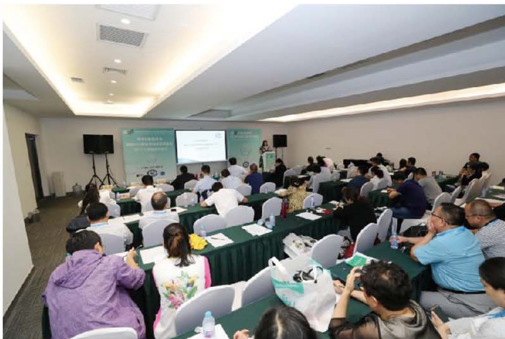
（中华口腔医学会 科技研究部 供稿 责任校对 朱若曦）

2017年9月21日，中华口腔医学会西部临床科研基金2017立项答辩评审会在上海召开。陈吉华副会长出席会议并讲话。中华口腔医学会西部临床科研基金2012年设立，学会每年出资五十余万元支持西部地区口腔医生开展具有实用推广价值的临床新技术、新疗法的应用研究，培育当地口腔医学骨干及其科研能力。2017年共收到西部地区11个省（自治区）申报的22项科研项目。经专家组评审，最终12个项目获得立项。