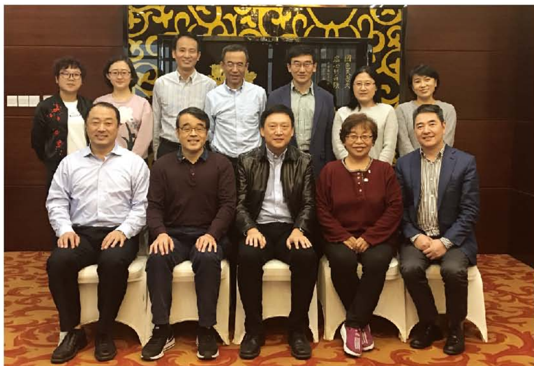
(中华口腔医学会 口腔医疗事业部 供稿 责任校对 侯敏)

2017年10月20日，受国家卫计委委托，中华口腔医学会组织部分口腔种植科专家赴哈尔滨参加了“口腔种植技术管理规范修订会议”。会议形成的修订稿还将广泛征求意见，最终定稿。