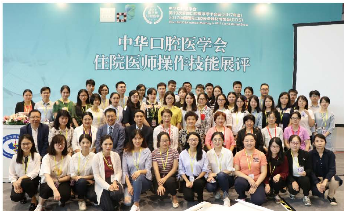
(中华口腔医学会 口腔医疗事业部 供稿 责任校对 侯敏)

2017年9月23日,中华口腔医学会第19次全国口腔医学学术会议(2017年会)暨上海国际口腔设备器材博览会期间,中华口腔医学会在上海首次举办“口腔住院医师操作技能展评擂台赛”,在6月北京初赛选举的15位擂主基础上,共有来自全国22家医院派出了的47名口腔住院医师参加,经过激烈角逐,15位优秀选手获得综合技能展评一、二、三等奖,9位选手分别夺得3个技能的各自项目前3名。