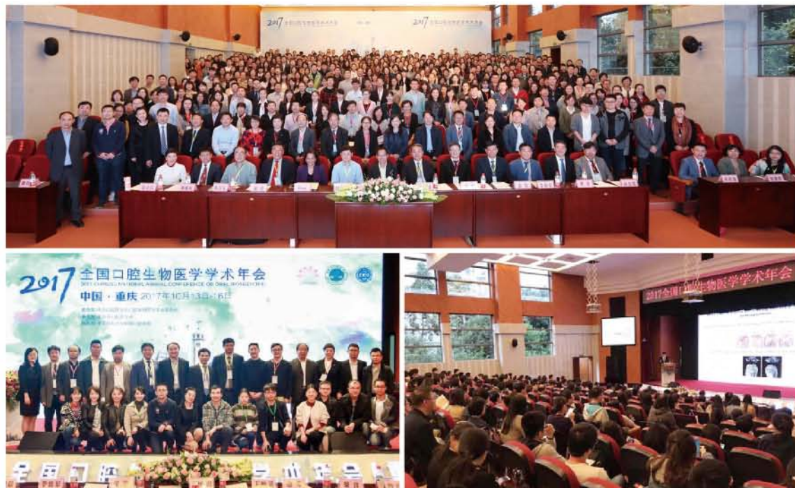
（中华口腔医学会 口腔生物医学专业委员会 供稿 责任校对 张媛）

会议期间共举办6场特邀报告、6场专题报告、11场大会发言；38位口腔青年研究者角逐第六届口腔生物优秀青年研究奖；73位青年学者以壁报展示的形式参与第二届口腔生物医学新锐奖评选。