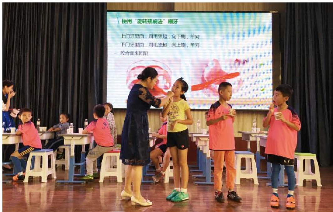
(中华口腔医学会 科学普及部 供稿 责任校对 王鹤达)

本次会议由生动具体的小学生口腔健康教育课件演示，现场刷牙指导，菌斑染色等形式授课，激发了小学生的刷牙兴趣及志愿者医生的积极性。期间与会的小朋友积极配合授课老师完成相应操作，志愿者们积极发言和提问，现场气氛活跃，达到了培训的预期效果。