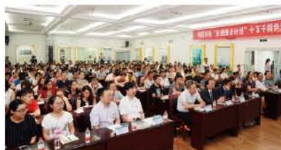
(党支部 供稿 责任校对 葛凤庆)