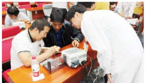
(刘辉 供稿 责任校对 葛凤庆)