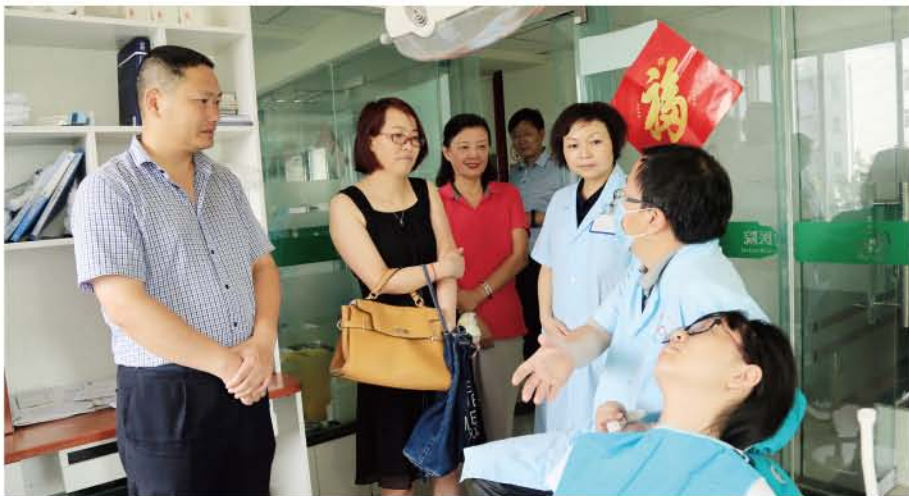
(西昌口腔医院 供稿 责任校对 葛凤庆)