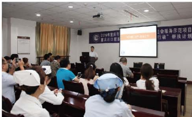
（重庆市口腔医学会 供稿 责任校对 于硕）