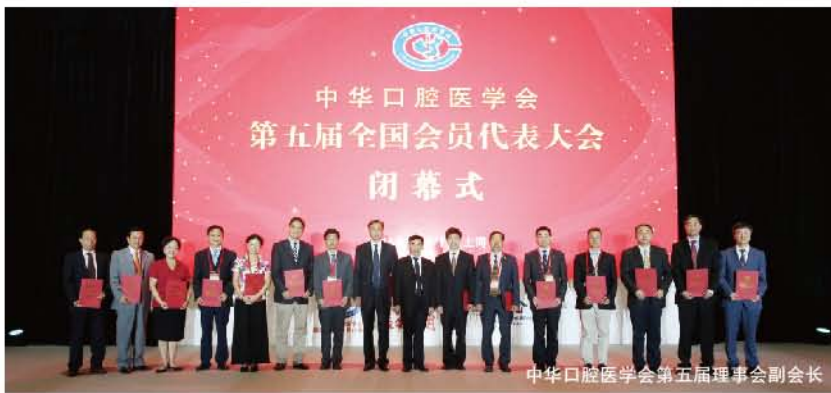
中华口腔医学会第五届理事会副会长

中华口腔医学会第五届全国会员代表大会圆满完成了所有议程，顺利完成了学会换届工作。这是一次成功的大会，载入史册的大会。新一届理事会将继承学会优良传统，带领全国口腔医学工作者继往开来，为创建中国口腔医学事业更美好的明天共同努力。