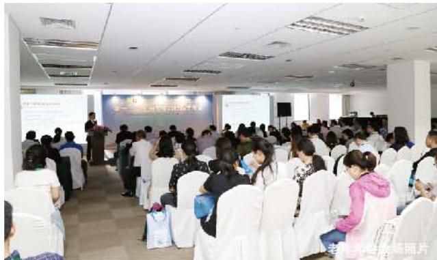
老年年会会场照片

会议同期进行了大会报告和评比，从提交的病例中筛选了6个代表性的病例，涵盖了老年口腔内科、外科，修复，种植等学科，代表了我国目前老年口腔医学诊疗的先进水平。