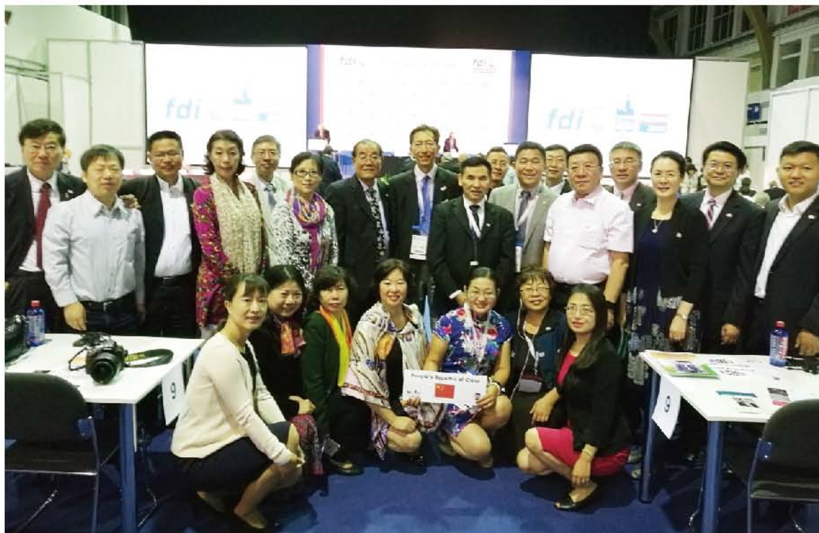
(国际交流部供稿 责任校对 蒋依兰)

大会期间学会还同美国、日本、韩国、德国牙医学会分别进行了沟通与交流，达成双方长期的合作共识与目标，并与亚太口腔组织及国家针对进一步加强亚太地区口腔合作与交流进行了建议性的沟通。