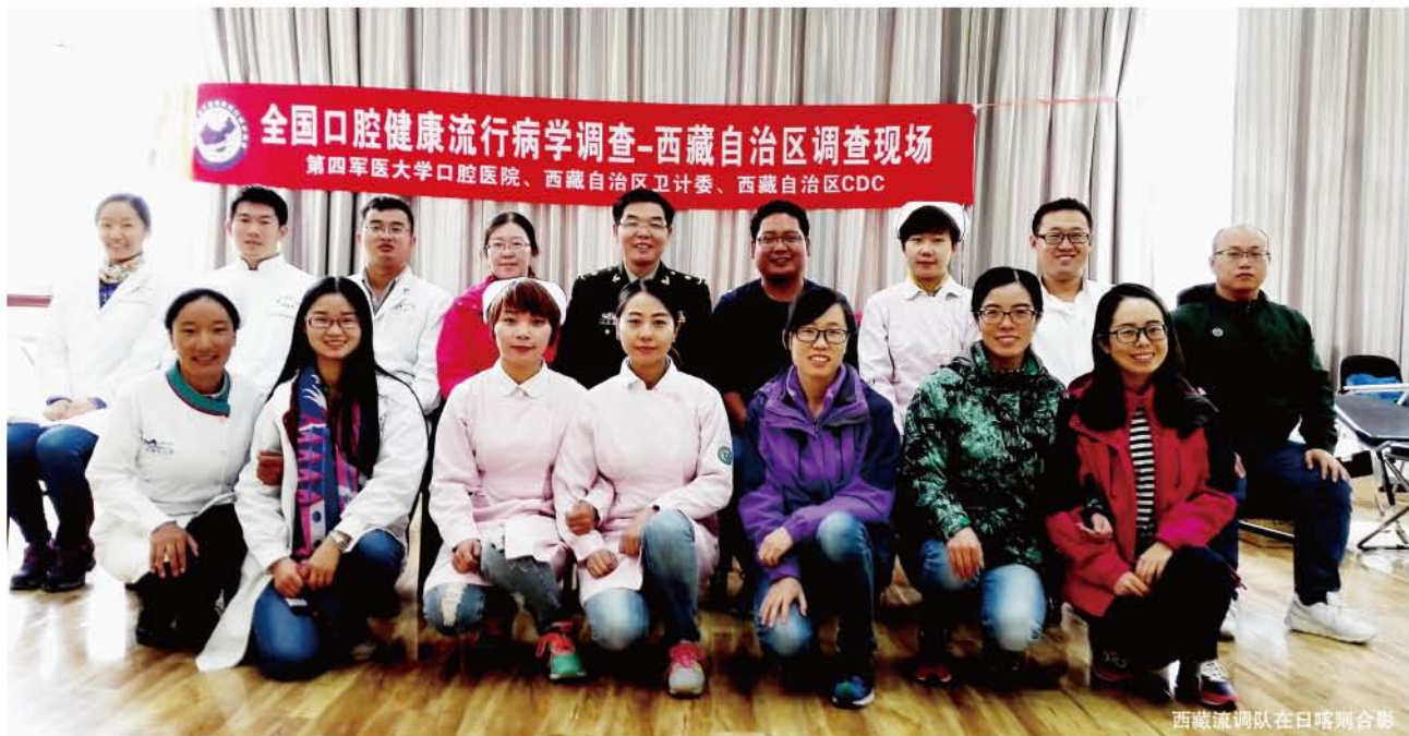
西藏流调队在日喀则合影