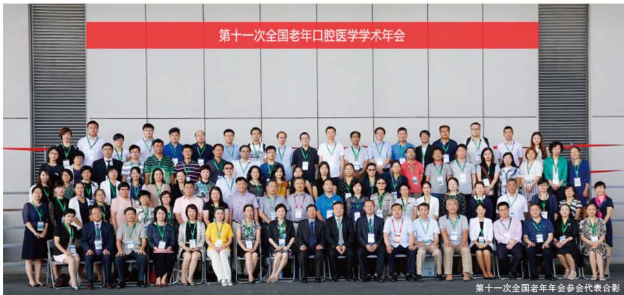
第十一次全国老年年会参会代表合影