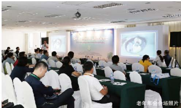
老年年会会场照片