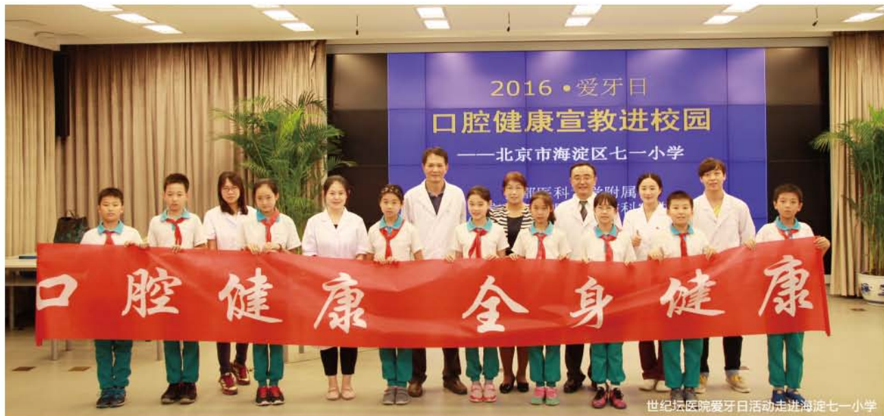
世纪坛医院爱牙日活动走进海淀七一小学