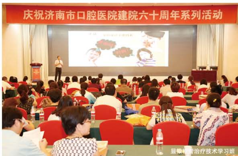
显微根管治疗技术学习班