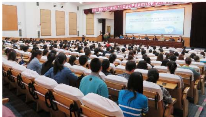
(张亚伦 供稿 责任校对 葛凤庆)

疗、种植体周围炎诊疗，伴糖尿病、心血管病、高血压病牙周炎患者治疗时机的选择以及侵袭性牙周炎的多学科治疗进行了细致的讲解，为学员演示了规范化的操作手法。省内十余名专家的报告代表了甘肃口腔医学的发展水平，来自全省280余人参加会议，大家纷纷表示受益匪浅并感受到学习热情的空前高涨。西部行活动与省学会年会合并举办，既调动了西部口腔专家的积极性，也加强了省内口腔学术的交流氛围。