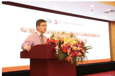
(南京大学医学院附属口腔医院供稿 责任校对 卓静)