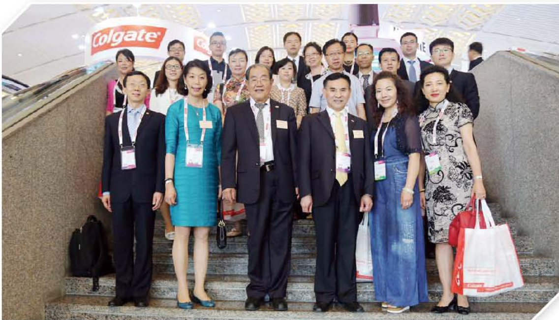
（国际交流部供稿 责任校对 蒋依兰）

受学会及香港牙医学会学术交流基金资助，来自内蒙、宁夏、青海等西部十一个省区及相关支持“西部行”公益活动的医学院校代表共计22人，也同期赴港参加学术会议。通过参观和学习，代表们开拓了视野，增进了对国际口腔医学、口腔器材发展的了解。这是该基金连续第三年支持西部代表参加学术会议。基金由双方等额出资建立，支持中国西部地区口腔医生参加国际、国内学术交流，推动我国西部地区口腔医学的发展。