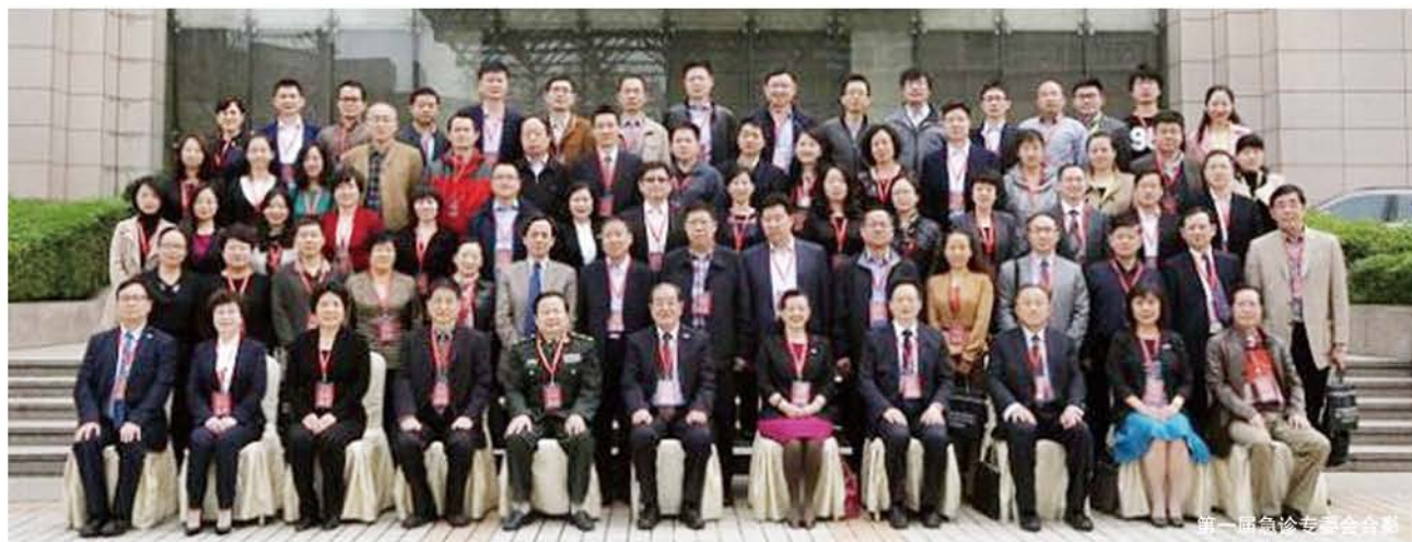
第一届急诊专委会合影