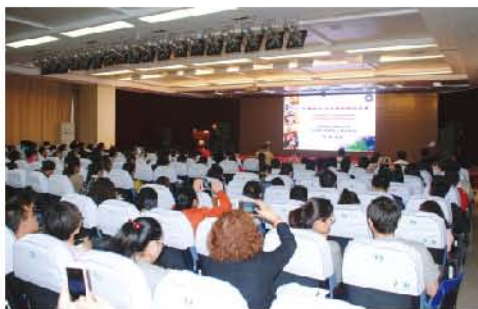
(刘辉 供稿 责任校对 葛凤庆)