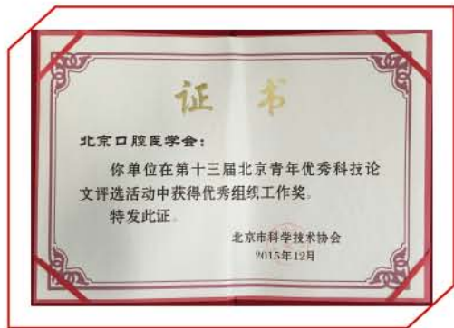
(北京口腔医学会供稿 责任校对 于硕)