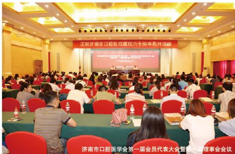
济南市口腔医学会第一届会员代表大会暨第一届理事会会议

济南市口腔医学会的成立，是济南市口腔医学事业发展史上的里程碑，对于推进口腔医学学术研究、提高口腔医疗诊治水平、提升公众口腔健康意识将发挥重要作用。