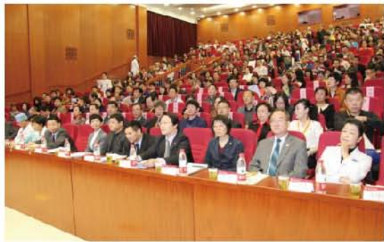
(北京大学口腔医院供稿 责任校对 卓静)