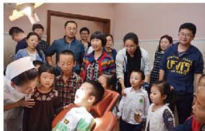
(重庆市口腔医学会供稿 责任校对 于硕)