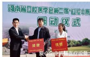
爱心企业捐赠医疗设备