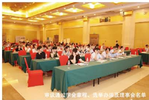
审议通过学会章程、选举办法及理事会名单