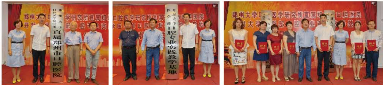
(郑州市口腔医院谢和荣供稿 责任校对 卓静)

郑州市口腔医院与郑州大学口腔医学研究所及开封大学医学部口腔专业的揭牌仪式标志着郑州市口腔医院向更深层次的校企合作又迈出了坚实的一步。