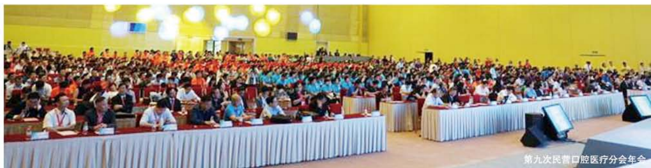
第九次民营口腔医疗分会年会

本次年会针对口腔各专业领域共设置口腔诊所管理论坛、口腔正畸、口腔种植、儿童口腔、牙体牙髓、民营口腔医院管理、口腔美学、感控、急救等九个主题专场。并在会议正式开始前，全省范围内开展一系列精品学习班，提前对大会进行预热。