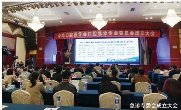
急诊专委会成立大会