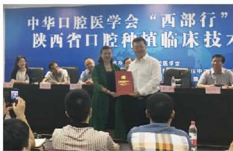
（于硕 供稿 责任校对 葛凤庆）