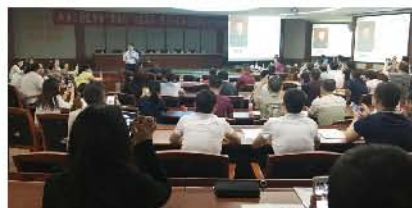
(于硕 供稿 责任校对 葛凤庆)