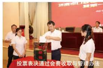
投票表决通过会费收取与管理办法