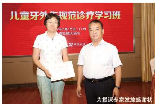
为授课专家发放感谢状