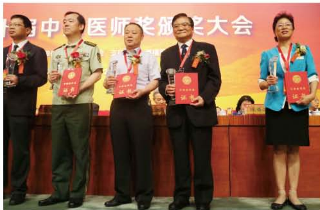
（北京大学口腔医院供稿 责任校对 卓静）