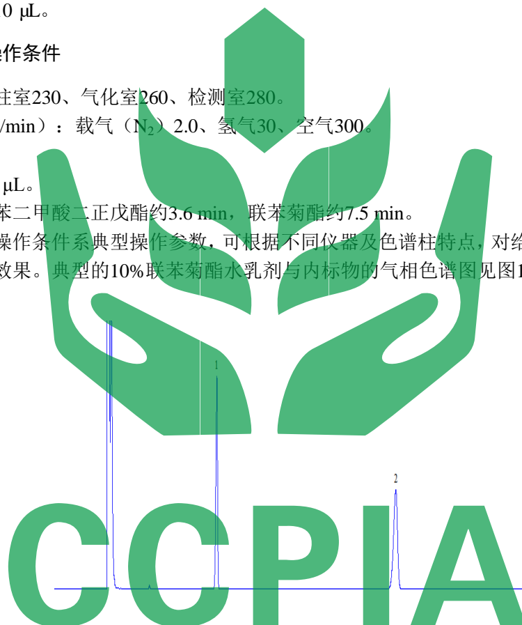
图1 10%联苯菊酯水乳剂与内标物的气相色谱图