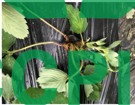
图C.5 草莓枯萎病症状图

枯萎病主要危害草莓的根系、叶片、叶柄和果柄。症状主要表现在开花至收获期。心叶黄绿色或黄绿色卷曲，变小变狭，呈船形，叶片无光泽，下部叶片变紫色枯萎，叶缘褐色向内卷。叶柄和果柄的维管束变褐色和黑褐色，地下根系呈黑褐色，不长新根。