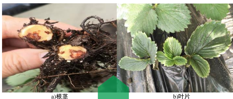
图C.6 草莓黄萎病症状图

凋萎褐变，最后植株枯死。根、叶柄和茎的维管束发生褐变甚至变黑，植株严重矮化。与根腐病的区别是根的中心柱维管束不变红褐色。