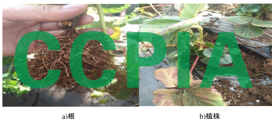
图C.7 草莓根结线虫危害症状图

根结线虫主要危害草莓的根部。在根内取食致使根部细胞变大，并迅速增生，出现肿胀，根尖处形成大小不等的节瘤。在节瘤的上部和周围有过多根系生长，整个根系形成零乱的须根团。植株生长衰弱，表现为缺水缺肥状，生长缓慢，叶片变黄，叶缘焦枯并提前脱落，开花迟。果实进入成熟期后，植株干旱似萎蔫，果实明显变小，成熟推迟。