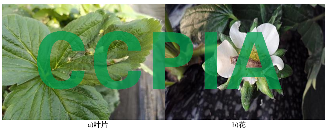
图C.11 斜纹夜蛾幼虫危害症状

主要危害草莓的叶、花和果实。一龄~二龄幼虫群集啃食叶片，留下叶脉和叶片上表皮。三龄幼虫开始转移分散危害。四龄幼虫后昼伏夜出，将叶片取食成小孔或缺刻，严重时吃光叶片，仅留主脉，在心叶基部取食叶柄，使心叶折断枯死。也取食草莓的花蕾、花和果实。