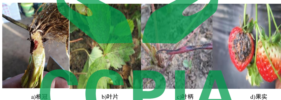
图C.3 草莓炭疽病症状图

主要危害草莓的叶片、根冠、花和果实。初始1片~2片展开叶失水下垂，傍晚或阴天恢复正常。叶柄、叶片染病，产生纺锤形或椭圆形病斑，直径3mm~7mm，黑色，溃疡状，稍凹陷。叶柄上的病斑扩展为环形圈时，植株茎秆逐渐变为暗红色，全株枯死。根冠部横切面自外向内发生褐变。花器染病，花瓣、萼片、花蕊干枯死亡。果实染病产生近圆形病斑，褐色软腐。