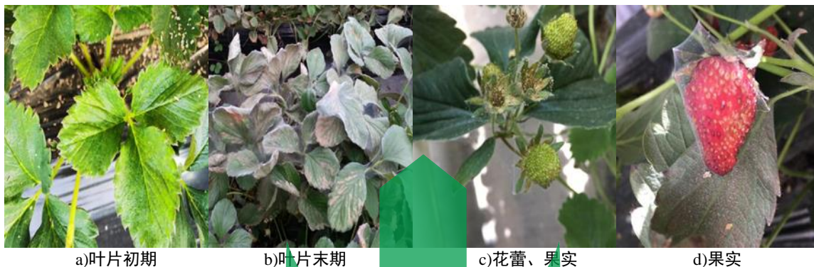
图C.8 红蜘蛛危害症状

主要危害草莓的叶、花蕾和幼果。在草莓叶背刺吸汁液、吐丝、结网、产卵。受害叶片症状表现为先从叶背面叶柄主脉两侧出现黄白点至灰白色小斑点，叶片变黄失绿，严重时整个叶片黄化卷曲或者干枯呈锈色，植株生长受到抑制，植株萎缩、矮化。刺吸幼嫩花蕾部位汁液，使其萎缩不能正常生长，幼果受害表面呈黄褐色，果实僵硬。