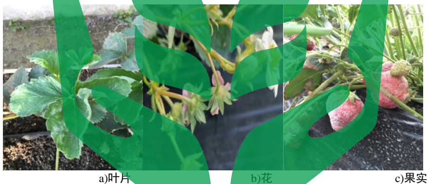
图C.1 草莓白粉病症状图

主要危害草莓的茎、叶、花和果实。发病初期在叶背面形成白色丝状菌丝，随着病菌扩散，叶片边缘两侧向上卷曲呈汤匙状。发病后期叶背产生一层白色粉状物，叶片上产生大小不等的褐色斑点，叶缘向上卷曲。当花被感染时，花蕾无法开放，花瓣变粉红色，坐果不良。果实感病表面有一层白色绒毛，未成熟的果实变硬，不能正常膨大，成熟果实呈软泥状。