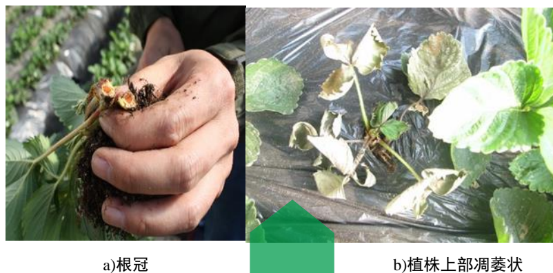
图C.4 草莓根腐病症状图

紫褐色，逐渐向上扩展，全株萎蔫或枯死。根部中央呈明显红色，与四周白色根部组织区分明显，后逐渐扩散至根茎部位，最终根部完全变为红褐色，腐烂。