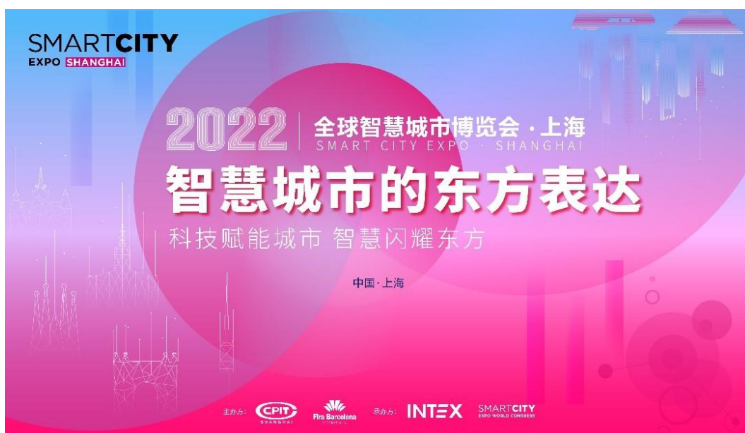
图 1：“2022 全球智慧城市博览会·上海”主题发布

首届“全球智慧城市博览会·上海”计划于 2022 年 10 月在浦东新国际博览中心举办，将重点展示智慧城市建设中，基础设施、城市管理与服务、新型制造业、信息服务、智慧交通、智慧社区、智慧零售、智慧医疗、智慧养老等各个板块的新理念、新技术、新产品、新成果。规划展览面积 2 万平方米，国内外展商 300 余家，展示将采用场景式、沉浸式、互动体验等方式进行。同期还将举办二十余场相关主题研讨会与专项发布活动，推动智慧城市建设中相关产业的行业标准建立、技术交流及成果转移转化，真正实现科技赋能智慧城市建设。同时还将收集和甄选中国优秀的智慧城市案例及解决方案，积极推动中国城市和项目参与全球智慧城市大奖角逐。