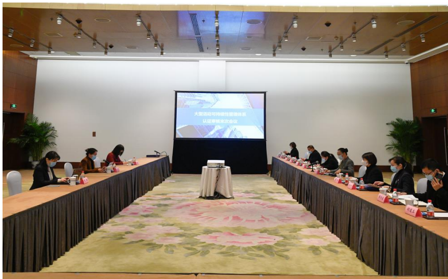
可持续性管理体系认证末次会议现场

社会责任方面的行动要求和控制措施，用于指导企业大型活动可持续性管理体系各项管理活动的实施。2018年11月30日，国家会议中心通过了大型活动可持续性管理体系认证审核，成为国内首家完成大型活动可持续性管理体系认证的会展场馆企业。