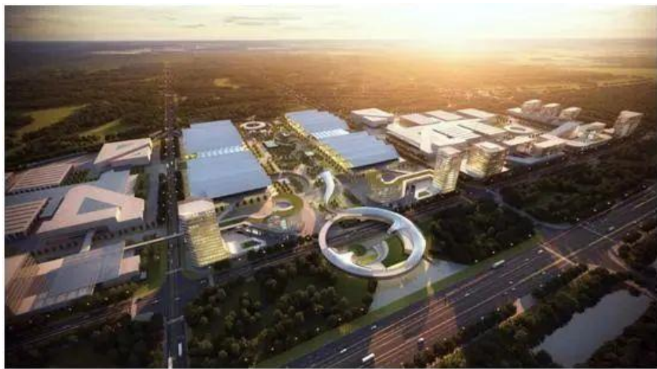
大兴国际会展中心效果图

综合保税区、非保物流区、国际航空社区和国际生命健康社区将作为临空区四大产业区。综保区规划建设生物医药保税研发中心、国际供应链分拨中心、高端消费销售服务中心、高精尖智能制造中心和高附加值维修检测中心等“五大功能中心”。非保物流区重点发展航空物流、跨境电商、冷链物流等产业，与制造、贸易、金融等行业深度融合，打造国际航空物流枢纽。国际航空社区重点吸引航空强关联企业，布局机场配套、航司、服务保障等产业，打造以临空前沿科技为龙头，航空综合服务为支撑，国际品质社区为基底的产居融合社区。国际生命健康社区承载公立医疗、国际医疗、医学教研等多种医疗设施，聚焦生命健康产业，打造以生命健康精准医疗为核心，医学研究、医药产业为支撑，蓝绿生态为基底的产居融合社区。