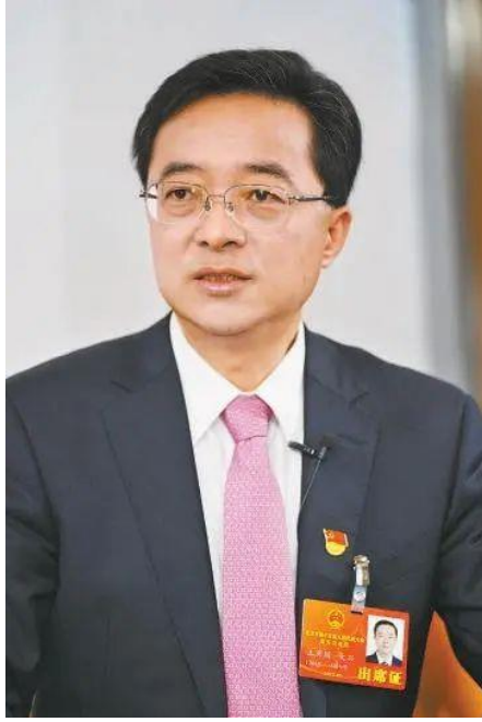
北京市大兴区委书记王有国

围绕以生命健康产业为引领，以航空服务保障和航空枢纽服务为基础，以新一代信息技术和智能装备为储备的“1+2+2”产业布局，“十四五”期间，大兴机场临空区重点打造以“会展+消费枢纽”为双引擎的“2-4-6”产业空间载体，构建四大产业区，先行落地六大专业园，实现片区联动、园区先行，为吸引外向型产业落地提供条件支撑。