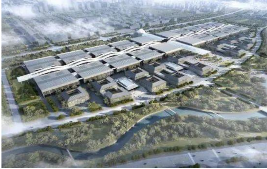
大兴国际会展中心效果图

综合保税区、非保物流区、国际航空社区和国际生命健康社区将作为临空区四大产业区。综保区规划建设生物医药保税研发中心、国际供应链分拨中心、高端消费销售服务中心、高精尖智能制造中心和高附加值维修检测中心等“五大功能中心”。非保物流区重点发展航空物流、跨境电商、冷链物流等产业，与制造、贸易、金融等行业深度融合，打造国际航空物流枢纽。国际航空社区重点吸引航空强关联企业，布局机场配套、航司、服务保障等产业，打造以临空前沿科技为龙头，航空综合服务为支撑，国际品质社区为基底的产居融合社区。国际生命健康社区承载公立医疗、国际医疗、医学教研等多种医疗设施，聚焦生命健康产业，打造以生命健康精准医疗为核心，医学研究、医药产业为支撑，蓝绿生态为基底的产居融合社区。