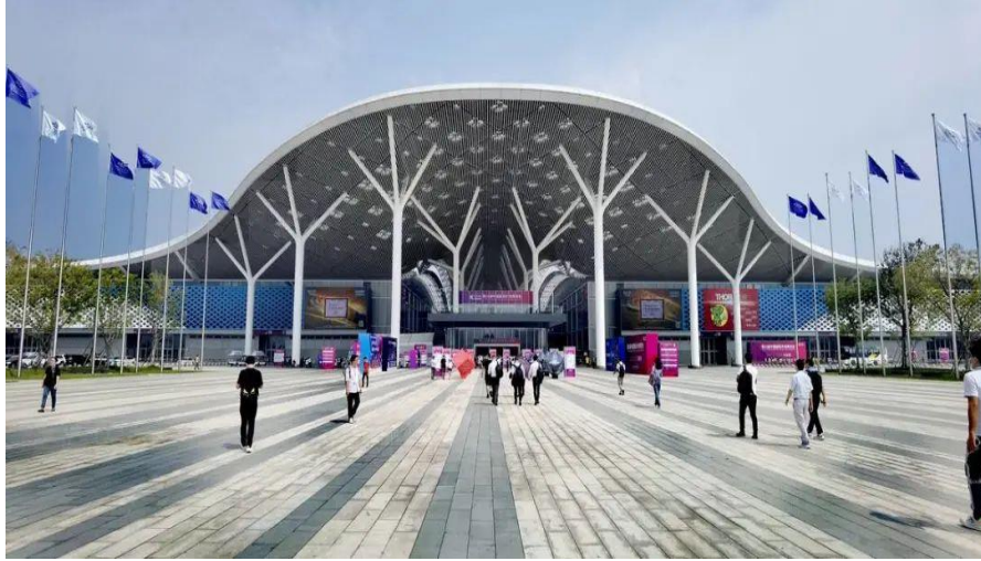
深圳国际会展中心

新一代信息技术，探索“数字+会展+X”新模式，促进会展新业态新技术创新发展，打造一批智慧化、创新型特色展会。全面构建绿色会展体系，鼓励和支持重点展馆、重点展会开展试点，推动绿色展馆、绿色展会认证。