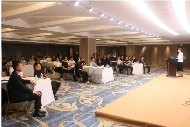
2022 郑州国际会展中心客户交流会

郑州国际会展中心自 2005 年建成投用后，在社会各界的大力支持下，取得了令人满意的成绩，在业界获得了良好的声誉，为郑州市会展业的发展作出了贡献。当前，随着国家中心城市建设和国有企业改革的步伐加快，郑州会展中心所担负的任务更加多样和艰巨。为保持郑州国际会展中心健康发展，郑州国际会展中心有限公司和展馆原委托管理公司友好协商，顺利完成了管理权责的移交，实现了郑州国际会展中心业务和运营的有序交接和平稳过渡。在今后的运营管理中，郑州国际会展中心将不断提升综合服务水平，改善现有设施设备，延长展馆服务链条，加强管理队伍建设，坚持国有企业的担当，与展会主办方一同提升郑州会展的对外新形象，推进郑州会展业的高质量发展，服务国家中心城市建设和发展。