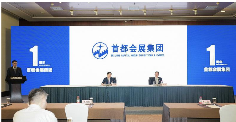
首都会展（集团）有限公司成立一周年媒体沟通会现场

首都会展（集团）有限公司成立一周年媒体沟通会今天在国家会议中心召开。会上发布消息称，当前首都会展在全国范围内自持及受托管理会展场馆已达24个。今后将全力做好重大国务政务活动服务保障工作和服贸会、中关村论坛、金融街论坛首都“三平台”市场化运作等工作。