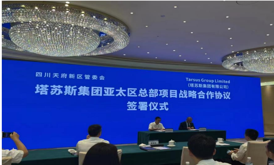
塔苏斯集团亚太区总部项目战略合作协议签署仪式现场

近年来，成都着力加强与国际知名会展企业合作，大力引进国际知名品牌展会，推动国际知名会展公司在成都设立分支机构。塔苏斯展览集团总部位于英国伦敦，业务遍及全球多个垂直领域，是享誉全球的专业 B2B 会展及媒体领域的世界级领军企业。塔苏斯集团在成都设立亚太区总部，将充分发挥国际知名会展集团强大的产业资源整合能力和管理运营能力，围绕展览、会议等相关领域展开全面合作。