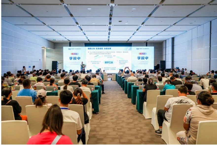
中国工业经济联合会会长、 工业和信息化部原部长李毅中发表演讲

从发布“中国制造 2025”战略，到扶持“专精特新”企业发展，促进国产工业技术创新升级已成为驱动我国经济发展的重要动力。立足“中国制造·服务全球”理念的 CIE 2022 用“连接”创造价值，积极促进产业与应用的交流互通，倾力撬动整个北方地区工业市场潜能释放，更向世界展现出了更创新、更具力量的中国制造！