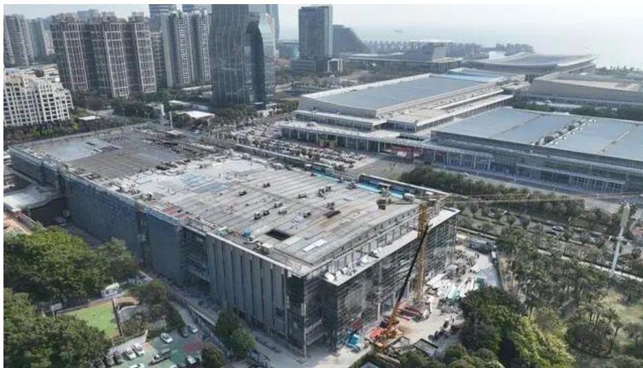
厦门国际会展中心五期混凝土主体结构近日全面封顶

3月3日，随着最后一方混凝土浇筑完成，厦门国际会展中心五期（以下简称“会展五期”）混凝土主体结构全面封顶，离正式“亮相”又迈进一步。