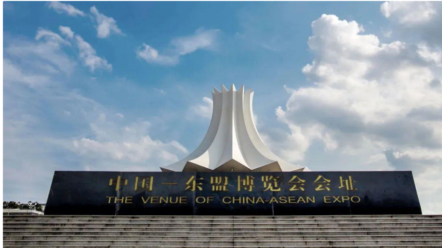
南宁国际会展中心朱槿花建筑造型

在历届自治区和南宁市政府领导的高度重视和正确指导下，南宁国际会展中心紧紧围绕城市发展总体战略，坚持改革创新，率先探索广西会展行业起步与发展，不断提高专业化、国际化、市场化、信息化水平，高质量完成各类重大展会项目落地。南宁国际会展中心建成后，改善了城市面貌，提升了城市功能，为保障服务民生及促进会展业高质量发展作出积极贡献，“会八方人脉，展天下风采”成为了南宁国际会展中心的服务理念。