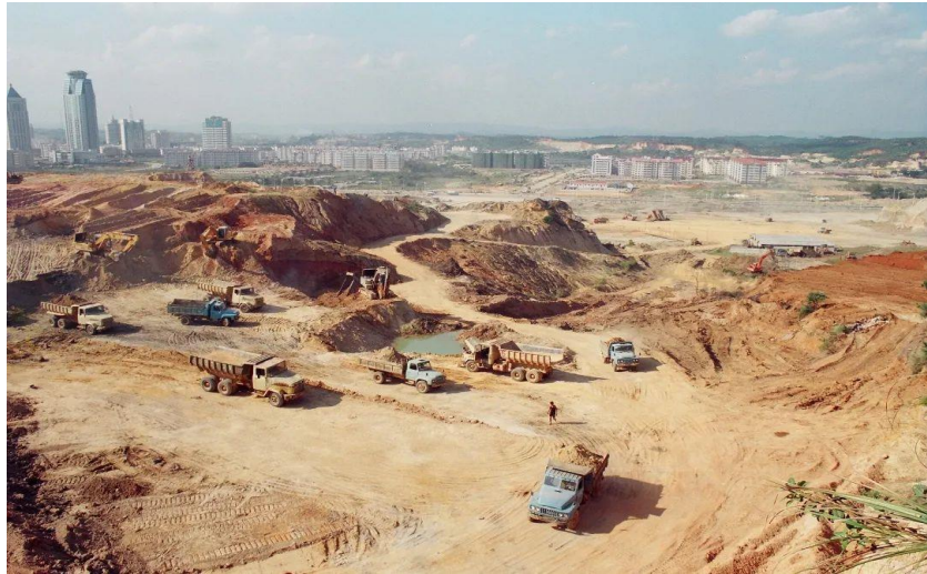
2001 年，正在建设中的一期会展中心

南宁国际会展中心一期工程始建于 2001 年，并于 2003 年 10 月建成并投入使用。2004 年起，中国—东盟博览会（以下简称东博会）永久落户广西南宁，南宁国际会展中心成为东博会的永久会址，南宁市政府当即确定并启动二期项目，新建 6 个展馆。