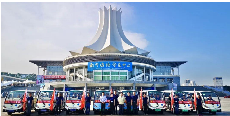
在服务东博会与峰会时带头先行的党员先锋号

2022年，是三年疫情会展办展最艰难的一年，南宁国际会展中心共承接展览、活动项目45场，会议584场，促进经贸合作近388亿元（不含东博会），“想主办方所想，急主办方所急”，周到细致的服务，多次获得主办方赠送锦旗和感谢信，得到社会各界的高度赞誉。