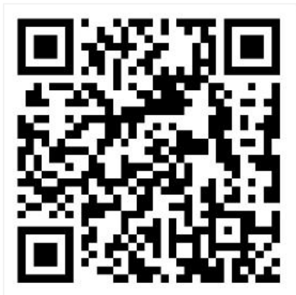
协会官方网站二维码