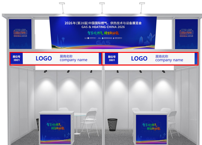
标准展位 楣板示意图