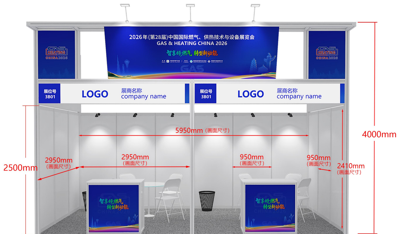
标准展位基本配置表