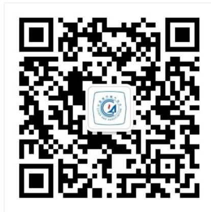
协会微信公众号二维码