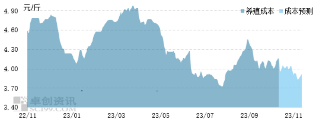
图 2 国内白羽肉鸡养殖成本预测走势图

再从鸡苗市场行情来看，9 月下旬至 10 月中上旬孵化企业出苗量环比减少，区内养殖亏损情况虽加重，但恰逢补栏年前倒数第二批毛鸡，养殖端补栏积极性提升，孵化企业排苗速度加快，11 月出栏肉鸡对应前期补栏鸡苗均价为 2.24 元/羽，环比涨幅 16.06%。