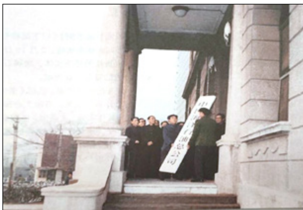
1982年2月中国海洋 石油总公司挂牌

海洋石油对外合作的显著特点是立法先行，率先建立起配套的法规体系。依据《条例》等有关法规，海洋石油资源属于国家所有，国务院决定对外合作重大政策，石油工业部管理区块划分、规划和油气田开发总体方案审批，中国海洋石油总公司负责具体实施。《条例》还明确：中国海洋石油总公司是国家石油公司，享有在对外合作海域进行石油勘探、开发生产和销售的专营权；拥有原油销售权，可以自营出口，也可以在国内销售，并按国际市场价格定价；拥有合作开采海洋石油所需设备、材料的进口权和审批权，并免征进口关税和工商统一税。这就划清了政府主管部门与国家石油公司的职责，使对外合作走上法制化、规范化的轨道，也使中国海洋石油总公司在国内石油企业中第一个基本摆脱计划经济体制的束缚，成为能够按照国际规则和惯例独立运作的市场主体和法人实体。1988年，国务院决定撤销石油工业部，原石油工业部的政府职能移交新成立的能源部行使，并以原石油工业部为基础成立中国石油天然气总公司，原归属石油工业部管理的中国海洋石油总公司正式分立直接隶属国务院管理。