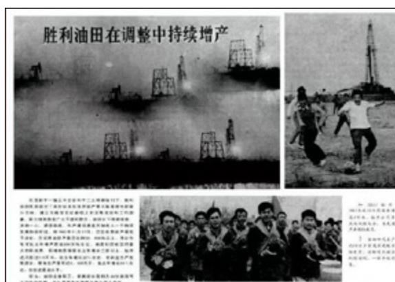
1983年11月17日 《人民日报》报道胜利油田持续增产消息

生产热情，增产节约潜力得到了有效发掘，潜在的生产力得到了充分解放，全国的原油产量持续增长。与此同时，石油工业大幅度增加技术研发投入，并利用留成外汇引进国外先进技术与设备，提高了国内勘探开发的技术装备水平；在生产发展的基础上，石油职工的工资收入水平也明显提升，油田生产生活条件得到有效改善。1987年，全行业人均年工资收入比1981年增长了95%。亿吨原油产量包干政策的推行，迅速使我国摆脱了勘探开发资金不足的困境，使中国石油工业走上了自我积累、自我发展、自我壮大的轨道。