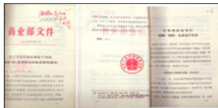
1982年商务部下达石油成品油“定 量包干”办法

例如在实行包干后，胜利油田的年原有产量指标是1590万吨，据此胜利油田对勘探开发重新做了部署，如改革管理体制、扩大油田自主权、建立福利激励基金、改善职工生活等内容。随着分级包干、责任到人的包干形式由点到面在全油田逐步展开。大包干使该油田的原油产量出现了奇迹般的增长：从1981年起三年包干，年年超产，超产幅度一年比一年大。从包干前的连续3年下滑变成了包干后的连续3年增长。可见，大包干在全国范围内的实施，极大激发了职工的