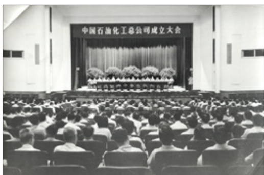
中国石油化工总公司成立大会

1983年2月19日，中共中央、国务院发出《中共中央、国务院批转国家经委等四部委〈关于成立中国石油化工总公司的报告〉的通知》，决定成立中国石油化工总公司，对原来分属石油部、化工部、纺织部等部门和若干地方管理的39个炼油、石油化工、化纤和化肥企业实行集中领导、统筹规划、统一管理。经过紧张筹备，1983年7月12日石化总公司在北京正式成立。时值改革开放初期，党的十一届三中全会后，我国经济发展进入“调整、改革、整顿、提高”时期，为用好1亿吨原油，特别是为解决人民的吃穿用和财政积累，确保实现国民经济翻两番目标，党中央、国务院决定对石油化工行业进行联合重组和体制改革，成立中国石油化工总公司，由此揭开了振兴我国石化工业的新篇章。石化总公司的成立，打破了当时我国石化工业多头领导、条块分割的状况，为发挥联合优势、实现统筹发展创造了体制条件，是我国工业发展实行公司化管理、按经济规律办事的重大改革。石化总公司成立后，以国家希望为使命，以满足人民需要为宗旨，充分发挥体制上的优势，经过八十年代开拓振兴、九十年代内涵发展，积极推进两个根本性转变，成功把石油化工建成国民经济的支柱产业，为实现“三步走”战略目标的头两步，即解决人民温饱问题、人民生活总体上达到小康水平，做出了重要贡献。