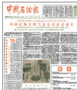
1988年9月21日《中国石油报》报道 中国石油天然气总公司在京成立

根据《国务院机构改革方案》要求，按照政企分开、转变职能的原则，中国石油天然气总公司组建后，原石油工业部政府职能（包括制定和发展战略、长远规划、重大方针和法规，确定对外合作区域以及组织协调、检查、监督等）移交能源部行使，原石油工业部在国家陆地全境（包括岛屿、海滩、水深0~5米