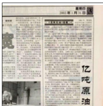
2002年1月31日《中国石油报》 报道亿吨原油产量包干消息

1982年，商务部《关于下达石油定量包干办法和农（渔）业用柴油补贴基数的通知》，规定：以1982年成品油分配计划为基数，定量包干供应，无论需求增减，包干基数不变。