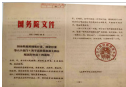
1983年国务院批转国家计委等6部门《关于高价原油加工和分配试行办法》的通知

(7) 根据以上原则规定，由商业部、石油部分别拟订具体实施细则，下达给各地炼油厂和石油经营部门执行。