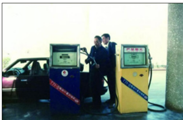
中国石油化工总公司销售公司加油站

自1985年1月1日起，国内石油产品经营业务由中国石化总公司统一管理，原商业部石油局及其直属单位，成建制划归中国石化总公司，成立中国石油化工总公司销售公司，统一经营石油产品在境内的销售，各省、自治区、直辖市石油公司组成独立的石油产品销售公司，由中国石油化工总公司和地方政府双重领导，主要负责中石化所属生产企业成品油（汽油、柴油、煤油、润滑油等）资源的统一收购、调拨、配送、结算和优化等工作。