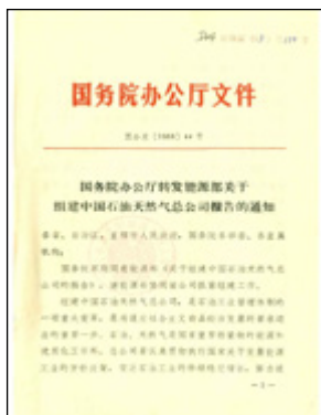
1988年8月29日《国务院办公厅转发能源部关于组建中国石油天然气总公司报告的通知》

1988年4月9日，第七届全国人民代表大会第一次会议审议通过《国务院机构改革方案》，决定撤销石油工业部、煤炭工业部、电力工业部，组建能源部。与过去成立国家能源委员会的尝试不同，国家能源部的组建被赋予了诸多向市场化转型的任务。其核心，就是实现政企分开，使企业成为能源行业的主角。8月29日，国务院办公厅转发能源部《关于组建中国石油天然气总公司报告》的通知，同意组建中国石油天然气总公司。9月17日，中国石油天然气总公司成立大会在北京举行。