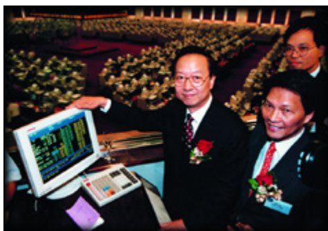
2000年10月中石化H股在香港联合交易所上市

(2) 2000年2月28日，中国石油化工集团公司独家发起设立的中国石油化工股份有限公司正式成立。同年10月18日和19日中国石油化工股份有限公司股票分别在纽约、香港、伦敦成功上市，香港交易所股票代码为00386；上海证券交易所股票代码为600028；纽约股票交易所存托股份代码为SNP。这是中国国有企业第一次在境外三地同时上市。中国石油化工股份有限公司首次公开发行167.8亿股H股，每股定价1.6港元，为每股净资产的1.2倍，共募集资金34.62亿美元。上市后，集团公司持有的国有股约占总股本的56.9%，国有资产管理司和银行持股约占23.1%，外资股占20%。重组改制上市成功，从管理体制上解决过去计划经济体制下产生的“大而全”、“小而全”、多级法人、分散决策的种种弊端，为初步建立适应市场经济的新体制新机制创造了条件。122万员工以大局为重，保持稳定，增进团结，提高效益，确保安全，为成功上市做出了积极贡献。