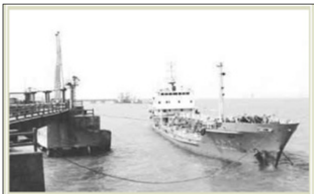
海南第一艘 保税油到港

2006年7月12日，国家商务部、财政部、交通部、海关总署联合下发了《关于增加中石化中海船舶燃料供应有限公司等四家企业从事国际航行船舶保税油供应的批复》，加上中国船舶燃料有限公司，共五家企业具有保税油经营资质，即中国船舶燃料有限公司、中石化中海船舶燃料供应有限公司、中石化长江燃料有限公司、中石化浙江舟山石油分公司、深圳光汇股份有限公司。