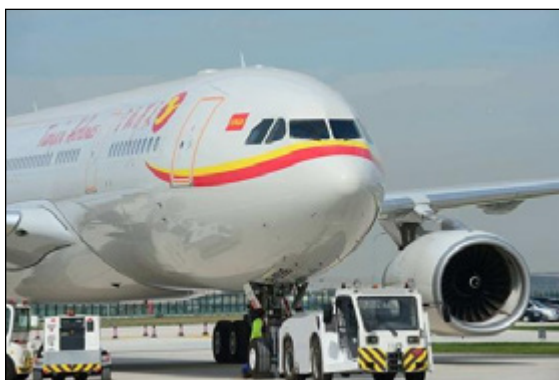
中国航油在新加坡 成功上市

(4) 2001 年 12 月 6 日，中国航油（新加坡）股份有限公司在新加坡主板上市，发行股票 1.44 亿股，每股发行价 0.56 新加坡元，共募集资金 8064 万新加坡元。