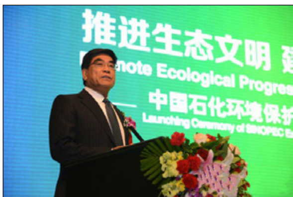
2012年11月29日中石化 董事长做主旨发言

公司环境保护白皮书》（2012版），这是中国石油化工集团公司首次发布环境保护白皮书，也是中国企业发布的首个环境保护白皮书。《中国石油化工集团公司环境保护白皮书》分为前言、主体和展望三部分。前言部分提出了中国石油化工集团公司的环保理念、成效和责任。主体部分从公司治理、绿色战略、低碳能源、清洁生产等8个方面介绍了中国石油化工集团在绿色低碳和环境保护方面的工作，并选用24个有代表性、针对性的案例。展望部分提出了中国石油化工集团公司关于环境保护的更高追求、重点方向以及责任和承诺。