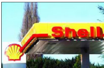
壳牌进入中国成品油 零售市场

(1) 2004 年 8 月 28 日，中国石化与壳牌公司合资成立了中石化壳牌（江苏）石油销售有限公司，成立庆典仪式在江苏南京隆重举行。2005 年 1 月 1 日起正式运营，该公司是中国第一家经国务院批准的从事成品油零售业务的中外合资公司，中外合资股比例为 6:4。合资项目将在江苏省建立和运营约 500 家加油站，经营期为 40 年，采用中国石化与壳牌的联合品牌。项目总投资为 15.51 亿元人民币，注册资本 8.3 亿元人民币。其中：中国石化股份有限公司以加油站实物资产等出资 4.98 亿元人民币，占 60% 股份；壳牌中国控股私有有限公司出资 2.49 亿元，占 30% 股份；壳牌（中国）有限公司出资 0.83 亿元人民币，占 10% 股份。