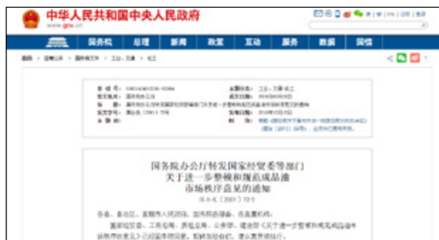
2001年9月28日国务院出台《关于进一步清理整顿和规范成品油市场秩序的意见》

两年多来，根据《国务院办公厅转发国家经贸委等部门关于清理整顿小炼油厂和规范原油成品油流通秩序意见的通知》精神，各地区、各有关部门对成品油经营企业进行了一次全面的清理整顿，取得了初步成效。但是由于政出多门、利益驱动、监管不严等原因，成品油市场秩序仍存在一些问题，特别是一些地区和部门越权擅自批准建设加油站（点），造成加油站盲目重复建设，市场恶性竞争，不仅扰乱了成品油市场秩序，而且严重影响了石油石化行业的改革发展和国民经济的健康运行。为了解决这一系列的问题，国务院办公厅于2001年9月转发国家经贸委等五部门《关于进一步整顿和规范成品油市场秩序的意见》。意见指出：严厉查处违法违规建设和经营加油站；严格成品油市场准入，进一步规范成品油市场秩序；加强领导、分工负责、狠抓落实。这份意见在《关于清理整顿小炼油厂和规范原油成品油市场秩序的意见》的基础上，进一步重申了石油、石化两大集团享有专营权。新建的加油站必须由石油、石化集团全资或控股建设，这赋予了国营企业零售经营权，切断了非国营企业自主经营、销售成品油的渠道。该意见还强调了成品油由中国石油天然气集团公司、中国石油化工集团公司集中批发，其他企业不得批发经营。这意味着民营企业即使获得了进口配额，进口的原油也必须交由石油、石化集团处置，不得自行使用、经营。该意见进一步保护了国营企业在油气行业的垄断地位，使得非国营企业进入油气行业变得异常艰难。“进一步”集中体现在三个方面：一是政府部门规范审批程序，加强自律；二是调整加油站建设、管理体制，新建加油站由中国石油天然气集团公司、中国石油化工集团公司负责；三是强化了责任追究。