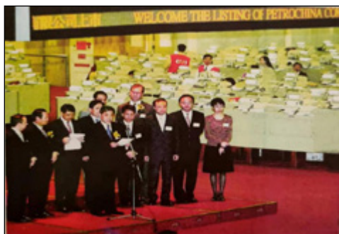
2000年4月6日中国石油在香港联合交易所挂牌上市现场

(2) 2000年2月28日，中国石油化工集团公司独家发起设立的中国石油化工股份有限公司正式成立。同年10月18日和19日中国石油化工股份有限公司股票分别在纽约、香港、伦敦成功上市，香港交易所股票代码为00386；上海证券交易所股票代码为600028；纽约股票交易所存托股份代码为SNP。这是中国国有企业第一次在境外三地同时上市。中国石油化工股份有限公司首次公开发行167.8亿股H股，每股定价1.6港元，为每股净资产的1.2倍，共募集资金34.62亿美元。上市后，集团公司持有的国有股约占总股本的56.9%，国有资产管理司和银行持股约占23.1%，外资股占20%。重组改制上市成功，从管理体制上解决过去计划经济体制下产生的“大而全”、“小而全”、多级法人、分散决策的种种弊端，为初步建立适应市场经济的新体制新机制创造了条件。122万员工以大局为重，保持稳定，增进团结，提高效益，确保安全，为成功上市做出了积极贡献。