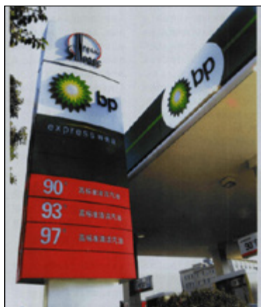
2004年10月26日中石化BP“双品牌”加油站在宁波市彩虹路与消费者见面

(2) 2004年10月26日，中石化碧辟（浙江）石油有限公司在浙江省工商行政管理局登记成立。中石化碧辟（浙江）石油有限公司是中国政府迄今所批准的第三家成品油零售合资公司，同时也是英国BP集团在华获准成立的第二家成品油零售合资企业。中石化碧辟（浙江）石油有限公司合资期限为30年，采用中国石化与BP集团的联合品牌。项目总投资21.88亿元人民币，注册资本为8亿元人民币，其中：中国石化股份有限公司以加油站实物资产和现金共出资4.8亿元人民币，占60%；英国BP集团以3.2亿元人民币的等值美元出资，占40%。该公司以中石化现有加油站网络整体转入为主，在浙江省杭州市、宁波市、绍兴市三地建立和运营一个拥有500座加油站的服务网络，主要经营范围是零售汽油、柴油、煤油、润滑油和加油站便利店货物以及其他加油站附属设施服务等。在成品油供应方面，中国石化是合资公司的独家供应商。成立合资成品油零售企业“中石化碧辟（浙江）石油有限公司”后不久，悬挂着醒目的黄绿太阳花标志的中国石油化工股份有限公司BP“双品牌”加油站在宁波市彩虹路与消费者见面，这也是BP与中国石油化工股份有限公司在浙江省联手打造的第一座合资加油站。