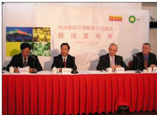
2004 年 11 月 18 日中国石油天然气股份有限公司 和英国碧辟公司在广州联合召开了新闻发布会

(3) 2004 年 11 月 18 日，英国 BP 集团与中国石油天然气股份有限公司合作的成品油零售合资企业——中油碧辟石油有限公司在广州正式挂牌投入运营。它是中国石油天然气股份有限公司与英国 BP 集团联合组建的中国第一家同时也是最具规模的成品油零售合资企业。中油碧辟石油有限公司是迄今中国政府所批准成立的三家成品油零售企业之一。中油碧辟石油有限公司采用中国石油与 BP 集团的联合品牌，项目投资总额为 47.75 亿元人民币，注册资本为 15.85 亿元。中国石油天然气股份有限公司和 BP 分别持股 51% 和 49%。