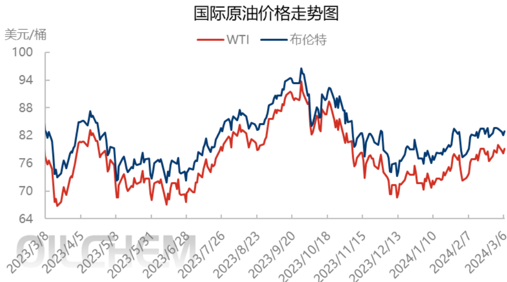
图表 6 下周国际原油市场可预见性利好利空因素分析