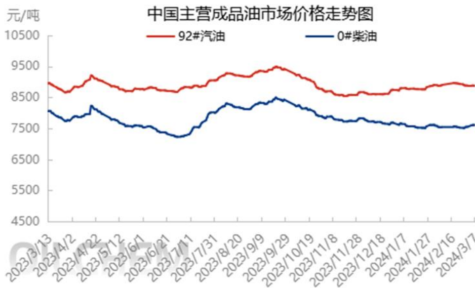
图表 2 中国主营成品油市场价格走势图

隆众资讯统计，本周期内主营单位呈现汽跌柴涨走势（汽油 92#8864，-13；柴油 0#7598，+47）。