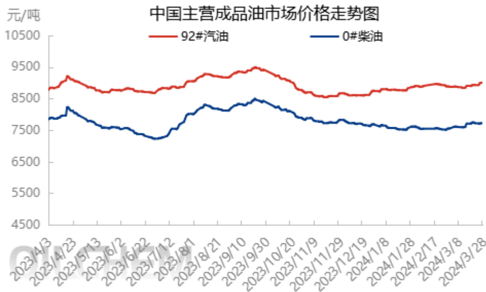
图表 2 中国主营成品油市场价格走势图

隆众资讯统计，本周期内主营单位呈现汽涨柴跌走势（汽油 92#9007，+80；柴油 0#7708，-17）。