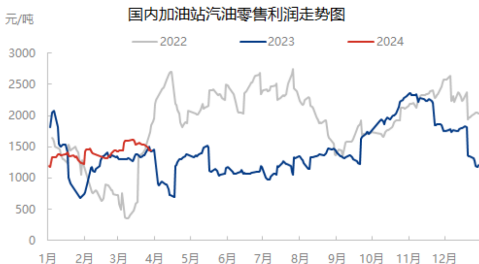
图表 3 中国加油站汽油零售理论利润