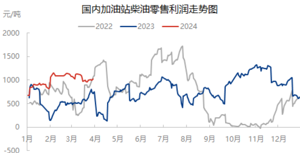
图表 4 中国加油站柴油零售理论利润

隆众资讯测算，截至3月28日当周，加油站92#汽油零售利润均值为1469元/吨，较上周降75元/吨，降幅4.86%。0#柴油零售利润均值1006元/吨，较上周涨33元/吨，涨幅3.39%；主因本周汽柴零售限价未作调整，批发价格汽涨柴降。