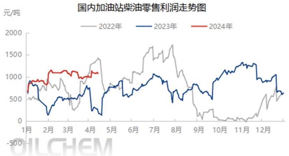
图表 4 中国加油站柴油零售理论利润

隆众资讯测算,截至4月11日当周,加油站92#汽油零售利润均值为1395元/吨,较上周降43元/吨,降幅2.97%。0#柴油零售利润均值1090元/吨,较上周涨30元/吨,涨幅2.83%;本周期内汽油原料价格趋坚,带动成品汽油价格稳步