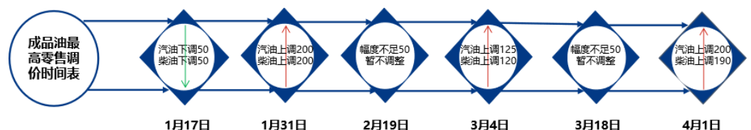
图表 7 成品油最高零售调价时间表