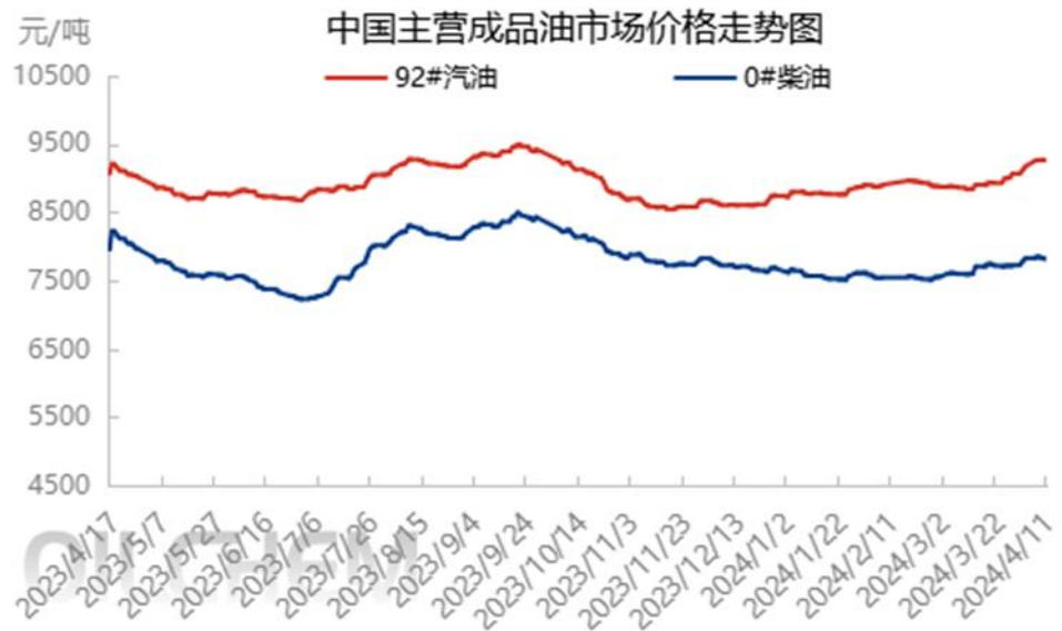
图表 2 中国主营成品油市场价格走势图

隆众资讯统计，本周期内主营单位呈现汽涨柴跌走势（汽油 92#9273，+19；柴油 0#7820，-27）。