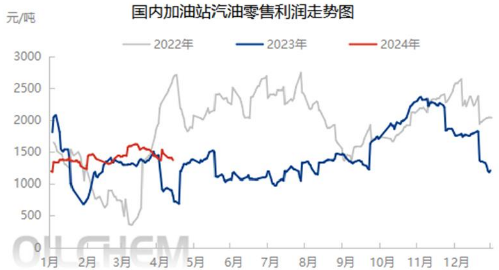
图表 3 中国加油站汽油零售理论利润