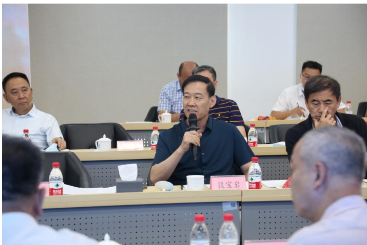
(中国工程院院士 段宝岩)