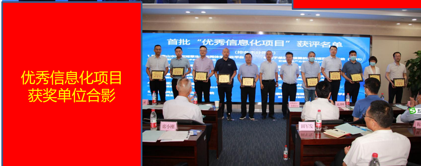
优秀信息化项目 获奖单位合影