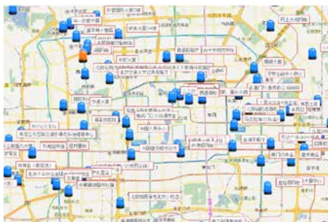
北京“控烟一张图”助力全民微信举报违法吸烟，图中显示的被举报地点。

“我要上鸟巢”笑脸照片征集活动鸟巢上悬挂的巨大旗帜就是由包括成千上万个北京控烟条例受益者在内的笑脸拼成的。笑脸代表北京老百姓在过去12个月中受益于《北京市控制吸烟条例》的欢欣鼓舞，也代表中国其他地区的人们希望实现无烟中国的美好愿望。