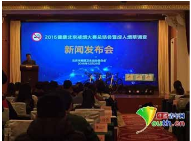
2016健康北京戒烟大赛总结暨成人烟草调查新闻发布会

在北京,问及室内公共场所禁烟的效果,得到的回答都是:“现在好多了!”“就得这样抓!”