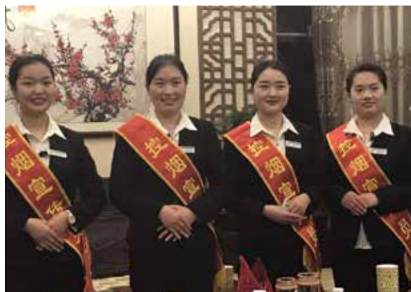
北京市开展“无烟享美味，健康我做主——无烟示范餐厅创建”活动，共有822家餐厅申报无烟示范餐厅