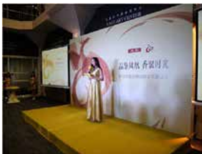
上海烟草集团举办凤凰创牌60周年庆典活动，免费品吸

更有甚者，2016年中国烟草总公司印发通知，在全国范围内开展“消费者在哪里，我们就到哪里”卷烟主题营销。其中不乏婚庆、喜庆、开业、新品上市等活动。