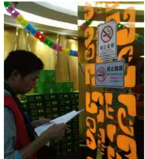
2016年12月11日,深圳市控烟办、市区公安部门、市控烟协会控烟志愿者监督大队联合举办“2016年深圳市限制吸烟场所10区联动大型控烟督查活动”。