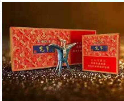
四川中烟与五粮液集团合作“爆珠”细支“宽窄（五粮浓香）”