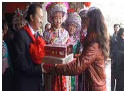
烟草业瞄准婚礼等喜庆市场，寻找消费者、拉拢消费者

开展所谓的主题营销活动，活动中的品牌展示、宣传广告、品吸、促销，都是剑走偏锋，与《公约》及《广告法》等国际法、国内法抗衡。