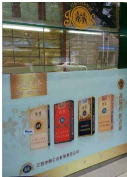
南昌市市场和质量技术监督局将室内橱窗江西金圣“三好:好看、好抽、好卖”违法烟草广告界定为“户外烟草广告”

我们呼吁：广告监管的执法机关，应依据新《广告法》的相关规定强化烟草广告的监管和执法力度，从被动监管到主动出击。我们更希望立法机关能够公布相应的法律解释，职能部门为执行法律而制定相应规章。