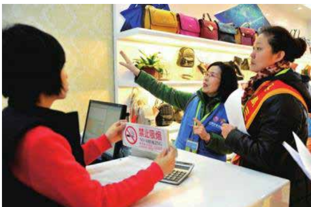
志愿者对无烟发挥执行的监督