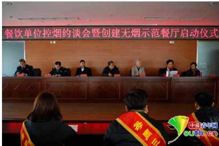
违法单位集中约谈：2016年11月1日，北京市卫生监督所就控烟问题约谈了包括大鸭梨、金手勺、眉州东坡、海底捞、金鼎轩等知名餐饮企业在内的全市13家餐饮单位。

机制的优势，坚持政府管理、单位负责、个人守法、社会监督这一原则，采取政府与社会共同治理、管理与自律相结合，杜绝了九龙治水，为其他城市控烟立法和执法提供了借鉴。自2015年6月北京市控烟法规实施至2016年11月30日，违法吸烟罚款近200万元；其中，处罚单位663户，罚款183.6万元；责改个人数2480人，处罚2719人，罚款14.25万元。