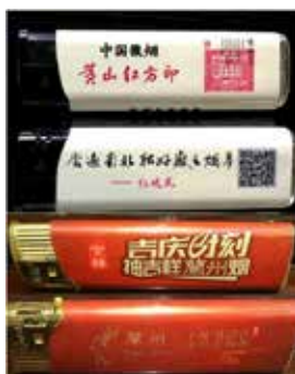
印在打火机上的“黄山”、“兰州”烟草广告