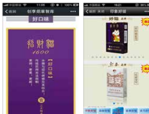
深圳腾讯微信平台““陕西好猫””发布的违法烟草广告。