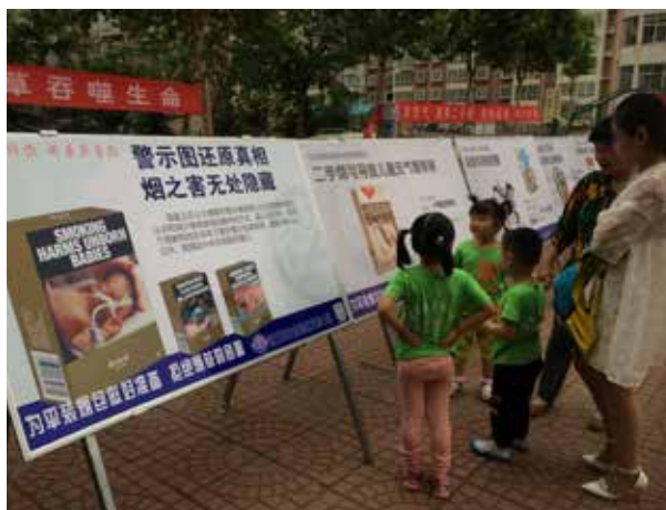
山东省莱芜市“我要告诉你，因为我爱你——警示图还原真相，烟之害无处隐藏”活动现场