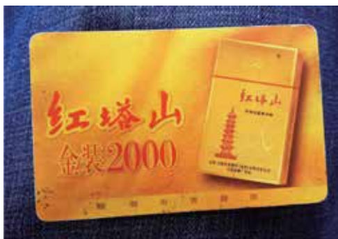
高速公路ETC收费卡上的“红塔山”烟草广告