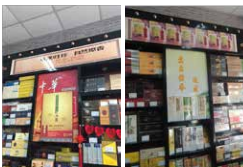
被投诉的大兴糖酒公司双喜、中华违法烟草广告 被北京市工商行政管理局大兴区分局予以拆除