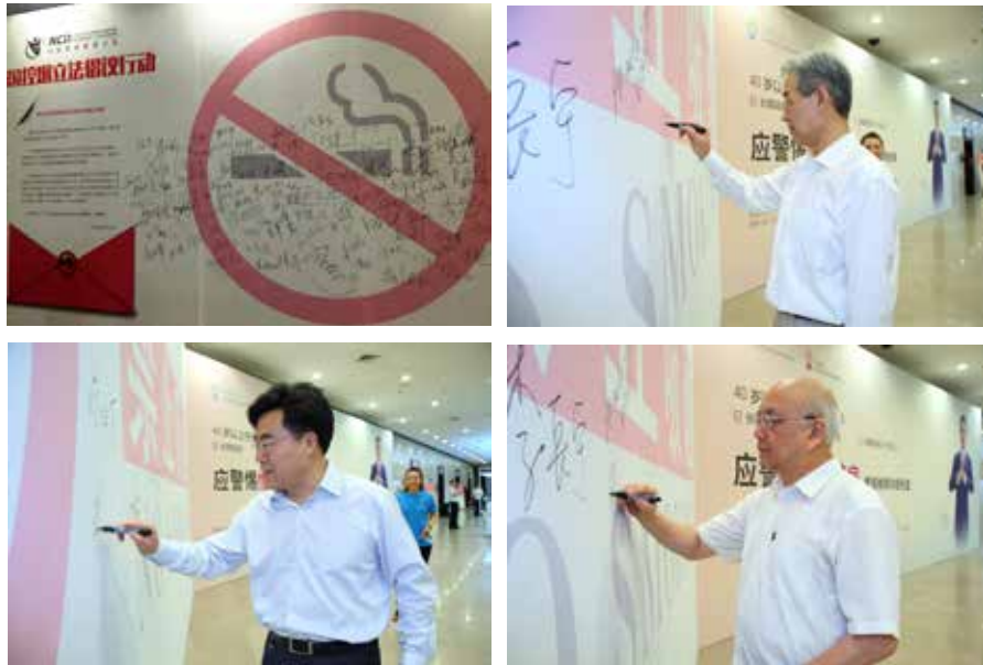
第七届慢病管理大会：我为控烟代言——全国控烟立法倡议行动

自2014年以来，中国先后有18个城市制订了公共场所禁止吸烟的法律或法规，许多城市在2016年6月国务院法制办《草案修改意见稿》反馈意见中，明确提出了国家立法应在现有地方无烟立法的基础上，坚持室内全面禁止吸烟。