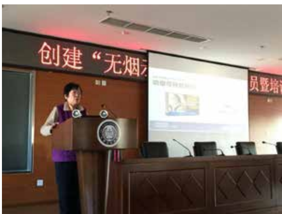
对场所人员进行劝阻违法吸烟36计技巧培训