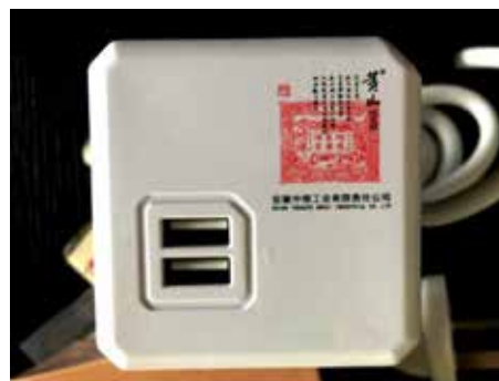
印上充电宝的“黄山”烟草广告