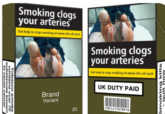
英国 2017 年平装烟包