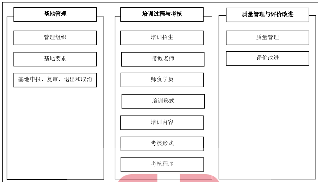
图1 临床药师师资培训关键要素