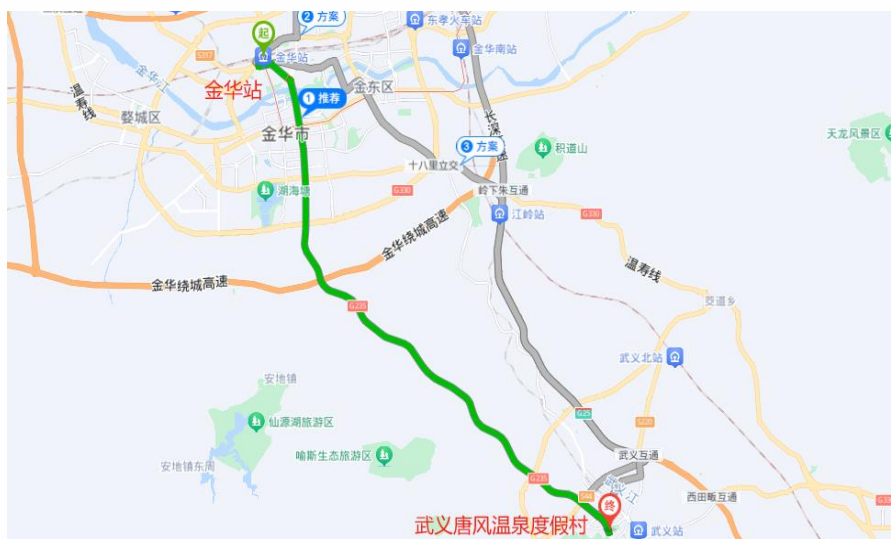
△金华站——武义唐风温泉度假村路线

金华站前往酒店导航地址：浙江武义唐风温泉度假村（武义县环城北路77号）（用时约47分钟）