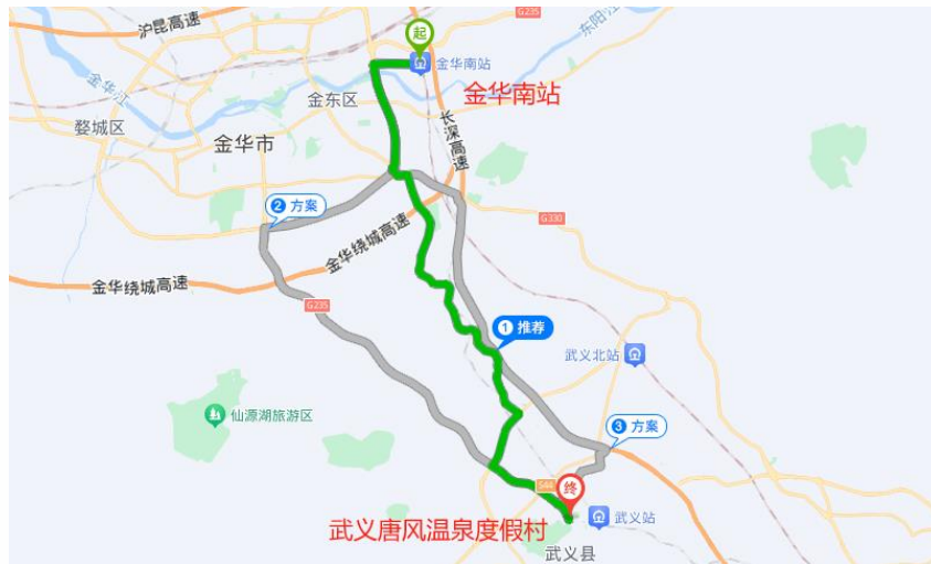
△金华南站——武义唐风温泉度假村路线

金华南站前往酒店导航地址: 浙江武义唐风温泉度假村 (武义县环城北路 77 号) (用时约 49 分钟)