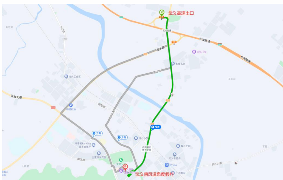
△ 武义高速出口——武义唐风温泉度假村路线

导航地址：浙江武义唐风温泉度假村（武义县环城北路 77 号）（用时约 13 分钟）